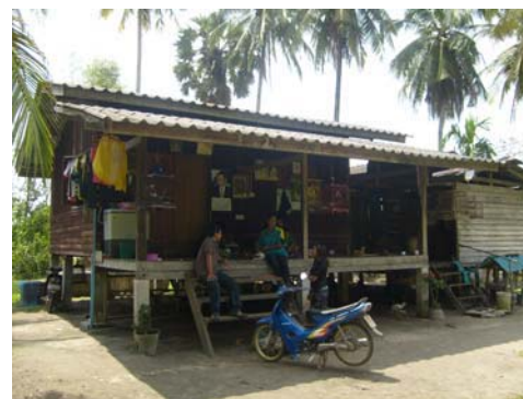
ภาพที่ 12 การสัมภาษณ์ชาวบ้าน จ.ตรัง