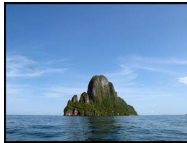
เกาะตะเกียง