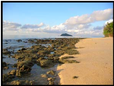
เกาะเกตรา