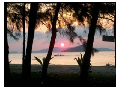
เกาะบุโหลนเล