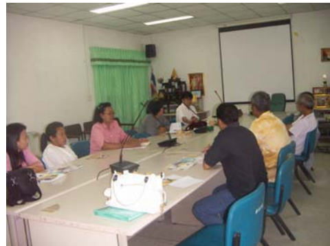
ภาพที่4 ประชุมเวทีชาวบ้าน จังหวัดสงขลา