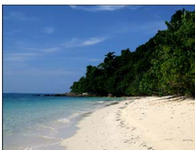
เกาะบุโหลนไม้ไผ่