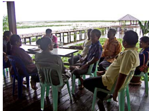
ภาพที่2 ประชุมเวทีชาวบ้าน จังหวัดพัทลุง