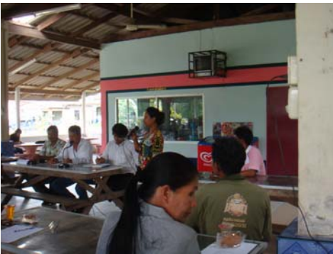
ภาพที่3 ประชุมเวทีชาวบ้าน จังหวัดตรัง