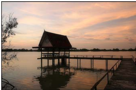
อุทยานนกน้ำคูชูด