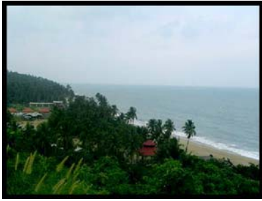
เขาพลายดำ