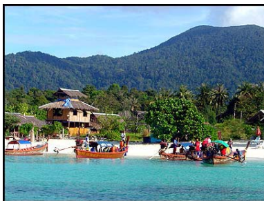
เกาะหลีเป๊ะ