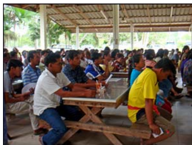
การประชุมเวทีชาวบ้าน