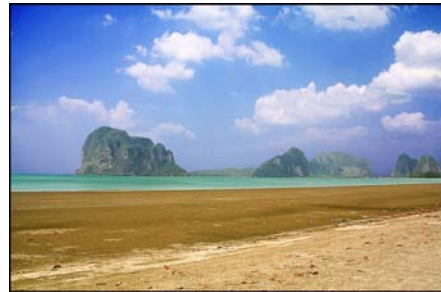
หาดปากเมง