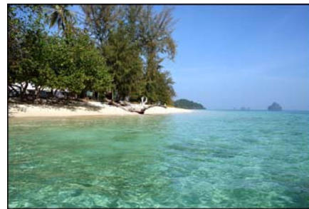
เกาะกระดาน