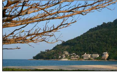
อ่าวขนอม