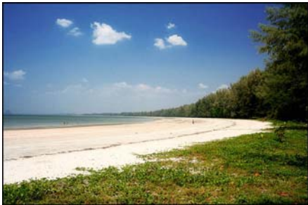
หาดเจ้าไหม