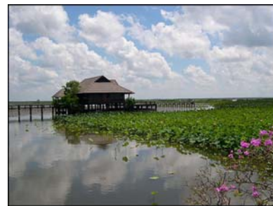
อุทยานนกน้ำทะเลน้อย