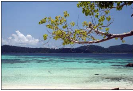
เกาะอาดัง