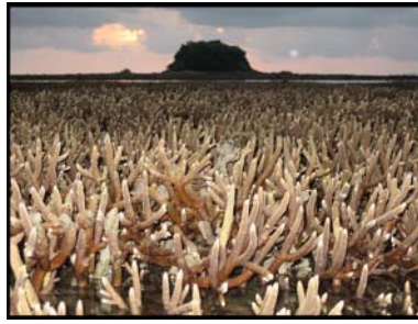
แหล่งปะการังบริเวณเกาะลิตี