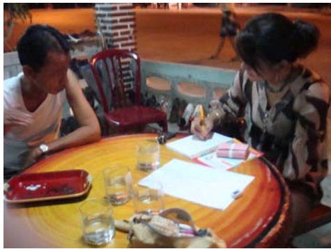
ภาพที่7 สัมภาษณ์ชาวบ้าน จังหวัดตรัง