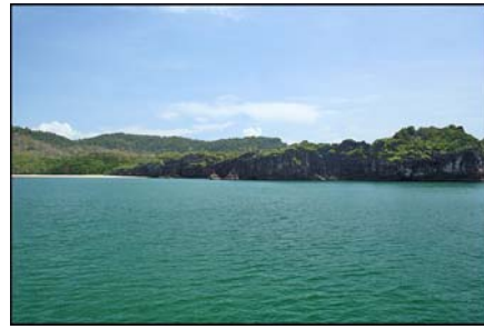
เกาะตะรุเตา