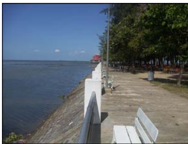
หาดแสนสุขลำปำ