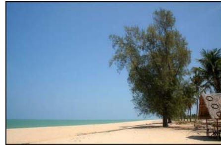
แหลมตะลุมพุก