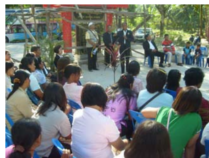
ภาพที่10 ประชุมเวทีชาวบ้านจ.นครศรีธรรมราช