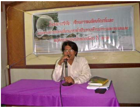
ภาพที่1 ประชุมเวทีชาวบ้าน จังหวัดพัทลุง