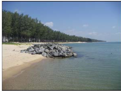
แหลมสมิหลา