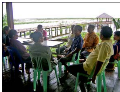
การประชุมเวทีชาวบ้าน