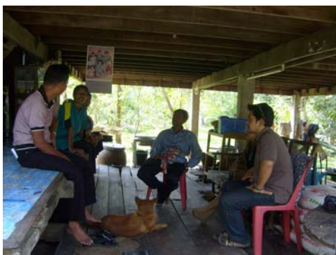
ภาพที่ 11 การสัมภาษณ์ชาวบ้าน จ.ตรัง