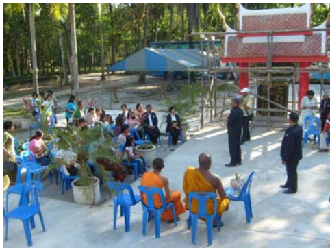
ภาพที่9 ประชุมเวทีชาวบ้าน จ.นครศรีธรรมราช