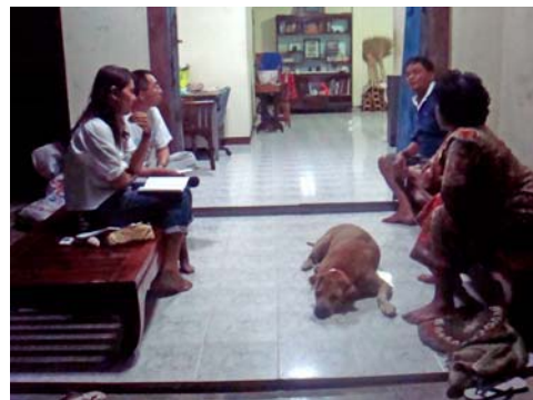
ภาพที่6 สัมภาษณ์ชาวบ้าน จังหวัด นครศรีธรรมราช