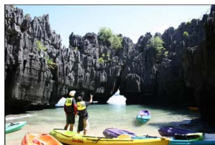
ปราสาทหินเขาพันยอด