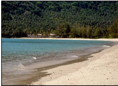
หาดโนพะลา