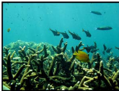
จุดดำน้ำบริเวณเกาะตะเกียง