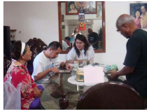
ภาพที่8 ประชุมเวทีชาวบ้าน จังหวัด นครศรีธรรมราช