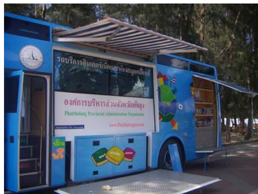
ภาพที่ 4 การจัดกิจกรรมเพิ่มเติมบริเวณหาดสมิหลา (สงขลา) และหาดแสนสุขลำปำ (พัทลุง) เพื่อดึงดูดนักท่องเที่ยว

2.8 ด้านการมีส่วนร่วมของชุมชน ได้แก่ โอกาสของชุมชนในการเข้าร่วมดำเนินการและตัดสินใจเกี่ยวกับการจัดการท่องเที่ยว การมีส่วนร่วมของชุมชนในการได้รับผลประโยชน์จากแหล่งท่องเที่ยว ความเป็นมิตรจากคนในชุมชน เป็นต้น