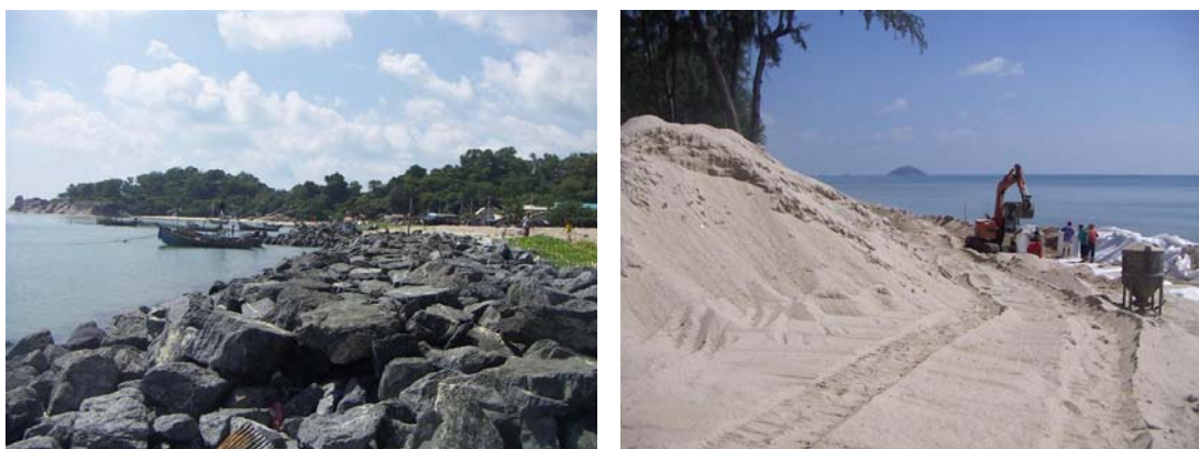
ภาพที่ 3 แสดงการนำหินและทรายมาปรับแต่งบริเวณหาดสมิหลา จังหวัดสงขลา เพื่อป้องกันน้ำทะเลกัดเซาะชายฝั่ง และเพิ่มพื้นที่ชายหาด

สิ่งแวดล้อมในบริเวณนั้น นอกจากนี้ที่หาดสมิหลายังได้มีการนำทรายจากภายนอกมาถมบริเวณชายหาดเพื่อป้องกันการพังทลายของชายหาดในบริเวณนั้นด้วย