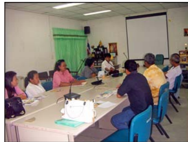
การประชุมเวทีชาวบ้าน