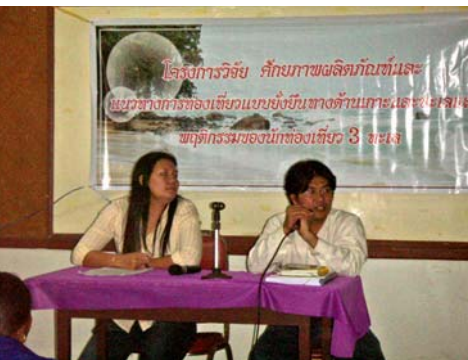
ภาพที่5 ประชุมเวทีชาวบ้าน จังหวัดสตูล