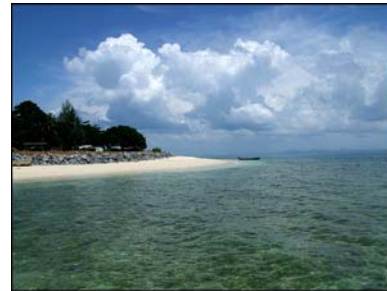
เกาะบุโหลนดอน