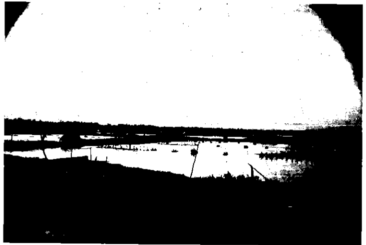
นาุ้งที่บ้านปากกระวะ อำเภอหัวไทร พ.ศ. ๒๕๓๘

ปิ รังอดีตบ้านปากกระวะ ซึ่งเป็นหมู่บ้านในอำเภอหัวไทร จังหวัดนครศรีธรรมราชเป็นสังคมปิด สถาบันครอบครัวถือเป็นทั้งหน่วยผลิตและหน่วยบริโภคที่แท้จริง อาชีพหลักก็คือการทำนา ยกเว้นผู้ที่อยู่ในพื้นที่ติดชายฝั่งทะเลและคลองปากกระวะที่ทำอาชีพประมง แต่ก็มีจำนวนไม่มากนัก การทำนาสมัยนั้นเป็นไปเพื่อการบริโภค ส่วนที่เหลือจึงจะนำไปขาย การทำนาข้าวจึงไม่สร้างรายได้ให้ชาวปากกระวะมากนัก ฐานะของชาวบ้าน