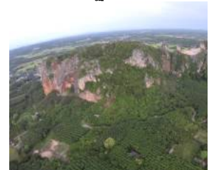
ภาพเขาคูหาบ้านฉาง สายน้ำในภา ตะเคียน ที่เป็นธารน้ำที่ไหลลด ไปหล่อเลี้ยงพื้นที่เกษตรกรรมอีก คูหา ไหลลดผ่านถนนสายเอเชีย โบราณที่มีน้ำไหลตลอดทั้งปี แห นำไปส่งออกทั้งที่ขอประทานบัตร อุตสาหกรรมก่อสร้าง มีความพยา โดยตลอดด้วยเหตุผลว่าไม่มีผลก แวดล้อมและประชาชน ผู้เดือดร้อน ความเป็นธรรมอย่างถ้วนหน้า เหน ต่ออายุประทานบัตร เช่น นายบุญ นักวิเคราะห์นโยบายและแผนช่าง