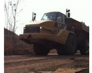
ถนนปกติ กระไรเลยจะรองรับน้ำหนัก เหมืองขี้แฉงในที่ประชุมว่า ได้เสรี ในจุดนั้น