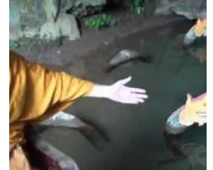
พญานาคถ้ำน้ำ วัดถ้ำคูหาวาริ บ้าน โคกขมิ้น อำเภอรังษะพุง จังหวัด https://www.facebook.com/me set=a.10200683467550703.1