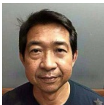
จบปัญหา ลงใต้ตา ริ้วรอย เพียงคลิกใช้ "Ageless"