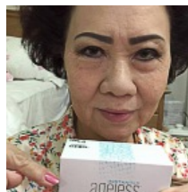
ริ้วรอย ตีนกา ร่องแก้มหาย ลงวิธีนี้คลิก!!