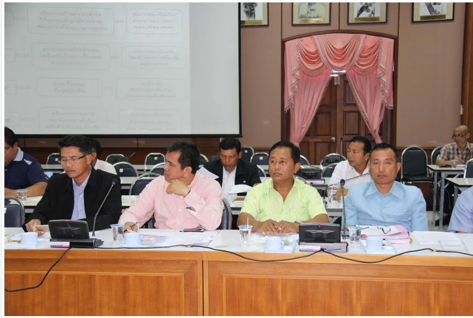
(คลิกเพื่อดูต้นฉบับ) unnamed (51).jpg (93.95 kB, 1200x800 - ดู 108 ครั้ง.)

แจ้งลบกระทู้นี้หรือติดต่อผู้ดูแล บันทึกการเข้า