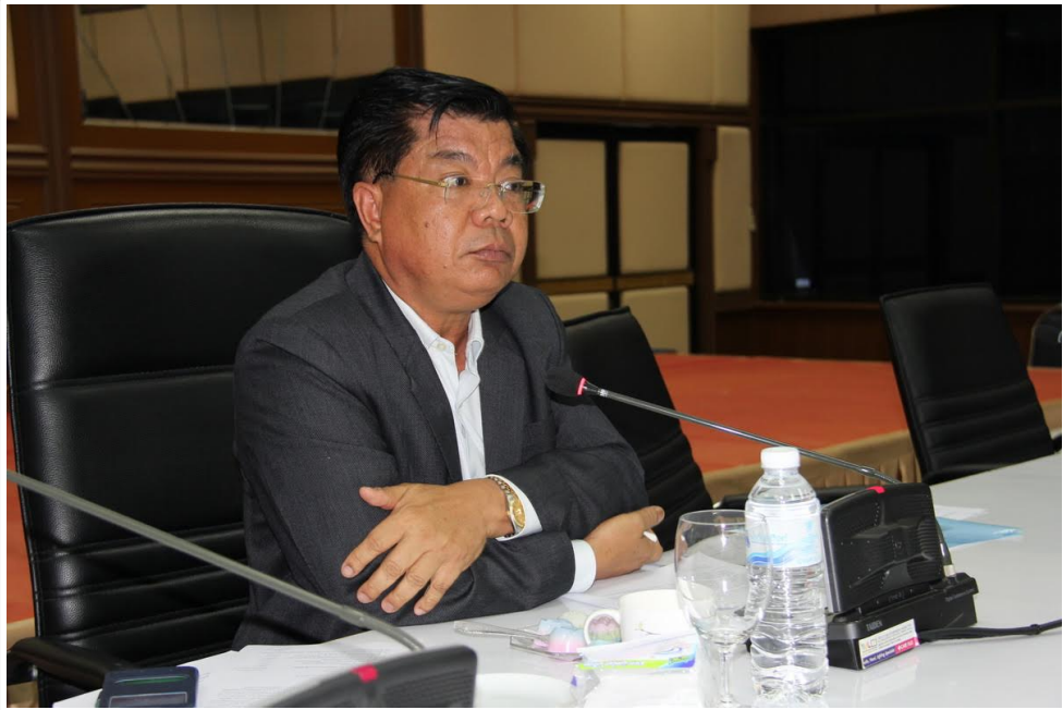
(คลิกเพื่อดูต้นฉบับ) unnamed (49).jpg (69.83 kB, 1200x800 - ๑ 413 ครั้ง.)