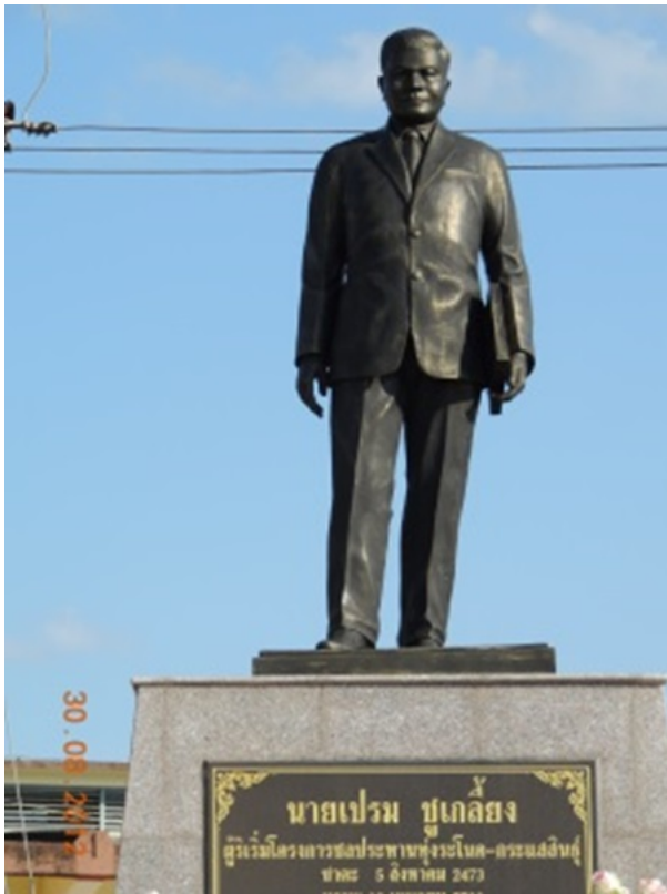
รูปเหมือนขนาดเท่าครึ่ง เปรม ชูเกลี้ยง

12 มกราคม 2559 12:46 น. (แก้ไขล่าสุด 12 มกราคม 2559 13:13 น.)