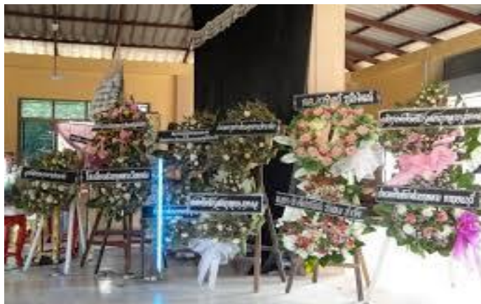
ภาพที่ 9 บรรยากาศการวางพวงหรีดเคารพศพ 18 กรกฎาคม 2561

การสวดพระอภิธรรมประจำคืน หรือที่ชาวบ้านเรียกว่า "สวดศพ" เริ่มจัดทำตั้งแต่วันตั้งศพเป็นต้นไปทุกคืนส่วนใหญ่จะสวดเวลา 19.00 น. โดยจะตั้งศพ 3 คืน 5 คืน 7 คืน ขึ้นอยู่กับความสะดวกของทางเจ้าภาพ เนื่องจากเจ้าภาพต้องดูแลจัดการงานทั้งงานทั้งดูแลแขกที่มาร่วมงาน วางแผนเรื่องพระสงฆ์ เรื่องการเผาศพ ของชำร่วย ดอกไม้ พิธีต่าง ๆ ที่สำคัญคือการเลี้ยงอาหารแขกที่มาร่วมงาน ซึ่งปัจจุบันมีจำนวนมากขึ้นด้วยระบบการสื่อสารที่รวดเร็วทั่วถึงกัน คนมาจำนวนมากและเรื่องอาหารนั้นสำหรับชาวขรัวช่วยถือว่าสำคัญที่สุด ดังคำกล่าว