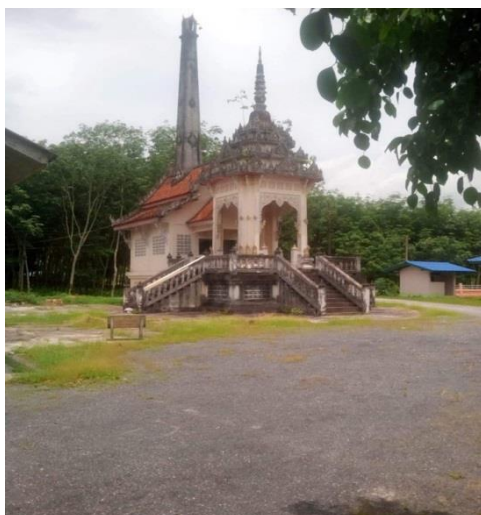
ภาพที่ 4 เมรุเผาศพวัดดอนกลาง สร้างเมื่อ พ.ศ. 2534

(สมใจ ธาณิรัตน์, สัมภาษณ์เมื่อ 25 มิถุนายน 2561)