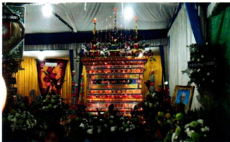
ภาพที่ 1 การตกแต่งหน้าศพ/โลงศพในชุมชนวัดมัชฌิมภูผา (ตอนกลาง)

มีรูป เพื่อต้อนรับผู้ที่เข้ามาร่วมงานศพในการไหว้เคารพผู้ตายเป็นครั้งสุดท้าย อีกทั้งบริเวณงานศพยังมีอาหารเตรียมพร้อมรองรับผู้ที่เข้ามาร่วมงานศพเพื่อเป็นการต้อนรับ และในวันสุดท้ายของการจัดงานศพคือวันฌาปนกิจ จะมีพิธีกรคอยบอกกล่าวถึงพิธีกรรมสุดท้ายของชีวิต โดยจะนิมนต์พระสงฆ์มาสวดมนต์เพื่อสวดส่งท้ายให้กับผู้ตายและเทศนาสั่งสอนคติธรรม โดยศพจะตั้งยกตั้งไว้บนเมรุเป็นที่เรียบบร้อย และที่เมรุก็จะมีการประดับประดามีการผูกผ้าขาวดำที่เมรุ มีการจัดวางพวงหรีดและดอกไม้ประดับเมรุ พิธีกร (มักทายก) จะนำทุกคนสู่พิธีการทอดผ้าบังสุกุล โดยเรียงลำดับการให้เกียรติผู้ใหญ่ที่เคารพไว้หลังสุดจะนิมนต์พระชั้นผู้ใหญ่ชกผ้าบังสุกุลในลำดับท้าย