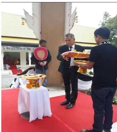
ภาพที่ 6 เชิญแขกผู้ใหญ่/ประธานในพิธี ทอดผ้าบังสุกุล