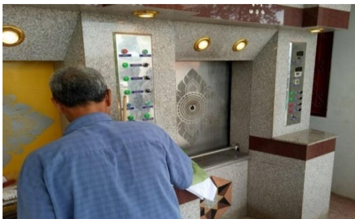
ภาพที่ 15 การเผาศพเตาเผาไร้มลพิษ (เตาเผาไฟฟ้า) ที่มา: ถ่ายโดยผู้วิจัย 12 พฤศจิกายน 2561