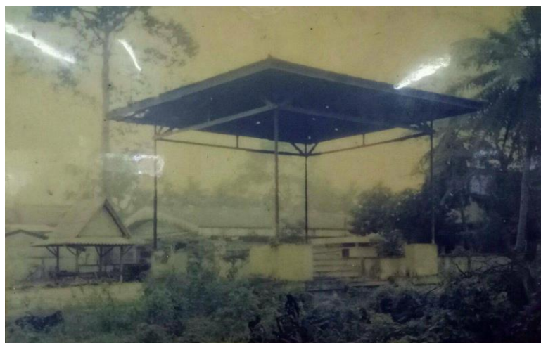
ภาพประกอบ 1 เชิงตะกอนวัดชะเมา

แม้ในปัจจุบันมนุษย์ก็ยังให้ความสำคัญแก่ผู้ตาย มีพิธีกรรมปฏิบัติเป็นประเพณี เป็นวัฒนธรรมสืบทอดกันมาช้านาน ซึ่งอาจมีความแตกต่างกันไปบ้างแล้วแต่ความเชื่อศรัทธาของแต่ละสังคม และพิธีกรรมเกี่ยวกับการตายนั้นมักจะต่อเนื่องกันในทางศาสนา มีพระเป็นปัจฉยหลักในการประกอบพิธี ถ้ามีการตายก็นิมนต์พระมากระทำพิธีทางศาสนา ตั้งแต่สวดพระอภิธรรม การเทศนา การนำศพไปยังสถานที่ประกอบพิธีเผา ไม่ว่าจะเป็ป่าช้า วัดหรือฌาปนสถานอื่น ๆ สถานที่ทำฌาปนกิจจะมีรูปแบบลักษณะต่าง ๆ ดังนี้ การเผาผีแบบเชิงตะกอนในเขตชุมชนเมืองนครศรีธรรมราช ช่วงปี พ.ศ.2500–2520 พบว่า เป็นการเผาผีแบบเชิงตะกอน กล่าวคือ เป็นสถานที่ที่ใช้ฌาปนกิจเป็นธรรมเนียมโบราณ ที่ใช้ชั่วคราวในการเผาศพเฉพาะบุคคลซึ่งสถานที่นี้สร้างขึ้นในพื้นที่วัดและป่าช้าในเขตชานเมือง เป็นการเผาศพแบบมีการวางไม้พิน ไม้ท่อนวางในแนวกำแพงปูน ซึ่งก่อขึ้นสองข้าง ตรงกลางเป็นแนวโถงยาวสี่เหลี่ยมผืนผ้า ไม้บรรจุมัดเชือกเพลิงเผาศพ ความสูงเชิงตะกอน 2 เมตร กว้าง 1.5 เมตร จุดผืนดินล่างแล้วศพ เผาจนกว่าร่างกายจะหมดกลายเป็นเถ้าถ่านใช้เวลาในการเผานานเป็นชั่วโมง