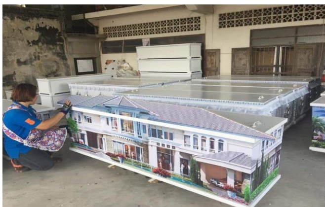
ภาพที่ 3 โรงศพที่กำลังได้รับความนิยมของคนในชุมชน ที่มา: ถ่ายโดยผู้วิจัย 28 กุมภาพันธ์ 2561

การให้บริการเกี่ยวกับงานศพ ทางเจ้าภาพจะมาติดต่อกับทางร้านเองทั้งหมด โรงศพมีแบบธรรมดา ใส่ลูกในมีแอร์คอนดิชั่น มีแบบลายบ้าน ลายผ้า ลายสติ๊กเกอร์ แต่ละแบบอยู่ที่ราคาประมาณ 5,000 - 13,000 บาท แล้วแต่แบบลาย ลายผ้าจะแพงที่สุด เพราะจะต้องจัดกลับมาทำผ้าใหม่ แล้วแต่ลูกค้าจะมาสั่งแต่ละแบบ นอกจากโรงศพแล้วทางร้านมีบริการทุกอย่างเกี่ยวกับงานเกือบทุกชนิด งานแต่ง ชั้นหมาก ครบวงจร มีวิวัฒนาการที่เปลี่ยนแปลงเนื่องจากไม่มีแอร์แต่จะเป็น การฉีดศพแทน ต่อมาก็เริ่มใช้โลงแอร์จนถึงปัจจุบัน ไม่มีการสั่งทำล่วงหน้า แต่ทางร้านจะมีโลงสำรองไว้เผื่อมีคนมาเอาไม่มีการติดต่อกับคนเผาผีแต่อย่างใด ทางเจ้าภาพจะมาติดต่อกับทางร้านเท่านั้น