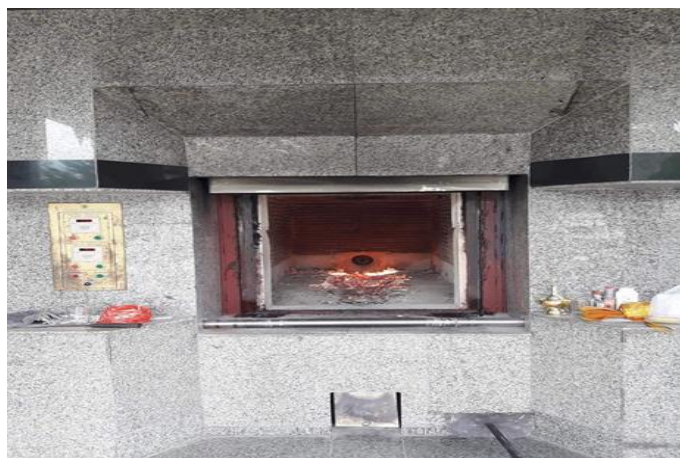
ภาพที่ 2 การเผาศพแบบเตาไฟฟ้า ที่มา: ถ่ายโดยผู้วิจัย 5 มีนาคม 2561

ในส่วนพิธีกรรมต่าง ๆ จากการลงพื้นที่พบว่า แก่นของพิธีจะยังคงปรากฏแต่จะมีการรวบรัดเรื่องเวลาเร็วขึ้น การดำเนินการต่าง ๆ ทำในรูปแบบจ้างเหมาเป็นส่วนใหญ่ ส่วนการจัดการศพยังคงมีความเชื่อ ก่อนที่จะนำศพใส่ในโลงศพได้นั้นจะต้องมีการทำพิธีแรก คือ การอาบน้ำศพ หรือที่เรียกกันว่า “พิธีรดน้ำศพ” โดยใช้น้ำมนต์ผสมน้ำสะอาด โรยด้วยดอกไม้หอมหรืออาจจะใช้น้ำอบผสมด้วย และขันเล็กสำหรับตักน้ำยื่นให้แขกผู้มาร่วมงานและมีขันขนานใหญ่ที่มีพานรองรับน้ำที่รดมือศพ เจ้าภาพและลูกหลานจะทำการรดน้ำศพก่อน หลังจากนั้นก็จะเป่าแขก คนสนิท บุคคลที่นับถือ เพื่อแสดงความเคารพ ความอาลัย ต่อผู้ที่จากไป พิธีการจัดศพลงหีบ เมื่อเสร็จพิธีรดน้ำศพแล้ว ในการนำศพลงโลงนั้น นิยมมอบให้เจ้าหน้าที่ของวัดเป็นผู้ทำพิธีกรรมต่าง ๆ ตามประเพณี ความเชื่อ การจัดงานบำเพ็ญกุศลคือการสวดอภิธรรม นิยมเริ่มสวดตั้งแต่วันตั้งศพเป็นต้นไปทุกคืน โดยนิยมสวด 1 คืน 3 คืน 5 คืน 7 คืน ในบางรายหลังจากทำบุญ 7 วันแล้วอาจจะสวดพระอภิธรรม สัปดาห์ละ 1 วัน จนครบ 100 วัน หรือจนถึงวันฌาปนกิจศพ จะนิมนต์พระสวดอภิธรรม 4 รูป และสวด 4 จบ พระสงฆ์ จะลงสวดเวลาตามแต่ละท้องถิ่น ปกติจะนิยมเริ่มตั้งแต่วันที่ 19.00 นาฬิกา