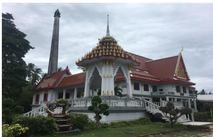
ภาพที่ 8 เมรุเผาศพวัดขรัวช่วย 13 กันยายน 2561

(เชียว, สัมภาษณ์เมื่อวันที่ 13 กันยายน 2561)