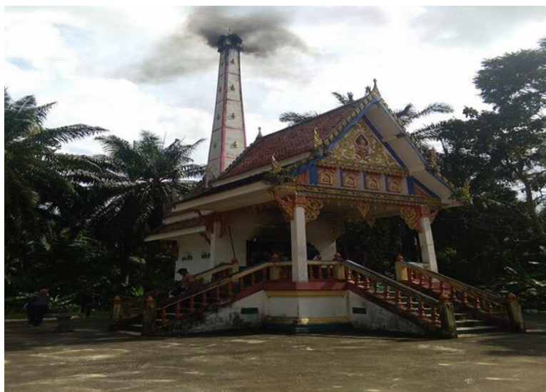
ภาพประกอบ 2 เมรุเผาศพ (ฉาปนสถาน) ชุมชนเมืองนครศรีธรรมราช

“...การสร้างเมรุในอดีตนั้นจะเป็นการสร้างที่มีรูปแบบคล้าย ๆ กัน และเมรุประกอบด้วย 2 ส่วนด้วยกัน ส่วนแรกของเมรุจะเป็นยอดแหลม เป็นที่ตั้งศพก่อนเผา ซึ่งในส่วนนี้จะประกอบด้วยบันไดขึ้นลงสามทาง และส่วนที่สองจะเป็นท่อนสูงก่อด้วยอิฐทนไฟและเมื่อเวลาเผาศพควันจะลอยขึ้นสู่ปลายท่อนแล้วจะหายไปในอากาศ...” (Interview Wongmaksakul 10 September 2017)