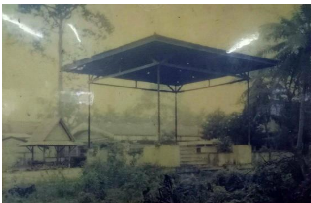
ภาพที่ 13 สามส้างของวัดชะเมา

(สุดา ตรุณวรรณ, สัมภาษณ์เมื่อ 20 พฤศจิกายน 2561)