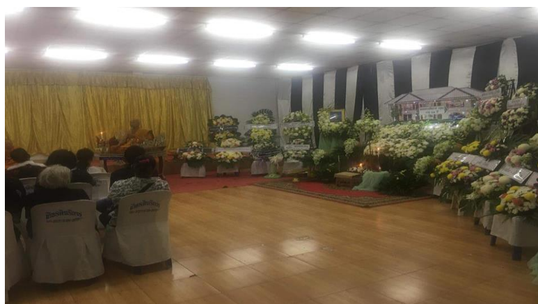
ภาพที่ 14 บรรยากาศจัดงานศพในชุมชนเมืองปัจจุบัน

(พระปลัดเกษม, สัมภาษณ์เมื่อวันที่ 18 ตุลาคม 2561)