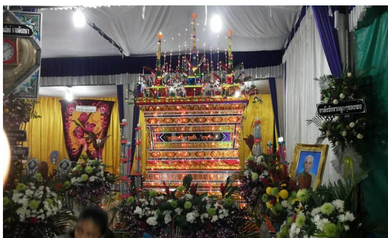
ภาพที่ 5 การตกแต่งหน้าศพ/โลงศพในชุมชนตอนกลาง ที่มา: ถ่ายโดยผู้วิจัย 28 มิถุนายน 2561

สุดท้าย หากผู้ตายมีภรรยาหรือสามีที่ยังมีชีวิตอยู่คนเผ่าผีจะทำพิธีหยาร้างให้พิธีนี้ มีความหมายว่า ทั้งสองได้อยู่กันคนละภพชาติแล้ว เสร็จแล้วจะให้ผู้มาร่วมงานขึ้นวางดอกไม้จันทน์หลังจากหลังคนเผ่า ผีจะขอขมาศพ และทำการเผา ขั้นตอนนี้คนเผ่าผีจะแจ้งว่าหากมีควันออกจากเมรุเมื่อไรให้เจ้าภาพทำการโปรยทาน โปรยทานเป็นเหรียญห่อด้วยริบบิ้นที่เจ้าภาพจัดเตรียมขึ้นมาเพื่อโปรยให้ผู้มาร่วมงาน ลักษณะการเผา จะใช้น้ำมันก๊าดราดลงไปในโลงจุดไม้ขีดไฟลงไป การเผาแบบนี้เชื่อว่าเผาจะถูกเผาจนหมดเป็นเถ้าถ่านและเป็นการประหยัดกว่าใช้ถ่าน ส่วนคนเผ่าผีจะมีประจำตัวอยู่แล้ว