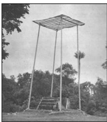
ภาพที่ 1 สามส้าง คือ ฌาปนสถาน (ชั่วคราว) ของพื้นบ้านถิ่นใต้

สามส้าง สำหรับในภาคใต้จะเรียกเชิงตะกอนที่ใช้เผาศพว่า “สามส้าง” หรือ “ร่มไฟ” คือ ฌาปนสถานชั่วคราวที่สร้างขึ้นสำหรับเผาศพเฉพาะราย อาจสร้างขึ้นในวัด ในป่าช้า หรือบางท้องถิ่นสร้างขึ้นในบริเวณบ้านก็มี เป็นคตินิยมที่มีมาก่อนที่จะมีเชิงตะกอน เมื่อมีประเพณีเผาศพที่เชิงตะกอนเกิดขึ้นแล้วมีบ้างที่ไม่ปรารถนาจะใช้เชิงตะกอนเป็นที่เผาศพของผู้ที่ตนเคารพนับถือ ยังคงนิยมทำสามส้างหรือร่มไฟ เป็นที่ทำการฌาปนกิจด้วยถือคติว่า ผู้ตายแต่ละคนย่อมต่างกรรมต่างวิบากกัน จึงไม่ควรเผาศพซ้ำรอยให้แปดเปื้อนกัน