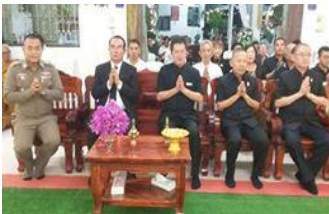
ภาพที่ 16 คณะเจ้าภาพงานศพ (ผู้มีชื่อเสียง) สะท้อนค่านิยมการจัดการศพ ที่มา: ถ่ายโดยผู้วิจัย 12 พฤศจิกายน 2561

ในการจัดการศพยุคดังกล่าวนี้ พบว่ามีบุคคลหลายกลุ่มที่เกี่ยวข้อง ประกอบด้วยกลุ่มพระสงฆ์ ในการประกอบสร้างประเพณีงานศพ งานสวดอภิธรรมหรืองานสวดศพ เพื่อเป็นการแสดงให้เห็นสัจธรรมของชีวิตว่า โดย ปรมาตถธรรมแท้จริงแล้ว ชีวิตประกอบด้วยธรรมชาติ 2 ส่วน คือ ส่วนที่เป็นรูป คือ ร่างกาย อันประกอบด้วยธรรมชาติ 4 อย่าง คือ ดิน น้ำ ลม ไฟ ถ้าเห็นสัจธรรมของชีวิตตามธรรมชาติ ด้วยปัญญาญาณ ย่อมบรรลู่ถึงพระนิพพาน การดับกิเลสคือการดับทุกข์ได้