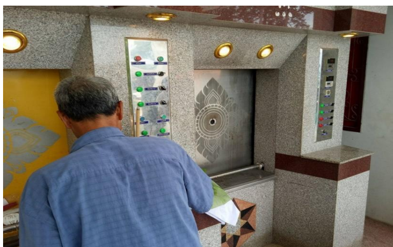
ภาพประกอบ 6 แสดงการเผาศพด้วยเตาเผาศพไฟฟ้า

สามารถขอโหลิกรรมต่อศพในการเผาเพื่อขออนุญาตศพก่อนเผา และสุดท้ายคือ การไม่เรียกร้อยค่าใช้จ่ายใด ๆ ในการเผา แล้วแต่พละกำลังที่เจ้าภาพจะมอบให้ น้ำจะไม่รับเงินกับเจ้าภาพโดยตรงน้ำจะบอกให้เจ้าภาพนำไปให้เจ้าอาวาสก่อน และ น้ำก็จะไปรับที่เจ้าอาวาสโดยแล้วแต่เจ้าอาวาสจะให้น้ำเท่าไรน้ำก็รับทั้งนั้นและนี่คือ สิ่งที่น่าต้องยึดถือปฏิบัติเพราะมันเป็นสิ่งที่ส่งผลดีต่อน้ำและครอบครัว...” (Interview Wongmaksakul 10 September 2017)