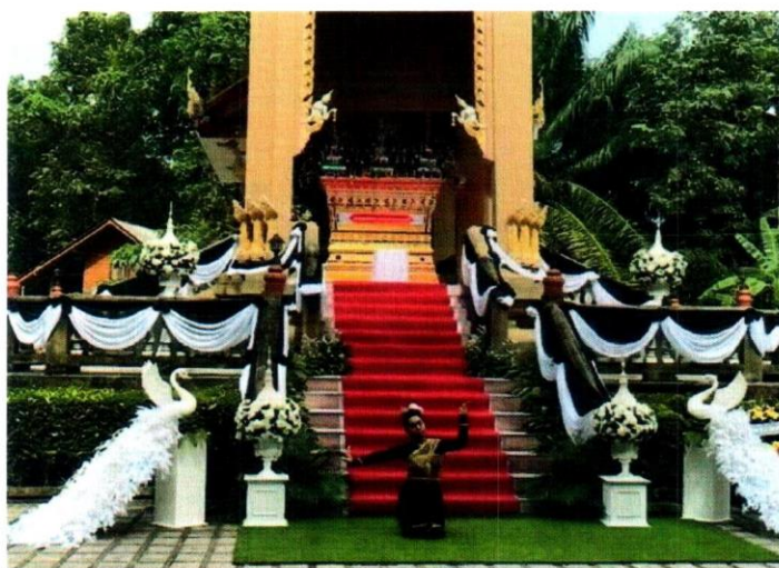
ภาพที่ 2 การตกแต่งบริเวณเมรุเผาศพในวันเผาศพ

สำหรับการเผาศพที่วัดมัชฌิมภูผา (ดอนกลาง) นั้นปัจจุบันเป็นการเผาศพแบบเมรุเป็นเตาเผาศพ 1 เตา ใช้ถ่านเป็นเชื้อเพลิง ในการเผาใช้ถ่าน 2 กระสอบต่อการเผา 1 ศพ จึงทำให้เผาได้ครั้งละ 1 ศพเท่านั้น โดยลักษณะของเตาเผาศพทำมาจากอิฐทนไฟ วิธีการใช้รถเข็นเพื่อเป็นฐานในการวางถ่านและศพ โดยบนรถเข็นจะใส่ถ่านให้เต็มแล้วจึงวางโลงศพไว้ด้านบนในการเผาแต่ละศพใช้เวลาประมาณ 4 – 5 ชั่วโมงเพราะความแข็งของแอร์จับตัวไว้นานเกินคนอ้วนจะเผาได้เร็วกว่าคนผอมเพราะคนอ้วนมีไขมันเยอะ สำหรับค่าใช้จ่ายจะอยู่ที่ศพละ 3,000 บาท ให้กับสัปเหร่อศพละ 1,000 บาท