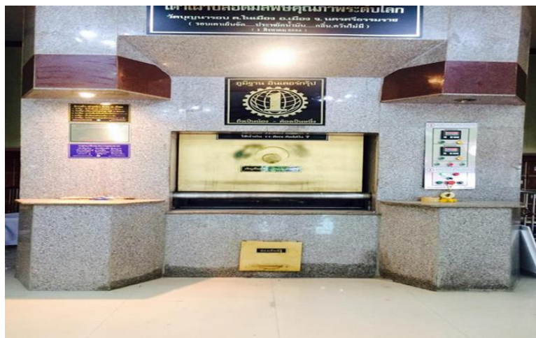
ภาพประกอบ 4 เตาศพแบบเมรุไฟฟ้าในชุมชนเมืองนครศรีธรรมราช

คนในชุมชนมีสุขภาพและสิ่งแวดล้อมที่น่าอยู่มากขึ้น การเผาที่ใช้น้ำมันโดยมีการใช้ไฟฟ้าควบคุม ก่อนจะเผาต้องมีการอุ่นอุณหภูมิก่อนประมาณ 45 นาที เพื่อไม่ให้เกิดการเผาไหม้กลับ ในการเผาแต่ละครั้ง คนผอมใช้น้ำมัน 30 - 40 ลิตร คนอ้วน 25 - 30 ลิตร คนอ้วนใช้น้อยกว่าเนื่องจากไขมันมีมาก เผาได้ง่ายกว่าและเร็วกว่าคนผอม เวลาในการเผา 2 - 2.30 ชั่วโมง สำหรับค่าใช้จ่ายเจ้าภาพจะต้องจ่ายให้กับทางวัดศพละ 3,500 - 5,000 บาท คนเผาได้ศพละ 1,000 - 1,500 บาท