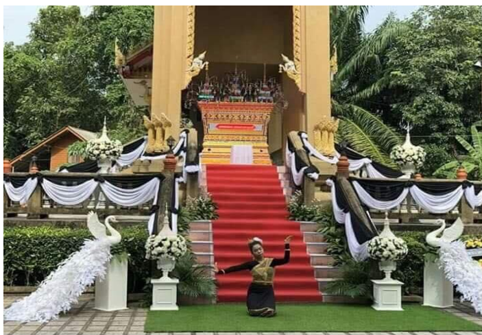
ภาพที่ 7 การตกแต่งบริเวณเมรุเผาศพในวันเผาศพ ที่มา: ถ่ายโดยผู้วิจัย 29 มิถุนายน 2561

จากนั้นก็ได้ทำการติดต่อคนที่ให้บริการร้านโรงศพ ให้เช่าเต็นท์ เก้าอี้ คนทำอาหาร รวมถึงให้บรรดาลูก ๆ ติดต่อร้านทำป้ายไวเนล ป้ายบอกทาง ป้ายชื่อผู้ตาย ออกแบบงานศพ สถานที่ตั้งงานศพ ติดต่อร้านดอกไม้เพื่อประดับหน้าโรงศพ ให้คนไปชนของที่วัด อาสนะพระสงฆ์ โต๊ะหมู่ ตาลปัด ที่กรวดน้ำ เป็นต้น สำหรับมัคทายกวัดและการจัดการศพต่าง ๆ ไม่เป็นที่เป็นห่วง เพราะเนื่องผู้ใหญ่แดง ท่านทำเป็นหมดทุกอย่าง ตั้งแต่มัดตราสังข์ ตั้งแต่การเอาศพเข้าโลง ตั้งโต๊ะพระ นำไหว้พระ รวมถึงเผาศพท่านจะอนุเคราะห์เต็มใจช่วยชาวบ้านในชุมชนนี้เป็นอย่างดี ตั้งคำสัมภาษณ์