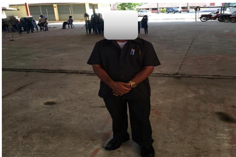
ภาพประกอบ 5 คนเผาผียุคเตาเผาไฟฟ้า

“...การเผาศพของน้ำนั้นไม่ได้ยึดติดกับค่าตอบแทนเสมอไป ช่วยเหลือกันและกัน จะทำให้ประสบความสำเร็จในชีวิต ส่วนการแต่งกายของน้ำเมื่อมีการเผาศพน้ำจะแต่งกายด้วยการใส่สูทเพราะการที่เราแต่งกายเรียบร้อยสุภาพเป็นการให้เกียรติทั้งผู้ตายและผู้เข้าร่วมในพิธีกรรม และอีกอย่างหนึ่งเป็นการแสดงให้เห็นว่าแม้จะเป็นเพียงคนเผาผีก็สามารถแต่งกายให้ดูดีเหมือนอาชีพอื่นได้...” (Interview Parksupoe 4 November 2017)