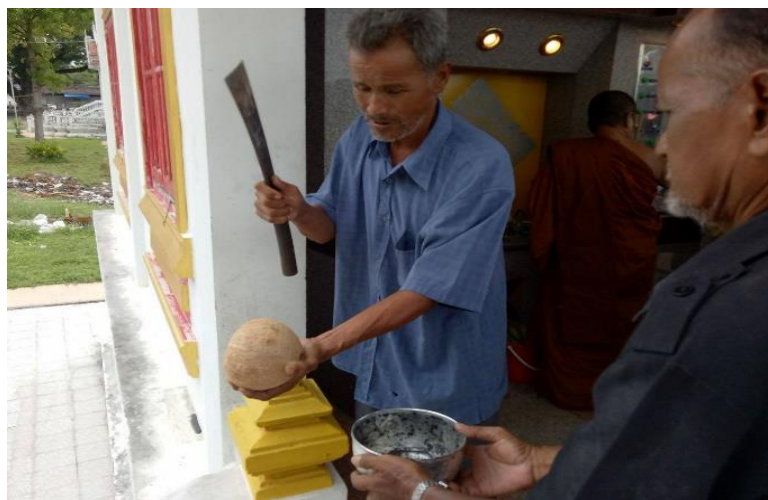
ภาพประกอบ 3 การทำงานของคนเผาผียุคเมรุ

เนื่องจากอาจจะเกิดเผาไหม้ไม่ทั่วถึงได้ ต้องคอยพลิกศพให้โดนไฟให้ทั่วทั้งตัว คนเผาผีบางคนเป็นคนแก่ ไม่ดูศพให้ดีเกิดไฟดับก่อนที่จะเผาศพหมดหรือไม่ก็ได้พลิกให้ศพโดนไฟให้ทั่ว ถึงเวลาเปิดเตาเผา ออกมาจะเก็บกระดูกเห็นว่าบางศพก็ยังมีแขนบ้างขาบ้างที่ยังคงเหลืออยู่ บางรายเอาเนื้อที่ยังไม่โดนไฟ ไปทิ้งลงในคลอง หรือฝังไว้ บางศพที่มีการแช่แข็งมาต้องใช้เวลากการเผาไฟในการเผาเกินกว่า 3 ชั่วโมง แล้วก็ต้องคอยมาเติมถ่านอยู่ตลอดพร้อมกับพลิกศพให้ศพนั้นได้ถูกไฟอย่างทั่วถึง