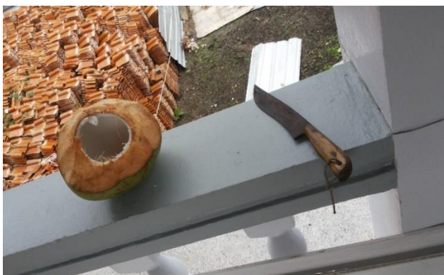
ภาพที่ 12 มีดหมอประจํากายคนเผาผี/มะพร้าวอ่อนล้างหน้า และ อาบศพ 19 กันยายน 2561

ลุงเชียว เล่าว่า ทุกวันนี้ลุงรับหน้าที่เผาศพทุกศพ ไม่ว่าจะเป็นศพคนจน ศพคนรวย ศพพระ ศพข้าราชการ งานพระราชทานเพลิงศพ เผาตามปกติ เพียงแต่ว่าต้องแต่งตัวให้เหมาะสมกับแต่ละงานเท่านั้น ใส่เสื้อผ้าชุดใหม่ ๆ และมีชุดประจำตัว ผ้าซาฟารี สีเทา เวลางานใหญ่ทุกศพจะให้ค่าเผา มีบ้างที่ทำการเผาศพฟรีไม่คิดเงินค่าเผา ส่วนมากจะเป็นศพญาติกัน นอกนั้นไม่ว่าจะเป็นศพ มีหรือไม่มี จนรวย ญาติ ๆ เขาจะให้ทุกการเผา อย่างงานล่าสุตงานพระราชทานเพลิงของแม่ของข้าราชการชั้นผู้ใหญ่ในชุมชน วันที่มีการลอยอังคารแล้ว นอกจากจะเผาให้แล้ว ยังได้พาตนเองไปลอยอังคารถึงท่าเรือปากน้ำดอนสัก จังหวัดสุราษฎร์ธานี เนื่องจากเจ้าภาพบอกกับตนว่าลุงเป็นคนจัดการทั้งหมดดี จึงพาไปด้วย เผาตามปกติเหมือนเดิมทุกอย่าง เจ้าภาพจะรู้กันว่าปัจจุบันมีค่าเผาศพละ 1,000 บาท ทั้งนี้ตนเองก็ได้แบ่งปันกับพระตุ้มตาม ที่มาช่วยแบ่งเผาภาระงานของตนคนละ 500 บาท ทำมาอย่างนี้ 5 ปีแล้ว เพราะท่านเองเข้ามาช่วยตนตั้งแต่ตอนเป็นสามเณร ดังคำกล่าว