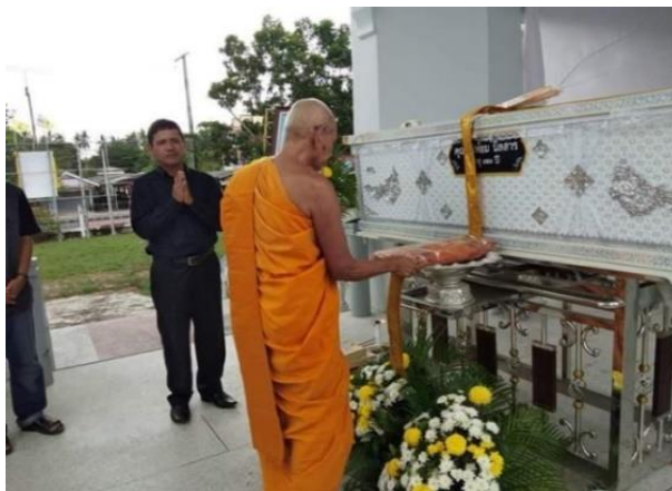
ภาพที่ 10 ประธานฝ่ายฆราวาสทอดผ้าบังสุกุล/ประธานฝ่ายสงฆ์พิจารณาผ้าบังสุกุล 19 กันยายน 2561

การเผาศพนั้นปัจจุบันจะมีการเผาจริง เผาหลอก ซึ่งพิธีการ "เผาหลอก" ก่อน แล้วจึง "เผาจริง" กล่าวคือให้แขกที่มาร่วมงานทั้งหลาย ไปวางธูปเทียน ดอกไม้จันทน์ที่หน้าหรือใต้โลงศพ เพื่อแสดงความเคารพศพ ซึ่งเสมือนเป็นการทำพิธีเผาศพโดยสมมติ ยังไม่ใช่พิธีการเผาศพจริง เมื่อแขกผู้ร่วมพิธีได้ทำความเคารพศพโดยสมมติหมดแล้ว จึงนิยมนิให้วงศาคณาญาติมิตรสหายสนิท ผู้ใกล้ชิดกับผู้ตายขึ้นไปทำการเผาศพจริงอีกครั้งหนึ่ง จึงเสร็จพิธีเผาศพบริบูรณ์ หลังจากนั้นก็จะทำการเก็บอัฐิหรือเรียกว่าการดับธาตุตอนรุ่งสางของอีกวันหลังมีการเผาศพ เพื่อทำบุญกระตุก โดยการนัดหมายระหว่างคนเผาผีกับเจ้าภาพ ลูกหลาน นำข้าวของอุปกรณ์ และเครื่องถวายสังฆทาน ต่าง ๆ นำมาตอน 5.00 น. โดยมีความเชื่อว่าไม่ให้คนบินผ่านควรจะมีการมาทำพิธีเสียก่อน โดยคนเผาผีจะนิมนต์พระมารับบิณฑบาตรทำพิธีมาตีกาบังกุล หลังจากนั้นญาติจะช่วยกันฝังกลบ เถ้าถ่านหรือนำเถ้าถ่านไปลอยลงสู่ทะเลในที่ไมห่างจากวัดมากนักเป็นอันเสร็จสิ้นพิธีการจัดการศพ ในช่วงนี้ของชาวมุขชนชรัช่วย หลังจากนั้นขึ้นอยู่กับเจ้าภาพว่าจะมีการทำบุญ 7 วัน 50 วัน 100 วัน หรือ รอบปี แต่ในแต่ละปีนั้นในวันเดือนสิบของชาวภาคใต้ ทางวัดชรัช่วยก็จะมีการทำบุญเรียกว่า ทำบุญตายายก็จะมีพิธีนารูป กระตุกที่บรรจุนิโกศ มาทำพิธีทำบุญสวดมาตีกา บำเพ็ญอุทิศส่วนกุศล ไปให้เป็นประจำทุกปี ดังคำกล่าว