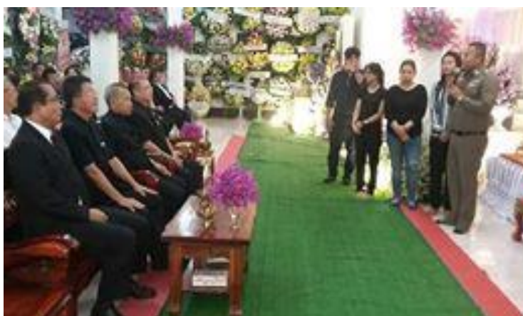
ภาพที่ 17 พวงหรีดของบุคคลสำคัญ ที่มา: ถ่ายโดยผู้วิจัย 5 พฤศจิกายน 2561

(กบินทร์ สารรัตน์, สัมภาษณ์เมื่อวันที่ 5 พฤศจิกายน 2561)