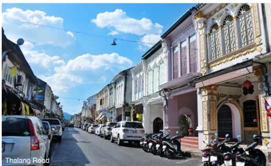
ภาพที่ 4 บรรยากาศในถนนกลาง จังหวัดภูเก็ต