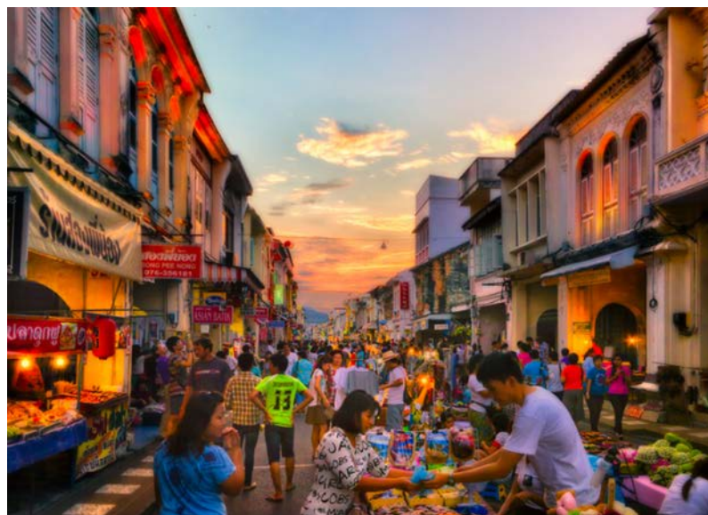
ภาพที่ 5 ถนนคนเดินตลาดใหญ่ จังหวัดภูเก็ต