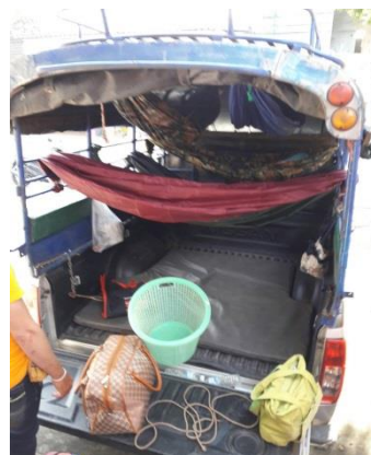
ภาพที่ 2 พาหนะของผู้ให้ข้อมูล

17 กุมภาพันธ์ 2558