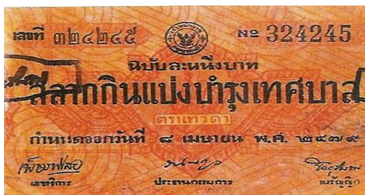
ภาพที่ 3 ภาพแสดง สลากกินแบ่งบำรุงเทศบาลสลาγκินแบ่งรัฐบาล (ลอตเตอรี่)

ในปี 2477 กระทรวงมหาดไทยได้มีความประสงค์จะหาเงินบำรุงเทศบาล โดยใช้วิธีออกลอตเตอรี่เช่นเดียวกับกรมสรรพากรดำเนินการอยู่ แต่พยายามไม่ให้แข่งขันกัน โดยเดือนไหนเป็นเดือนที่ออกลอตเตอรี่ของกรมสรรพากร เดือนนั้นจะงดจำหน่ายลอตเตอรี่ของเทศบาล ซึ่งลอตเตอรี่ของเทศบาลแบ่งออกเป็น ลอตเตอรี่เทศบาลทั่วไป จำหน่ายทั่วไปเพื่อได้เงินมาบำรุงเทศบาลทั่วไป ก่อสร้างสาธารณวัตถุต่าง ๆ เช่น โรงพยาบาล โรงเรียน สนามกีฬา เป็นต้น ลอตเตอรี่เทศบาลจังหวัดเพื่อได้เงินมาบำรุงจังหวัด การจำหน่ายจะได้น้อยสามารถรวมกับจังหวัดอื่นได้ โดยกำหนดให้เทศบาลจังหวัดพระนครและธนบุรีออกเป็นตัวอย่างก่อนโดยให้ออกรวมกัน (ผึ่งหลวง, 2542)