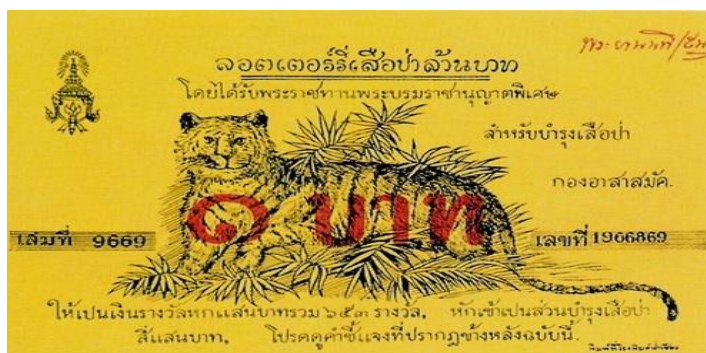
ภาพที่ 2 ภาพแสดง ลอตเตอรี่เสือป่าเทศบาลสลาγκินแบ่งรัฐบาล (ลอตเตอรี่)