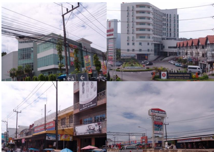
ภาพที่ 8 บริเวณที่ขายลอตเตอรี่ ถ่ายเมื่อวันที่ 26 พฤศจิกายน 2559