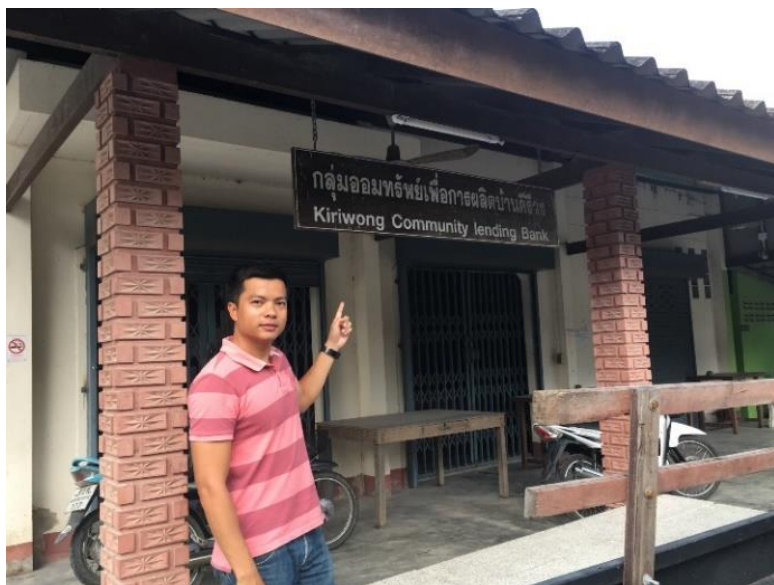
ภาพที่ 10 กลุ่มออมทรัพย์เพื่อการผลิตบ้านคีรีวง ที่มา : ถ่ายโดยผู้วิจัย เมื่อวันที่ 25 มีนาคม 2561

ครั้งที่สาม ปี พ.ศ. 2531 ซึ่งนับเป็นภัยธรรมชาติครั้งที่ร้ายแรงที่สุด ชุมชนคีรีวงประสบเหตุน้ำป่าไหลหลาก น้ำป่าทะลักพร้อมดินโคลน ทลาย บ้านเรือน ตลอดจนโรงเรียน ตลาดสด โบสถ์และศาลาเสียหายอย่างหนัก จากที่เคยเป็นชุมชนที่พึ่งตัวเองได้จากการมีทรัพยากรธรรมชาติ มีผลหมากรากไม้ที่สมบูรณ์ ผู้คนสามารถใช้ทรัพยากรนั้นในการดำรงชีวิต ประกอบอาชีพ ทำสวน ปลูกผลไม้หลากหลายอย่างในการดำเนินชีวิต ชุมชนกลับถูกน้ำพัดหายไปนับ 100 หลัง ทำให้ชาวบ้านมีความยากลำบากในการดำรงชีวิต ในช่วงเวลาหลังประสบภัยพิบัติทางธรรมชาติจากมหาอุทกภัยนี้ ภัยเกิดขึ้นในครั้งนี้อยู่เพียงจังหวัดแค่แห่งเดียว ซึ่งชาวชุมชนคีรีวงได้รับพระอุปถัมภ์และบ้านที่ประสบภัยในครั้งนั้นไว้เป็นอนุสรณ์สถานจวบจนถึงปัจจุบัน จากประสบการณ์อันเลวร้ายในครั้งนี้นี้ ส่งผลต่อชีวิตความเป็นอยู่ของชาวชุมชนคีรีวงเป็นอย่างมาก ทางราชการได้แนะนำให้อพยพไปตั้งชุมชนใหม่ในที่ที่ปลอดภัย แต่ชาวชุมชนคีรีวงไม่ยอมโยกย้ายไปจากถิ่นเดิมของบรรพบุรุษ เพราะชีวิตผูกพันจนละทิ้งถิ่นฐานไม่ได้ ซึ่งจากเหตุการณ์ในครั้งนี้อย่างนี้ ชาวชุมชนคีรีวงได้รับพระมหากรุณาธิคุณจากพระบาทสมเด็จพระเจ้าอยู่หัวได้ทรงพระราชทานเงินมากกว่า 100 ล้านบาท เพื่อนำมาแก้ไขปัญหาในการป้องกันภัยพิบัติทางน้ำในระยะยาว (ยังยุทธ กระจ่างโลก, 2552) และทำให้ชาวบ้านหันมาปรึกษาหารือกันว่าถ้าต้องการอาศัยอยู่ที่เดิม ต้องแสวงหาแนวทางการอนุรักษ์ทรัพยากรธรรมชาติ โดยเฉพาะอย่างยิ่งทรัพยากรป่าไม้ ชาวบ้านจึงพากันหาอาชีพเสริมโดยการจัดตั้งกลุ่มอาชีพต่าง ๆ เพื่อลดการใช้ทรัพยากรธรรมชาติ และใช้อย่างมีประสิทธิภาพและอย่างยั่งยืน ซึ่งมีบางส่วนของคำบอกเล่าถึงเหตุการณ์ครั้งนั้นของผู้ให้สัมภาษณ์ ต่อไปนี้