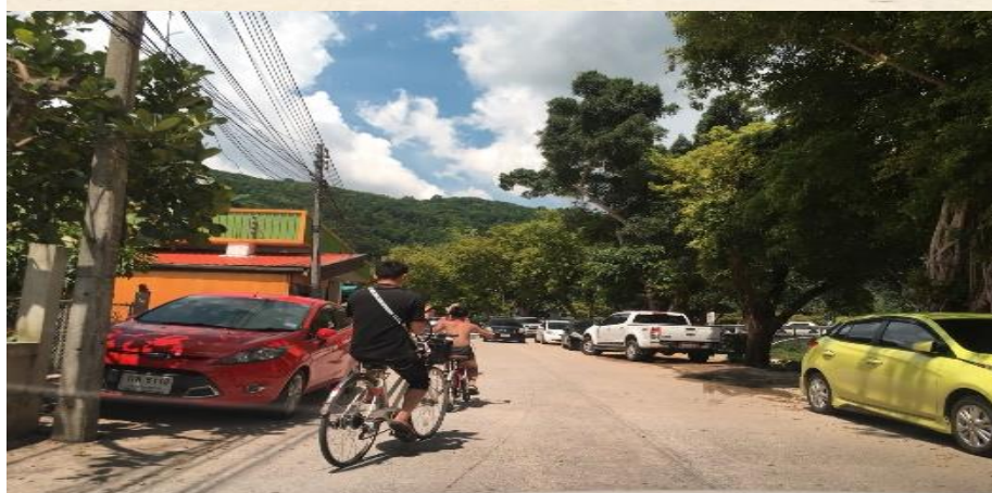
ภาพที่ 41 นักท่องเที่ยวปั่นจักรยานซึ่งมีให้เช่า ที่มา : ถ่ายโดยเพื่อนผู้วิจัย เมื่อวันที่ 13 พฤษภาคม 2561