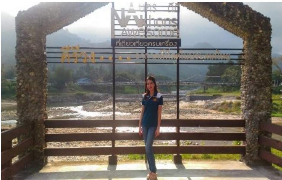
ภาพที่ 18 จุดชมวิวกุ่มชนคีรีวง เมื่อวันที่ 5 กุมภาพันธ์ 2561