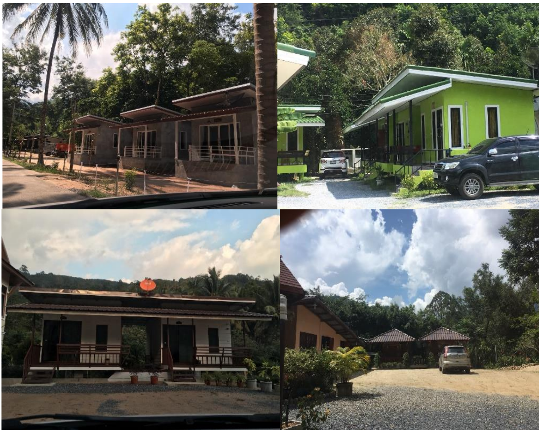
ภาพที่ 45 ที่พักในคีรีวง