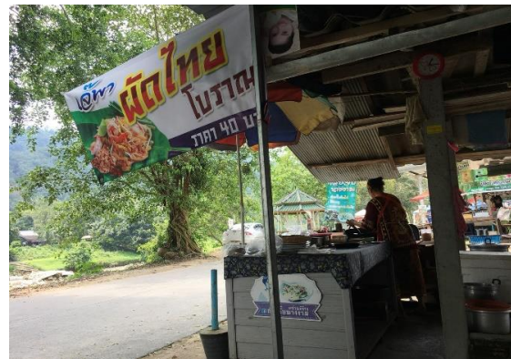
ภาพที่ 44 ร้านผัดไทยเจ้พา เมื่อวันที่ 13 พฤษภาคม 2561

สิ่งเหล่านี้เป็นการสะท้อนให้เห็นว่า ชุมชนคีรีวงมีแหล่งท่องเที่ยวที่สามารถตอบสนองความต้องการของนักท่องเที่ยวในแบบต่างๆ โดยนักท่องเที่ยวสามารถเลือกได้ตามความพอใจของนักท่องเที่ยวเอง สิ่งต่าง ๆ ที่กล่าวมานี้ ล้วนแล้วแต่ถูกประกอบสร้างจากทุนการเงินของชาวชุมชนคีรีวง ที่เชื่อมโยงกับการเป็นแหล่งท่องเที่ยวที่เกิดจากทุนทรัพยากรธรรมชาติ ทำให้ชุมชนคีรีวงเป็นสถานที่ท่องเที่ยวที่น่าสนใจสำหรับผู้มาเยือน