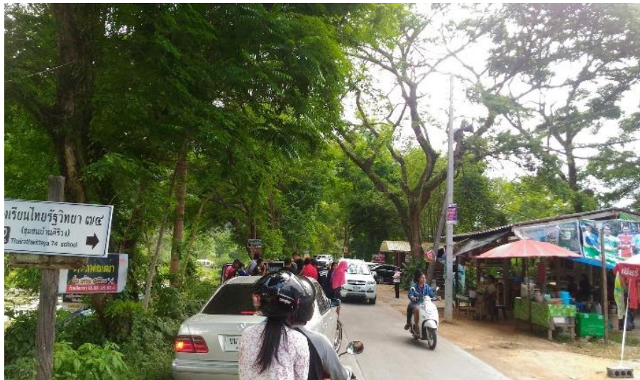
ภาพที่ 40 บรรยากาศนักท่องเที่ยวที่เดินทางเข้ามาท่องเที่ยว