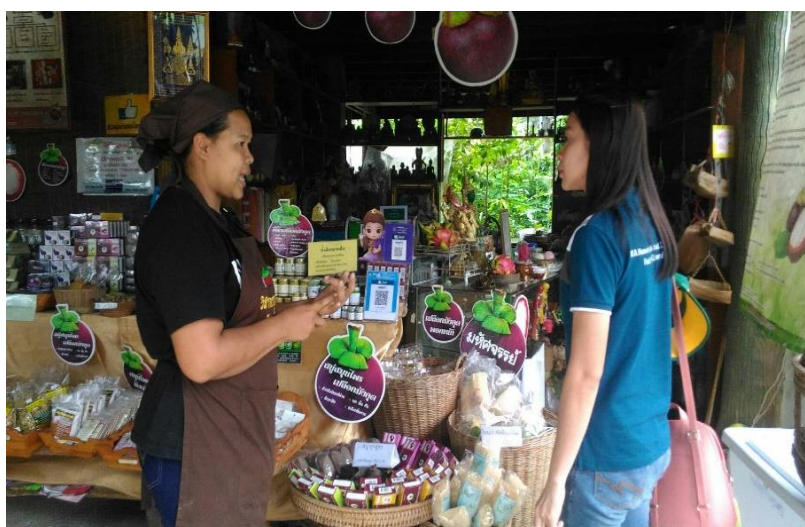
ภาพที่ 25 ผู้ให้ข้อมูลการทำสบู่เปลือกมังคุด เมื่อวันที่ 5 กุมภาพันธ์ 2561

“...แวะมาหาซื้อสบู่มังคุดค้ะ มีโอกาสเลยมาเที่ยวชมบรรยากาศในศรีวังล็กหน่อยพอดีเพื่อนฝากซื้อสบู่มังคุด เพื่อนบอกว่าใช้ดี เป็นสินค้าขึ้นชื่อของที่นี่ด้วย เลยจะซื้อไปเป็นของฝากที่บ้านด้วยค้ะ...” (เข้ม, สัมภาษณ์วันที่ 25 มีนาคม 2561)