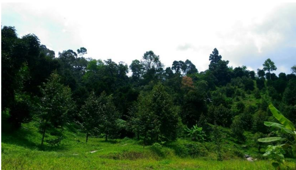
ภาพที่ 5 สวนสมรม

“...พื้นที่บ้านเราอุดมสมบูรณ์ มีผลไม้เยอะแยะ แล้วแต่ฤดูกาล ในสวนมีปลูกหลายอย่างแต่ละอย่างออกผลไม้พร้อมกัน แล้วแต่ฤดูกาล เวลาป่าเข้าสวนก็พาหลานไปด้วย...” (ก้าว, สัมภาษณ์วันที่ 5 กุมภาพันธ์ 2561)