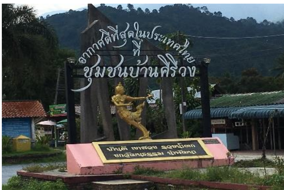
ภาพที่ 13 ป้ายอากาศดีที่สุดในประเทศไทย ที่มา : ถ่ายโดยเพื่อนผู้วิจัย เมื่อวันที่ 5 กุมภาพันธ์ 2561

“...ซื้ออากาศบรรจุกระป๋องไปไว้เป็นที่ระลึก ว่าครั้งหนึ่งเราได้มาถึงที่ศรีวังนี้แล้ว เตี่ยจะซื้อไปฝากเพื่อนที่กรุงเทพฯ ฯ ด้วย อากาศบรรจุกระป๋องนี้มีคุณค่าทางด้านจิตใจ บ่งบอกถึงศรีวัง...” (จุ่ม, สัมภาษณ์วันที่ 13 พฤษภาคม 2561)