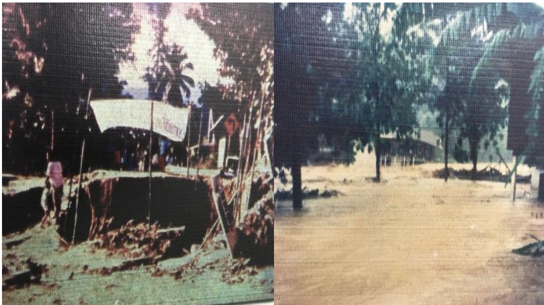
ภาพที่ 9 เหตุการณ์ภัยธรรมชาติ เมื่อปี พ.ศ. 2531