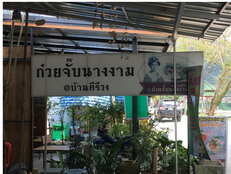
ภาพที่ 43 ร้านก้วยจับนางงาม @ บ้านคีรีวง