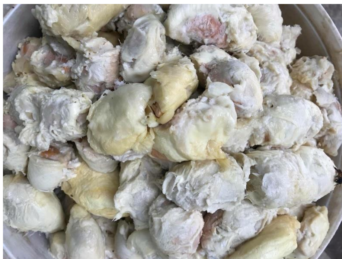
ภาพที่ 28 ทูเรียนที่จะนำมากวน เมื่อวันที่ 5 กุมภาพันธ์ 2561

2) ใช้ไม้พายกวนทูเรียนในกระทะใช้ไฟแรงพอประมาณ กวนจนเนื้อทูเรียนหลุดออกมาจากเมล็ด หรือเนื้อไปรวมอยู่ที่หัวเมล็ดแล้วแกะเนื้อส่วนหัวออก เอาเมล็ดทิ้ง เมล็ดจากทูเรียนนี้รับประทานได้ เด็กๆชอบกินเพราะรสชาติมันหอม การกวนใช้เวลาประมาณ 2-3 ชั่วโมง จนมันของเนื้อทูเรียนออกมา แล้วกวนจนเนื้อทูเรียนแห้งได้ดี ตักใส่ภาชนะไว้ให้คลายร้อน