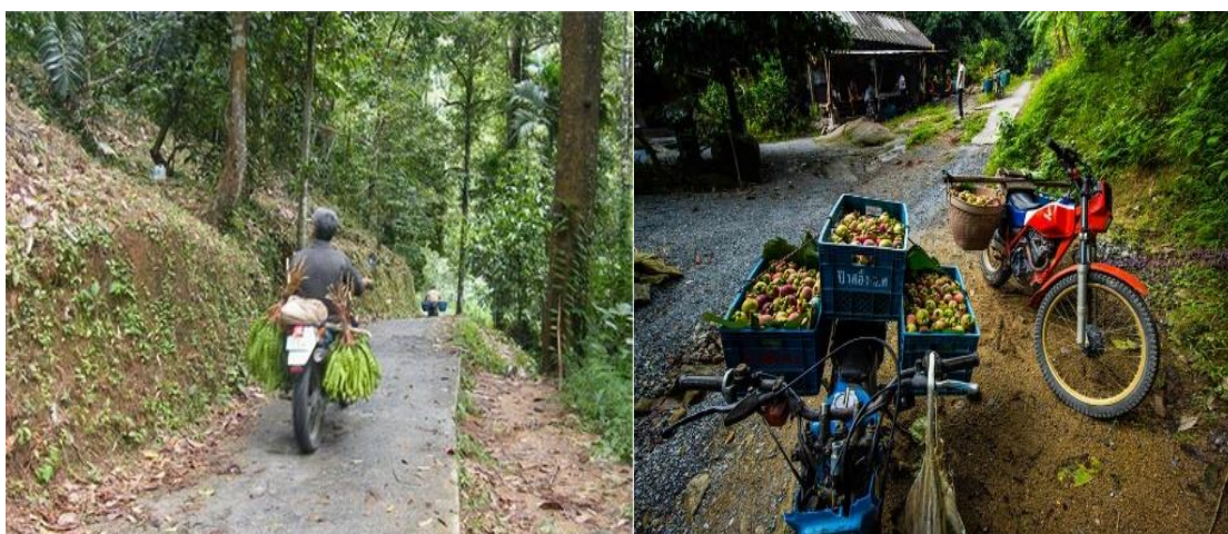
ภาพที่ 3 รถจักรยานยนต์นำผลไม้ขึ้น – ลง เขา ที่มา : ถ่ายโดยผู้วิจัย เมื่อวันที่ 25 มีนาคม 2561

จากเสียงคำบอกเล่าจากผู้ให้สัมภาษณ์ที่หลากหลายเหล่านี้ เป็นการแสดงให้เห็นว่าในช่วงราว ปี พ.ศ. 2505 – 2530 จะเห็นได้ว่า ชาวชุมชนศรีวัง มีวิถีชีวิตแบบเรียบง่าย มีการดำเนินชีวิตแบบพึ่งพาอาศัยกัน เป็นชุมชนที่มีสัมพันธ์กันอย่างใกล้ชิดกับธรรมชาติ เพราะอาศัยพึ่งพิงธรรมชาติในการดำรงชีวิต มีความสัมพันธ์กันอย่างใกล้ชิด ความสัมพันธ์แบบญาติพี่น้อง มีการอยู่ร่วมกันช่วยเหลือและพึ่งพาอาศัยกันและกันตลอดทั้งติดต่อระหว่างกันอย่างใกล้ชิด มีการติดต่อสัมพันธ์กันกับชุมชนอื่น จะเห็นได้จากว่า มีการนำผลหมากรากไม้ ขนส่งทางเรือไปแลกเปลี่ยนกับกะปิ กุ้ง ปลา ของชาวเล หรือชาวปากพนัง ชาวหัวไทร ซึ่งการล่องเรือไปแลกเปลี่ยนของกันนั้น จะนิยมไปกันพร้อมๆกัน เนื่องจากเส้นทางการเดินทางนั้น ต้องผ่านเกาะ แก่งต่างๆ น้ำลึกและเชี่ยวกราด และในช่วงระยะเวลานั้น ชาวบ้านก็ยังมีการรวมกลุ่มกัน แต่เป็นการรวมกลุ่มกันช่วยเหลืองานวัด ไม่ว่าจะเป็นการสร้างอุโบสถ งานบุญทอดผ้าป่า ทอดกฐิน งานบวช งานศพ สิ่งเหล่านี้จึงสื่อให้เห็นถึงความผูกพันสามัคคีกลมเกลียวกันของชาวบ้านศรีวังตั้งแต่ในอดีตจนมาถึงปัจจุบัน