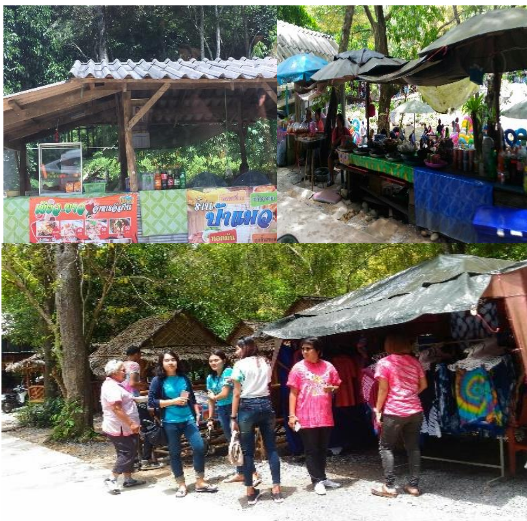
ภาพที่ 11 ร้านขายของขายอาหารของชาวบ้าน ที่มา : ถ่ายโดยผู้วิจัย เมื่อ 13 พฤษภาคม 2561

“...บ้านพี่อยู่เข้าไปในซอยหน่อยนึง ชายพวกเสื้อผ้า ขายได้วันละหลายตัว ขายไปเรื่อยๆ คนสนใจซื้อเยอะ เขาเข้ามาเที่ยวพักผ่อน มองแล้วว่ามันน่าจะขายได้ เดียวนี้นักท่องเที่ยวเข้ามาเยอะเราก็ไม่พลาดที่หารายได้เสริมทำควบคู่กันไป ยิ่งไงๆ บ้านก็อยู่แถวนี้อยู่แล้ว...” (พีจินดา, สัมภาษณ์วันที่ 13 พฤษภาคม 2561)