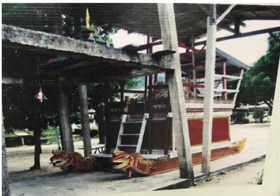
ภาพที่ 6 เรือพระที่ใช้ในประเพณีชักพระ ที่มา : ศูนย์บริการนักท่องเที่ยวบ้านศรีวง

“...ทุกปีที่นี่จะจัดงานพฤตจิการำลึก จะจัดขึ้นทุกปี เพื่อเป็นการรำลึกถึง เหตุการณ์จากภัยธรรมชาติ ที่ทำให้เกิดความเสียหายมากมาย ผู้คนเสียชีวิตหลายราย มีการทำบุญอุทิศส่วนกุศลให้บรรพบุรุษที่ล่วงลับ...” (พี่รงค์, สัมภาษณ์วันที่ 5 กุมภาพันธ์ 2561)