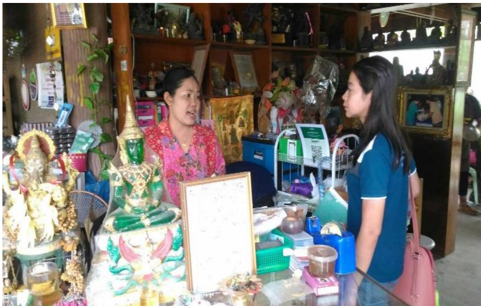
ภาพที่ 24 ผู้วิจัยสัมภาษณ์ผู้ให้ข้อมูลการศึกษาดูงานการทำสบู่มั่งคุด ที่มา : ถ่ายโดยผู้วิจัย เมื่อวันที่ 5 กุมภาพันธ์ 2561

จากเสียงสัมภาษณ์เหล่านี้ล้วนเป็นการยืนยันถึงการถ่ายทอดภูมิปัญญาของท้องถิ่น เป็นส่วนหนึ่งประกอบหนึ่งทำให้ผู้คนสนใจมาเที่ยวชม เข้ามาท่องเที่ยว เลือกชม เลือกซื้อ สินค้าที่เกิดจากวิถีชีวิตและภูมิปัญญา เป็นส่วนหนึ่งที่ส่งเสริมการท่องเที่ยวของชุมชนศรีวัง