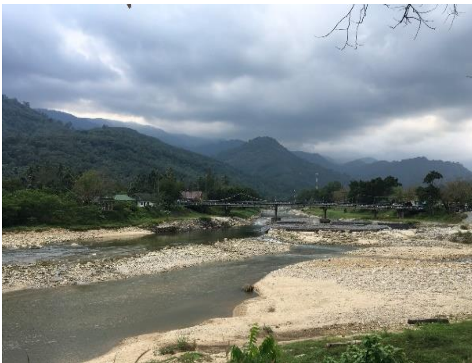
ภาพที่ 16 ทิวทัศน์ที่สวยงามในชุมชนคีรีวง ที่มา : ถ่ายโดยผู้วิจัย เมื่อวันที่ 5 กุมภาพันธ์ 2561

ผ่านกลางชุมชนคีรีวง นับว่าเป็นแหล่งท่องเที่ยวที่เกิดจากทุนทรัพยากรธรรมชาติในชุมชน มีความสวยงาม สร้างความประทับใจ เป็นสิ่งที่ดึงดูดใจของนักท่องเที่ยวให้เข้ามาสู่ชุมชนคีรีวง