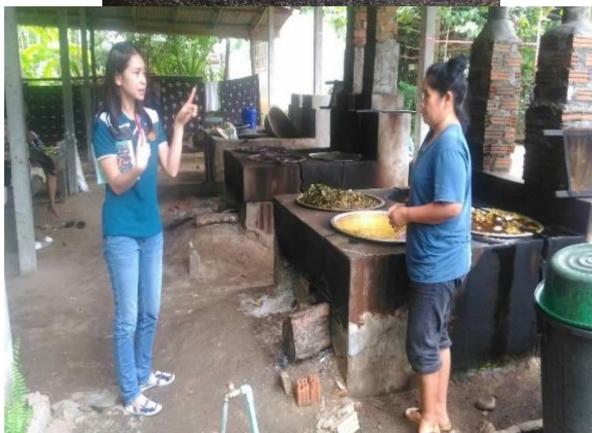
ภาพที่ 35 ศึกษาการทำผ้ามัดย้อม เมื่อวันที่ 5 กุมภาพันธ์ 2561