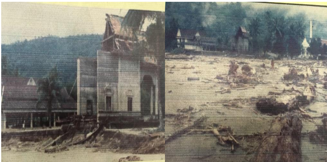
ภาพที่ 7 เหตุการณ์ภัยธรรมชาติเมื่อ ปี พ.ศ. 2531

ครั้งที่สองปี พ.ศ. 2518 เกิดอุทกภัยน้ำป่าไหลทะลักเข้าสู่ชุมชนคีรีวง ดินและหินบนภูเขาถล่มมา ทำให้เกิดความเสียหายอย่างหนัก ทั้งบ้านเรือน ทรัพย์สิน และชีวิตของชาวชุมชนคีรีวง จากอุทกภัยดังกล่าวทำให้ชาวบ้านหลายคน มีหนี้สินและบางคนถึงกับต้องขายที่ดิน ก็เลยมาปรึกษาหารือกัน ในที่สุดก็มีการรวมกลุ่มกันจัดตั้งกลุ่มออมทรัพย์เพื่อช่วยเหลือคนภายในชุมชน ไม่ให้ต้องรับภาระหนี้สินที่เกิดจากดอกเบี้ยเงินกู้ที่สูง ในปี พ.ศ. 2523 จึงเกิดเป็นกลุ่มออมทรัพย์เกิดขึ้น เพื่อช่วยปลดหนี้จากนายทุน และเพื่อไม่ให้ก่อหนี้ใหม่ โดยการช่วยเหลือจากกลุ่มออมทรัพย์ แทน และยังมีการส่งเสริมให้ชาวบ้านออมเงินกับกลุ่มออมทรัพย์ กลายเป็นเงินทุนไหลเวียนของชุมชน ในรูปแบบเงินกู้ และอยู่ในรูปแบบของสวัสดิการต่างๆ ซึ่งกรมพัฒนาชุมชน ได้เข้ามาส่งเสริมให้แนวคิดเกี่ยวกับการจัดตั้งกลุ่มออมทรัพย์เพื่อการผลิต โดยผ่านพัฒนาการจังหวัด พัฒนาการอำเภอ ซึ่งในปี พ.ศ. 2518 ผู้ว่าราชการจังหวัดได้ร่วมกับนายอำเภอลานสกา จัดโครงการให้องค์การบริหารส่วนจังหวัดพัฒนาถนนหนทาง และให้แนวคิดชุมชนพึ่งตนแก่ชุมชนคีรีวง ในปี พ.ศ. 2528 – 2529 ชุมชนคีรีวงได้รับการคัดเลือก ให้เป็นหมู่บ้านอาสาพัฒนาและป้องกันตนเอง (ป.พ.ป.) อันดับ 1 ทั้งการประกวดในระดับจังหวัดและระดับภาค และได้รับรางวัลชมเชยในระดับประเทศ ได้รับเงินรางวัลเพื่อนำมาพัฒนาชุมชน โดยทางชุมชนได้ฝากไว้กับกลุ่มออมทรัพย์การผลิตบ้านคีรีวง และยังได้รับรางวัลหมู่บ้านแผ่นดินธรรมแผ่นดินทอง เนื่องจากพระครูนิเทศธรรมรักษ์ ได้อบรมพัฒนาจิตใจให้ชาวคีรีวง ลด ละเลิก อบายมุข ให้ประพฤติตนในทางที่ดี (ชนาธินาถ ไชยภู, 2556)