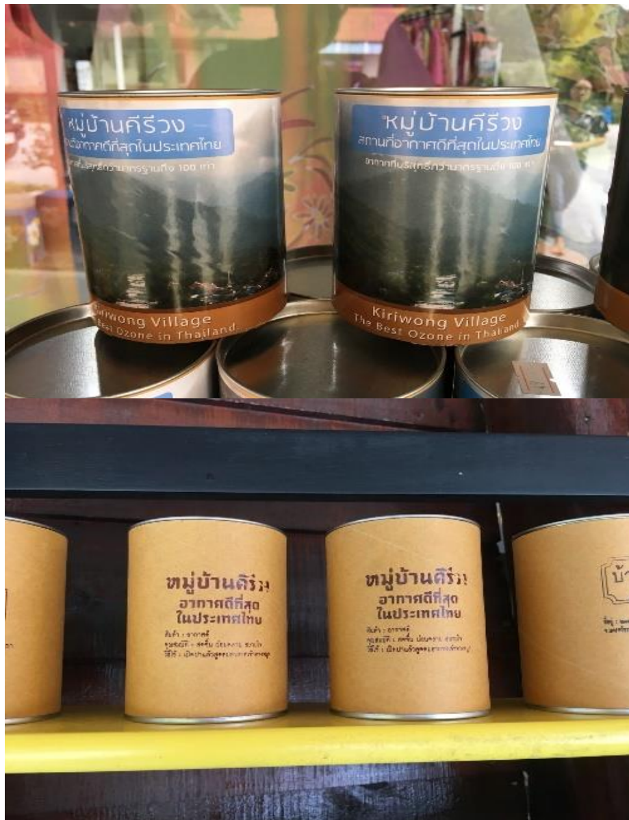
ภาพที่ 14 อากาศบรรจุกระป๋องจำหน่ายเป็นของที่ระลึก

จากคำให้สัมภาษณ์สะท้อนให้เห็นว่าการเป็นพื้นที่ ที่อากาศดีที่สุด คุณภาพของอากาศนั้น เป็นสิ่งดึงดูดใจอย่างหนึ่งที่ยากให้คนเข้ามาสัมผัสอากาศบริสุทธิ์ ซึ่งเป็นผลดีต่อการท่องเที่ยวของชุมชนคีรีวง ผู้คนสนใจอยากเข้ามาเที่ยวให้สัมผัสความสดใส ซึ่งการเป็นพื้นที่ ที่มีอากาศดีที่สุด มีอากาศบริสุทธิ์ เป็นจุดเด่นอย่างหนึ่งที่ทำให้ผู้คนนึกถึง ชุมชนคีรีวง ซึ่งมีไม่กี่แห่งในประเทศไทย และมีการนำมาเพิ่มมูลค่าโดยนำอากาศมาบรรจุกระป๋อง ขายเป็นของที่ระลึกให้กับนักท่องเที่ยวที่มาเที่ยวชมได้เลือกซื้อกลับไปเป็นที่ระลึก นักท่องเที่ยวจำนวนไม่น้อยเมื่อมาถึงชุมชนคีรีวงนิยมถ่ายภาพกับป้ายอากาศดีที่สุดในประเทศ แล้วอัพโหลดบนโซเชียล เพื่อสื่อความหมายไปยังคนอื่นว่า ได้เข้ามาสัมผัสที่อากาศดีที่สุดในประเทศไทย