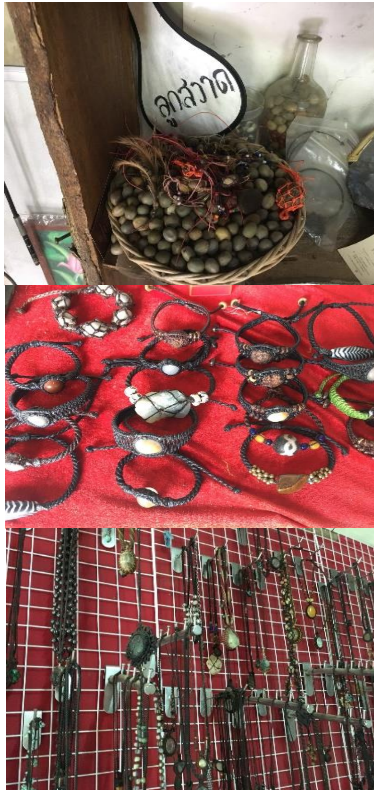
ภาพที่ 37 เครื่องประดับจากลูกสวาด เมื่อวันที่ 13 พฤษภาคม 2561