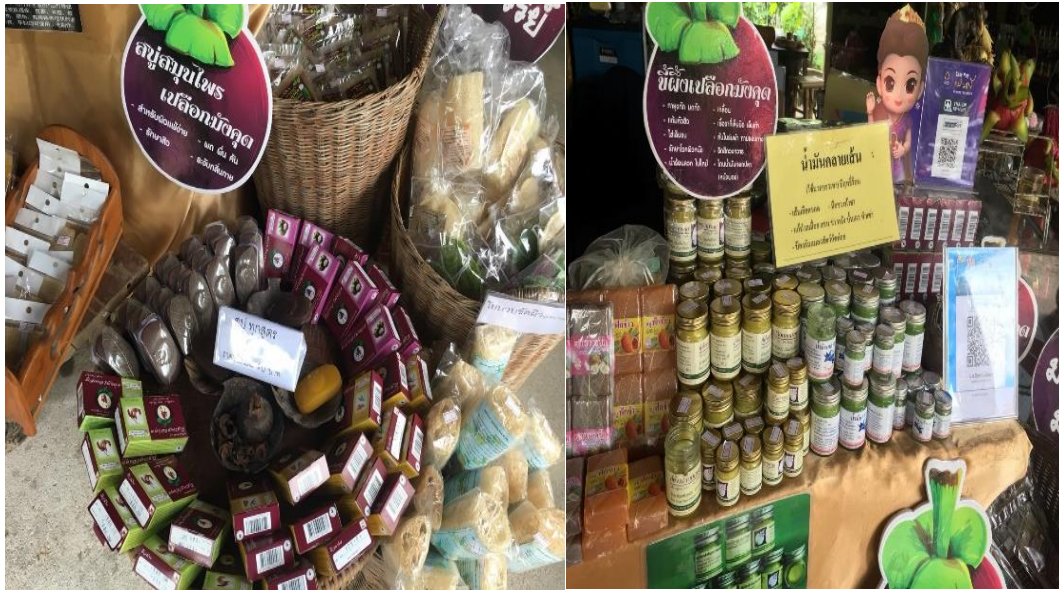
ภาพที่ 26 ผลิตภัณฑ์สบูเปลือกมังคุดและผลิตภัณฑ์จากมังคุด ที่มา : ถ่ายโดยผู้วิจัย เมื่อวันที่ 5 กุมภาพันธ์ 2561