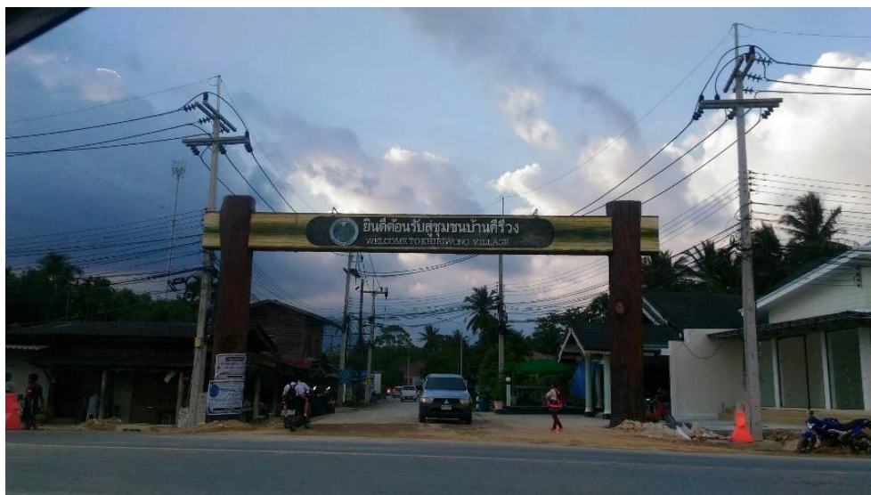
ภาพที่ 12 ทางเข้าสู่ชุมชนคีรีวง ที่มา : ถ่ายโดยผู้วิจัย เมื่อ 13 พฤษภาคม 2561

จากคำสัมภาษณ์เหล่านี้ สะท้อนได้ถึง ชาวบ้านในชุมชนคีรีวง ยังมีวิถีการดำเนินชีวิตที่ยังมีการอาศัยพึ่งพิงธรรมชาติ มีการใช้ทุนภูมิปัญญาและทุนทรัพยากรต่าง ๆ ที่มีอยู่ในพื้นที่มาเพิ่มมูลค่า เป็นการอนุรักษ์สิ่งแวดล้อม โดยอาศัยวิธีการพึ่งพิงธรรมชาติที่มีตั้งแต่ในยุคบรรพบุรุษ แต่ด้วยสถานการณ์บางอย่างเปลี่ยนไป ชาวบ้านจึงต้องมีการปรับตัวจากการเรียนรู้จากธรรมชาติ ส่วนหนึ่งด้วยการช่วยเหลือและฟื้นฟูจากภาครัฐ องค์กร เอกชน ที่เข้ามาช่วยเหลือในด้านต่างๆ แนะนำ ส่งเสริมด้านการประกอบอาชีพ ด้วยความร่วมมือของชุมชนเอง สามารถสร้างอัตลักษณ์ให้กับชุมชน และมองถึงความยั่งยืนของชุมชนคีรีวงในอนาคต ทำให้วิถีชีวิตบางส่วนได้ปรับเปลี่ยนไป มีสิ่งอำนวยความสะดวกเข้ามามากขึ้น ทำให้ชาวบ้านในชุมชนคีรีวง มีโอกาสที่จะสร้างรายได้จากการท่องเที่ยว มองเห็นโอกาสในการเพิ่มรายได้ให้กับชุมชน เพื่อสามารถที่จะดำรงชีวิตต่อไปได้ทั้งในปัจจุบันและในอนาคต