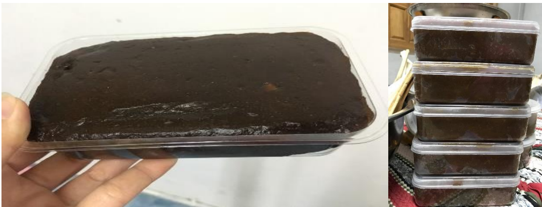
ภาพที่ 32 ผลิตภัณฑ์ทุเรียนบรรจุกล่องพลาสติก ที่มา : ถ่ายโดยผู้วิจัย เมื่อวันที่ 13 พฤษภาคม 2561

สิ่งเหล่านี้เป็นการสะท้อนถึงการเป็นที่รู้จักของทุเรียนกวนศรีวัง และการนำทรัพยากรในชุมชนมาเพิ่มมูลค่า โดยผ่านกระบวนการของภูมิปัญญาชาวบ้าน สามารถขายได้ตลอดปี เมื่อถึงช่วงทุเรียนก็จะกวนเก็บไว้ในปี๊บสะสมไว้พอหมดช่วงทุเรียนก็สามารถนำมาแพ็คขายได้ ให้กลายเป็นสินค้าที่รู้จักและมีชื่อ เป็นส่วนประกอบสร้างจากสินค้าผลผลิตภายในชุมชน เป็นหนึ่งของการท่องเที่ยวของชุมชนศรีวัง ที่มาจากทุนทรัพยากร ทุนภูมิปัญญา มาเพิ่มมูลค่ากลายเป็นสินค้าของชุมชน