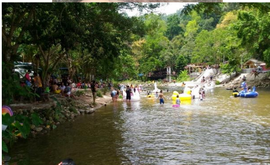
ภาพที่ 19 นักท่องเที่ยวที่มาเล่นน้ำในคีรีวง ที่มา : ถ่ายโดยเพื่อนผู้วิจัย เมื่อวันที่ 5 พฤษภาคม 2561