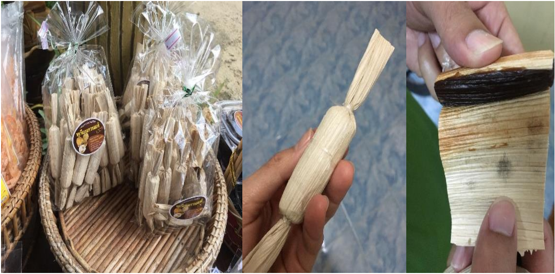
ภาพที่ 31 ผลิตภัณฑ์ทุเรียนกวนห่อกาบหมาก ที่มา : ถ่ายโดยผู้วิจัย เมื่อวันที่ 5 กุมภาพันธ์ 2561