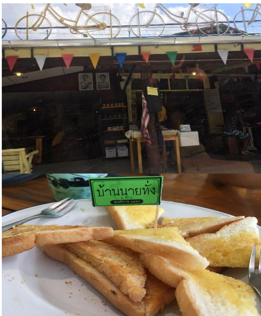
ภาพที่ 42 ร้านกาแฟนายทั้ง ที่มา : ถ่ายโดยผู้วิจัย เมื่อวันที่ 13 พฤษภาคม 2561

“...มากขึ้น 4 – 5 คน กินส้มตำเสร็จก็จะลงเล่นน้ำคะ อากาศก็ต้องคลายร้อนที่อยู่ในตัวเมืองนครศรีฯ มาอยู่บ่อยๆ มีแขกไปใครมาที่นครศรีฯ บ้านเราบางคนถามถึงคีรีวง เราก็จะพามาเที่ยวที่นี่...” (สาลี, สัมภาษณ์วันที่ 13 พฤษภาคม 2561)