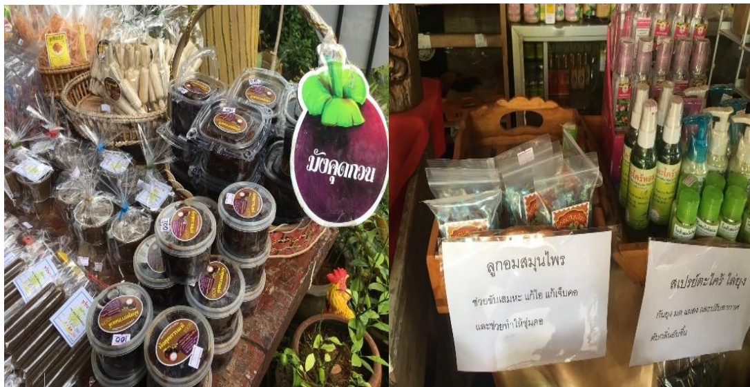
ภาพที่ 27 ผลิตภัณฑ์มังคุดกวน และผลิตภัณฑ์จากสมุนไพร ที่มา : ถ่ายโดยผู้วิจัย เมื่อวันที่ 5 กุมภาพันธ์ 2561

คำให้สัมภาษณ์ดังกล่าวเป็นการสะท้อนให้เห็นว่า สบู่มังคุดเป็นที่รู้จักของผู้คนที่สนใจ สามารถเลือกซื้อได้ตามสรรพคุณที่ผู้ซื้อต้อง มีการออกแบบแพ็คเกจเพื่อให้เห็นเป็นที่รู้จักของนักท่องเที่ยว และยังส่งออกไปขายยังต่างประเทศได้ด้วย ซึ่งเป็นการใช้ทรัพยากรที่มีอยู่ในชุมชนนำมาเพิ่มมูลค่า ส่งขายเป็นแบรนด์ของตัวเอง และยังมีถ่ายทอดภูมิปัญญาของชุมชนผ่านการศึกษาของของกลุ่มต่างๆ ถือเป็นการประชาสัมพันธ์ไปในตัว