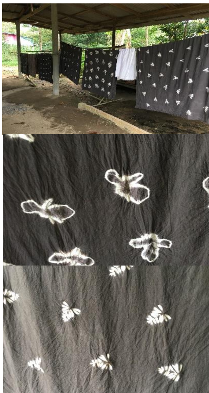
ภาพที่ 36 ลายของผ้ามัดย้อม ที่มา : ถ่ายโดยผู้วิจัย เมื่อวันที่ 5 กุมภาพันธ์ 2561

4) ในส่วนของการย้อมสี นำผ้าที่มัดลายแล้ว จุ่มลงในน้ำสีที่ใส่น้อย แล้วนำผ้าไปต้มในน้ำสีที่กรองไว้ ประมาณ 1 คืน จึงนำผ้าที่ย้อมมาแกะดูลาย ถ้าได้ลายตามต้องการ นำผ้าไปล้างในน้ำสะอาดอีกครั้ง แล้วนำผ้าไปตากไว้ในที่ร่ม 1 วัน แล้วนำผ้าไปแปรรูปตามผลิตภัณฑ์ที่ต้องการ