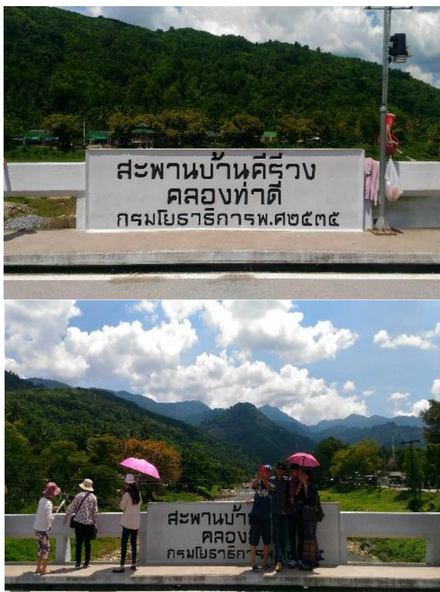
ภาพที่ 20 สะพานบ้านคีรีวง ที่มา : ถ่ายโดยผู้วิจัย วันที่ 13 พฤษภาคม 2561

“...มาเที่ยวคีรีวงครั้งนี้ ได้แวะชมสวนสมรมของชาวบ้านด้วย ซึ่งถ้าเป็นฤดูผลไม้คงได้ ชมไป ชมไป แต่จุดวิวสะพานท่าดีนี่ขาดไม่ได้ ถ้าไม่ได้ถ่ายรูปจุดนี้คงมาไม่ถึงคีรีวงครับ ...” (อาร์ม, สัมภาษณ์วันที่ 6 กุมภาพันธ์ 2561)