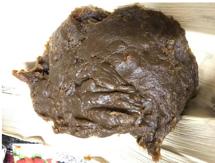
ภาพที่ 30 ทุเรียนกวนเสร็จแล้ว ที่มา : ถ่ายโดยเพื่อนผู้วิจัย เมื่อวันที่ 5 กุมภาพันธ์ 2561

3) นำต่อหมากมาลอกด้านหลังออกเหลือแต่กาบนิ่ม ตัดให้ได้ขนาดตามต้องการ นำทุเรียนกวนที่สุกแล้วตักใส่ต่อหมาก คลึงให้เนื้อทุเรียนแน่น มัดผูกด้วยเชือก