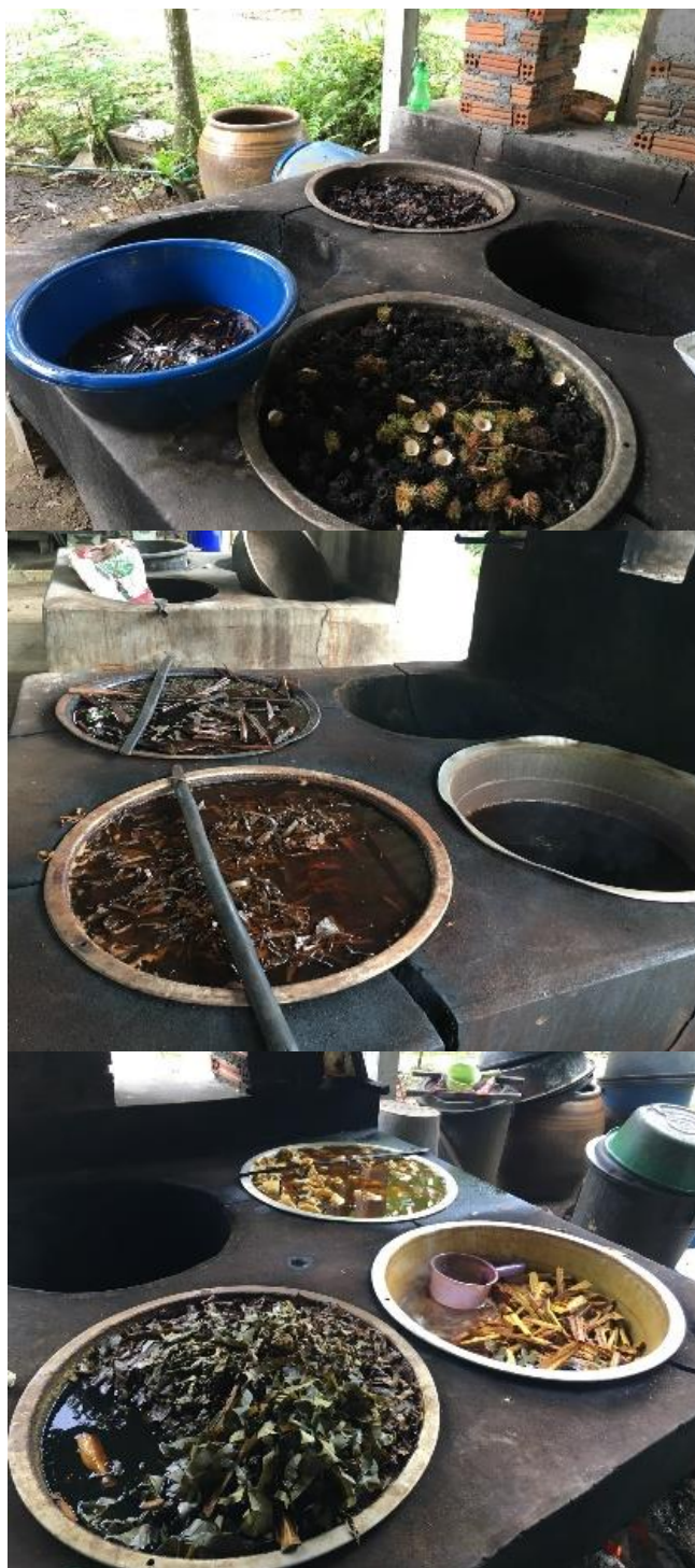
ภาพที่ 34 การเตรียมสีทำมด้อย่อม ที่มา : ถ่ายโดยผู้วิจัย เมื่อวันที่ 5 กุมภาพันธ์ 2561

1) นำวัสดุธรรมชาติที่ต้องการสี มาสับเป็นชิ้นเล็กๆ นำไปต้มกับน้ำสะอาด ประมาณ 1 คืน นำน้ำที่ต้มแล้วมากรองด้วยผ้าขาวบาง เพื่อเตรียมไว้หมักด้อย่อม