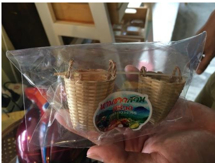
ภาพที่ 39 สินค้าที่ระลึก “หาบชาวสวน” ที่มา : ถ่ายโดยผู้วิจัย เมื่อวันที่ 13 พฤษภาคม 2561

มีการผลิตของที่ระลึกเป็นหาบชาวสวน จัดทำเพื่อเป็นสินค้าของที่ระลึก ในรูปแบบของพวงกุญแจ เพื่อให้นักท่องเที่ยวได้ซื้อกลับไปเป็นที่ระลึก ซึ่งหาบชาวสวน เป็นสิ่งที่ทำจากวัสดุธรรมชาติที่มีอยู่ในพื้นที่ เป็นสิ่งที่บ่งบอก หรือสื่อถึงวิถีชีวิตของชาวสวนที่ใช้ในการประกอบอาชีพ ซึ่งใช้หาบพืชผัก ผลไม้ จากบนสวน ลงมาที่พื้นราบ ซึ่งชาวศรีวังนิยมใช้หาบขนกับรถมอเตอร์ไซด์คันใหญ่ ที่ใช้ขับขึ้นลงสวนที่อยู่บนเขา เพื่อขนส่งผลไม้ และพืชผักลงมาจากสวนสมรมที่อยู่บนเชิงเขา