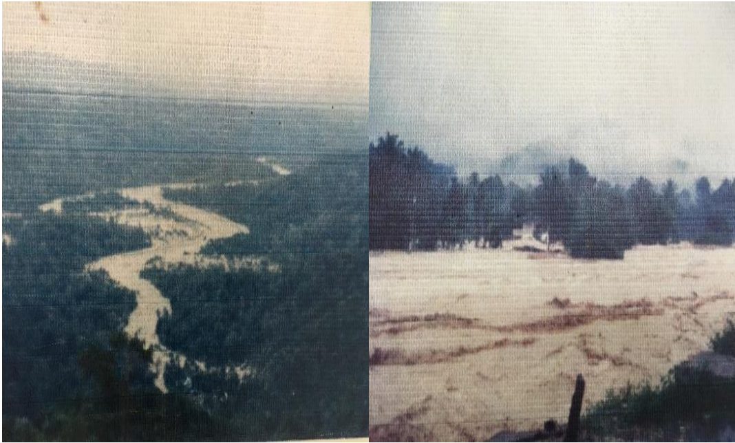
ภาพที่ 8 เหตุการณ์ภัยธรรมชาติ เมื่อปี พ.ศ. 2531