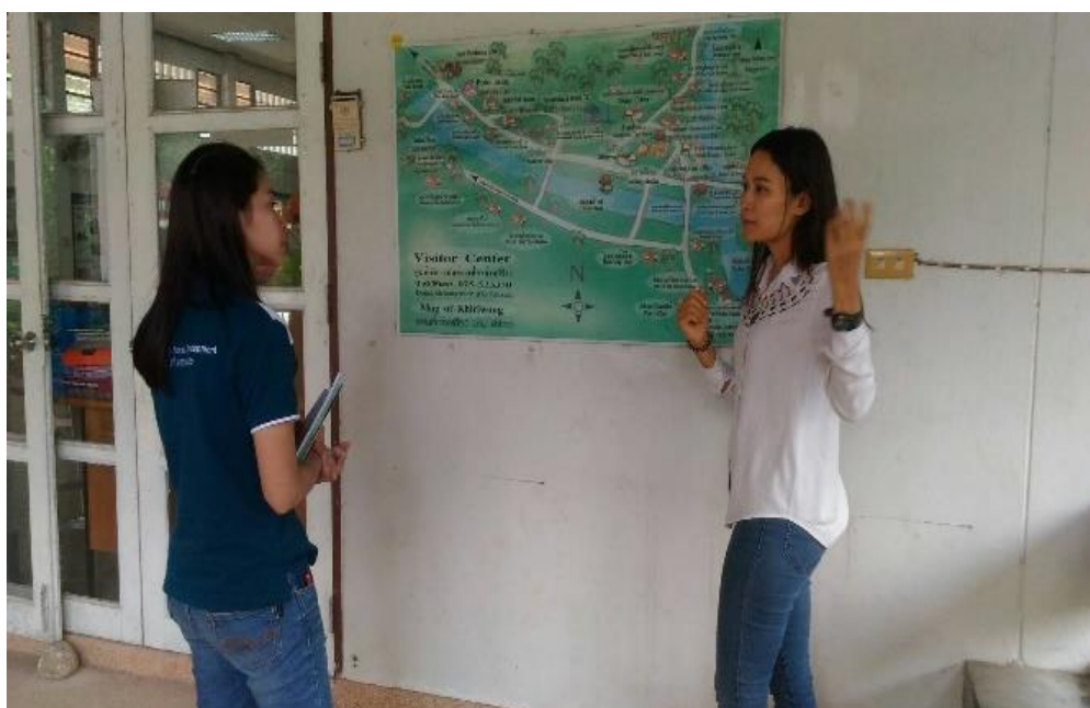
ภาพที่ 15 เจ้าหน้าที่ศูนย์บริการนักท่องเที่ยวให้ข้อมูลแก่ผู้วิจัย ที่มา : ถ่ายโดยเพื่อนผู้วิจัย เมื่อวันที่ 5 กุมภาพันธ์ 2561

นักท่องเที่ยวส่วนใหญ่สนใจเข้ามาเที่ยวชมชุมชนคีรีวงเป็นจำนวนมาก ซึ่งจากทัศนียภาพที่มีความสวยงาม การเที่ยวชมบรรยากาศแบบธรรมชาติ มีทิวเขา ลำน้ำ มีการปรับปรุงพื้นที่ภูมิทัศน์ เพื่อการพักผ่อนหย่อนใจ เพื่อดึงดูดใจนักท่องเที่ยว ในชุมชนคีรีวง มีการท่องเที่ยวในหลากหลายแบบ เช่น การท่องเที่ยวเชิงนิเวศ การท่องเที่ยวเชิงอนุรักษ์ธรรมชาติ เป็นต้น