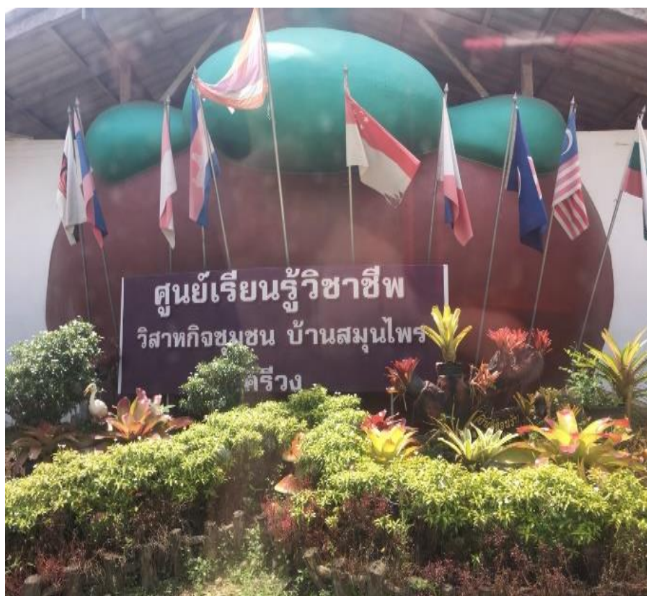
ภาพที่ 21 ศูนย์เรียนรู้วิชาชีพบ้านสมุนไพร

“...วันนี้พี่มาเป็นผู้ถ่ายทอดภูมิปัญญาชาวบ้านศรีวังค่ะ จะสาธิตการทำสบู่เปลือกมังคุดพร้อมกับพานักเรียน กับผู้สนใจชมโรงทำสบู่ค่ะ...” (นัท, สัมภาษณ์วันที่ 5 กุมภาพันธ์ 2561)