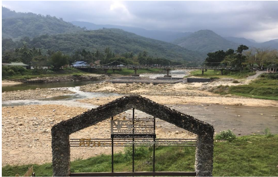
ภาพที่ 17 จุดชมวิวกุ่มชนคีรีวง ที่มา : ถ่ายโดยเพื่อนผู้วิจัย เมื่อวันที่ 5 กุมภาพันธ์ 2561