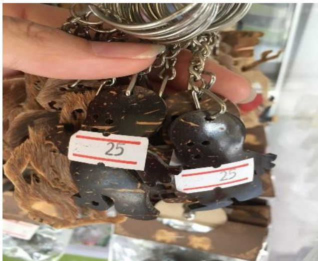
ภาพที่ 38 ผลิตภัณฑ์จากกะลามะพร้าว ที่มา : ถ่ายโดยผู้วิจัย เมื่อวันที่ 13 พฤษภาคม 2561