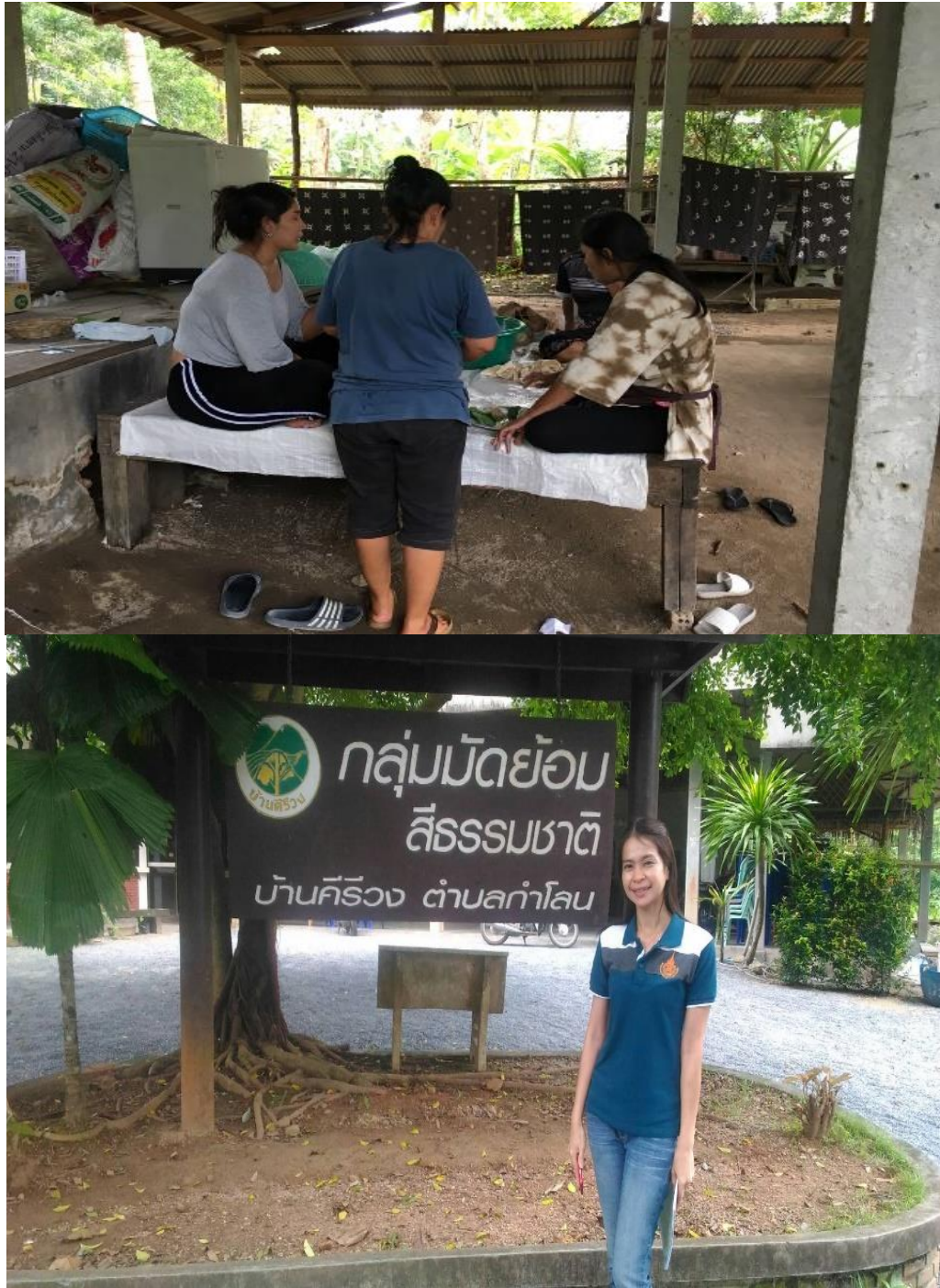
ภาพที่ 22 การสาธิตการเตรียมสีผ้ามัตย้อม เมื่อวันที่ 5 กุมภาพันธ์ 2561