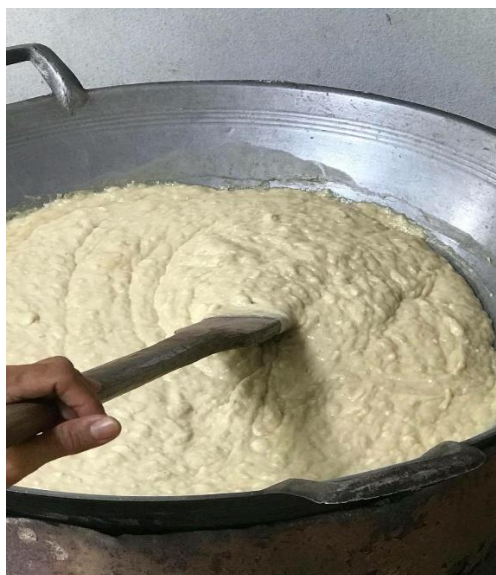
ภาพที่ 29 การทำทูเรียนกวน เมื่อวันที่ 5 กุมภาพันธ์ 2561

2) ใช้ไม้พายกวนทูเรียนในกระทะใช้ไฟแรงพอประมาณ กวนจนเนื้อทูเรียนหลุดออกมาจากเมล็ด หรือเนื้อไปรวมอยู่ที่หัวเมล็ดแล้วแกะเนื้อส่วนหัวออก เอาเมล็ดทิ้ง เมล็ดจากทูเรียนนี้รับประทานได้ เด็กๆชอบกินเพราะรสชาติมันหอม การกวนใช้เวลาประมาณ 2-3 ชั่วโมง จนมันของเนื้อทูเรียนออกมา แล้วกวนจนเนื้อทูเรียนแห้งได้ดี ตักใส่ภาชนะไว้ให้คลายร้อน