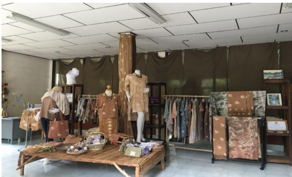
ภาพที่ 33 ฝ้ายมัดย้อมสีจากธรรมชาติ

การย้อมสีธรรมชาติ เป็นความรู้และภูมิปัญญาของชาวบ้านที่ถ่ายทอดสืบต่อกันมาจากรุ่นสู่รุ่น ถือเป็นทุนภูมิปัญญาของชุมชน ที่การสืบทอดวิธีการทำมาจากรุ่นสู่รุ่นและเป็นวิถีชีวิตและวัฒนธรรมที่สอดคล้องกับชุมชน การย้อมสีธรรมชาติไม่เป็นการทำลายสิ่งแวดล้อม เป็นการฟื้นฟูธรรมชาติ การย้อมสีธรรมชาติเป็นกระบวนการที่พึ่งพิงกับวัสดุธรรมชาติ ใช้ประโยชน์จากธรรมชาติ โดยวิธีการย้อมสีจากธรรมชาติ ไม่ได้มีประโยชน์แค่อย่างเดียว แต่เป็นการอนุรักษ์รักษาต้นไม้ และการปลูกเพิ่มเติม เพื่อใช้ในการเพิ่มวัตถุดิบในการผลิตครั้งต่อไป วัสดุที่นิยมนำมาใช้ทำสีย้อมผ้าธรรมชาติ เป็นส่วนต่างๆของต้นไม้ เช่น เปลือก แก่น ราก ใบ ดอกและผล ซึ่งจะให้สีที่แตกต่างกันออกไป เช่น ใบมังคุด ให้สีส้มอมชมพู แก่นขนุน ให้สีเหลืองสด โดยการนำผ้าฝ้ายมาย้อมด้วยสีที่ได้จากธรรมชาติ และนำมาออกแบบตัดเย็บให้เป็น เสื้อผ้า ชุด ผ้าพันคอ ผ้าคลุมไหล่ กระเป๋า ผ้ามา่าน ซึ่งสีที่ได้นำมาย้อมผ้า ไม่เป็นอันตรายต่อผิวหนัง เพราะไม่มีส่วนผสมของสารเคมี จึงได้สีแบบธรรมชาติที่โดดเด่น เพื่อจำหน่ายให้กับนักท่องเที่ยวที่เข้ามาเที่ยวชม ถือเป็นทุนทรัพยากร ที่เลือกใช้วัสดุจากธรรมชาติที่มีในชุมชนและทุนภูมิปัญญาทำให้เกิดเป็นผลิตภัณฑ์ของชุมชน