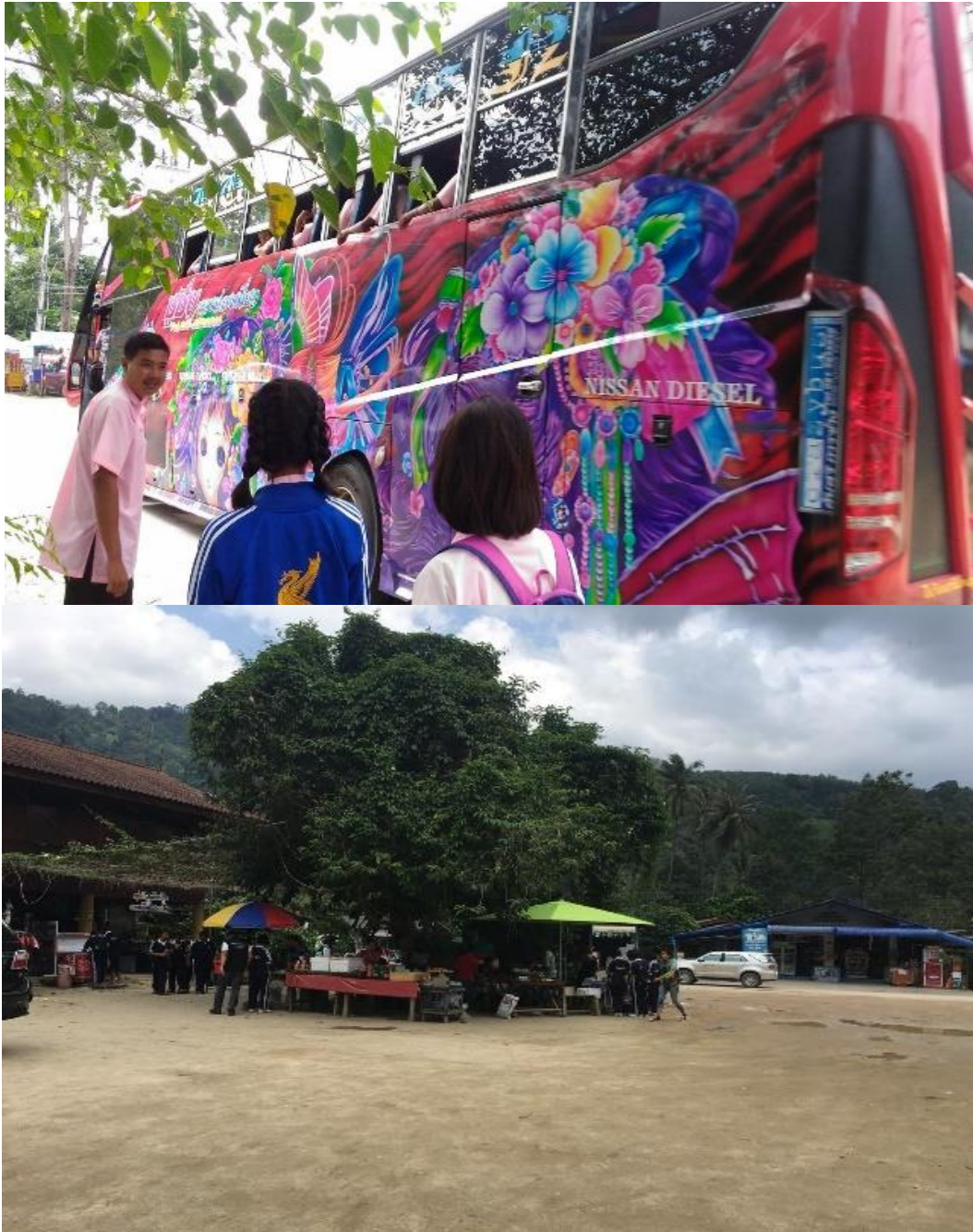
ภาพที่ 23 กลุ่มนักเรียนที่เดินทางมาดูงานที่ศรีวัง