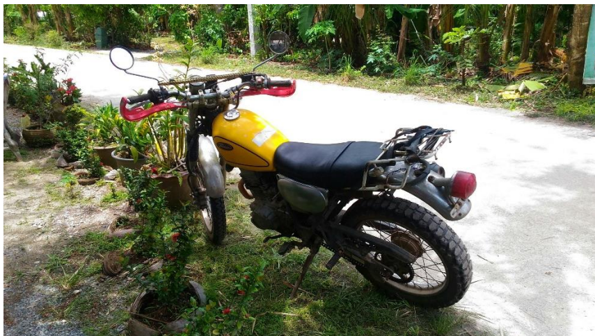
ภาพที่ 4 รถจักรยานยนต์ที่ใช้นำผลไม้ลงจากเขา ที่มา : ถ่ายโดยผู้วิจัย เมื่อวันที่ 25 มีนาคม 2561

ชุมชนคีรีวง เป็นชุมชนที่มีทรัพยากรทางธรรมชาติที่สมบูรณ์ พืชพันธุ์ต่างๆสามารถเจริญเติบโตได้ดี มีพื้นที่ทางกายภาพที่เอื้ออำนวย ชาวบ้านส่วนใหญ่ในชุมชนคีรีวง จึงประกอบอาชีพทำสวนผลไม้ ซึ่งเรียกว่า “สวนสมรม” เป็นลักษณะของสวนที่ปลูกผลไม้ และผักหลากหลายชนิดในพื้นที่เดียวกัน เช่น สะตอ ลูกเนียง หมากร ขนุน จำปาตะ พุเรียน ลองกอง ลางสาด มังคุด เงาะ และอีกหลาย ๆ อย่าง สวนสมรมมีเอกลักษณ์พิเศษที่แตกต่างจากสวนผลไม้อื่น ๆ ทั่วไป ที่ชาวบ้านมีการนำเอาพืชไม้ผลหลากหลายสายพันธุ์มาปลูกรวมไว้ภายในสวนแห่งเดียวกัน ด้วยความแตกต่างและวิธีการปลูกพืชพรรณที่แตกต่างจากการทำสวนในพื้นที่อื่นๆ ซึ่งถ้าหากเข้าไปในสวนสมรม ถ้ามองดูเผิน ๆ ก็แทบแยกไม่ออกระหว่างสวนกับป่าไม่มีความแตกต่างกันเลย ยิ่งถ้าไม่มีความรู้ทางกายภาพ ต้นผลไม้ต่าง ๆ ว่าเป็นอย่างไรก็อาจจะไม่รู้เลยว่าบริเวณนี้เป็นสวนผลไม้ จากวิถีชีวิตและการประกอบอาชีพทำสวน แสดงให้เห็นถึงการมีวิถีชีวิตที่เรียบง่าย พึ่งพาอาศัยธรรมชาติในการดำเนินชีวิต เป็นการบ่งบอกถึงวิถีชีวิตและความเป็นอยู่ของชาวชุมชนคีรีวง ที่แสดงให้เห็นว่า ชุมชนคีรีวงเป็นชุมชนที่มีความเก่าแก่มานานหลายร้อยปี ซึ่งสืบทอดอาชีพการทำสวนสมรม มาตั้งแต่สมัยบรรพบุรุษ ดังจะเห็นได้จากคำสัมภาษณ์ของจากชาวบ้านที่อาศัยอยู่ในชุมชนคีรีวง ที่ได้บอกเล่าแก่ผู้วิจัย ดังนี้