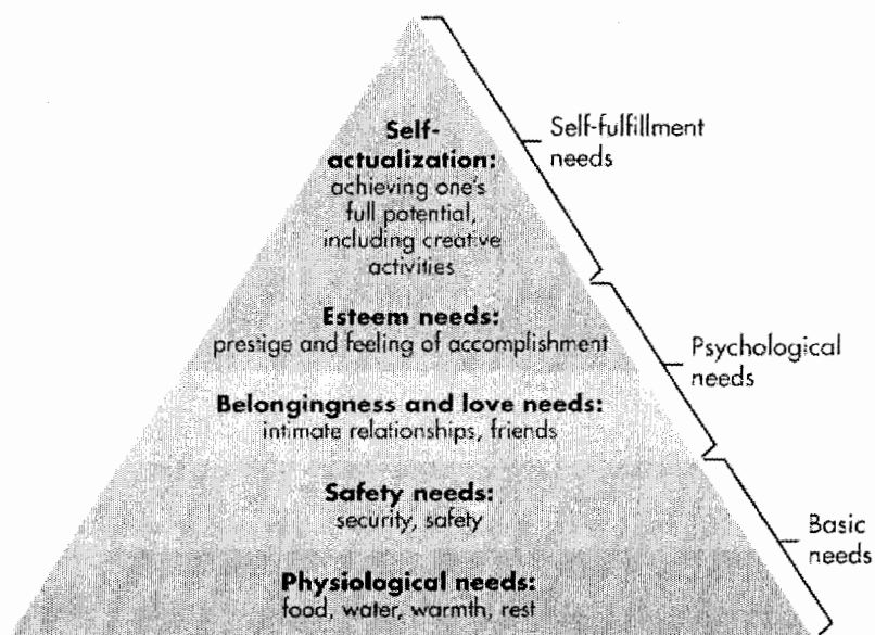
ภาพที่ 1 ลำดับชั้นความต้องการตามทฤษฎีมาสโลว์

ภาพที่ 1 Saul McLeod.(2018). Maslow's Hierarchy of Needs .Retrieved from https://www.simplypsychology.org/maslow.html เข้าถึงเมื่อวันที่ 6 กันยายน 2561