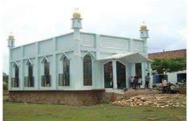
ملحق رقم (23): صورة مسجد نور الإسلام