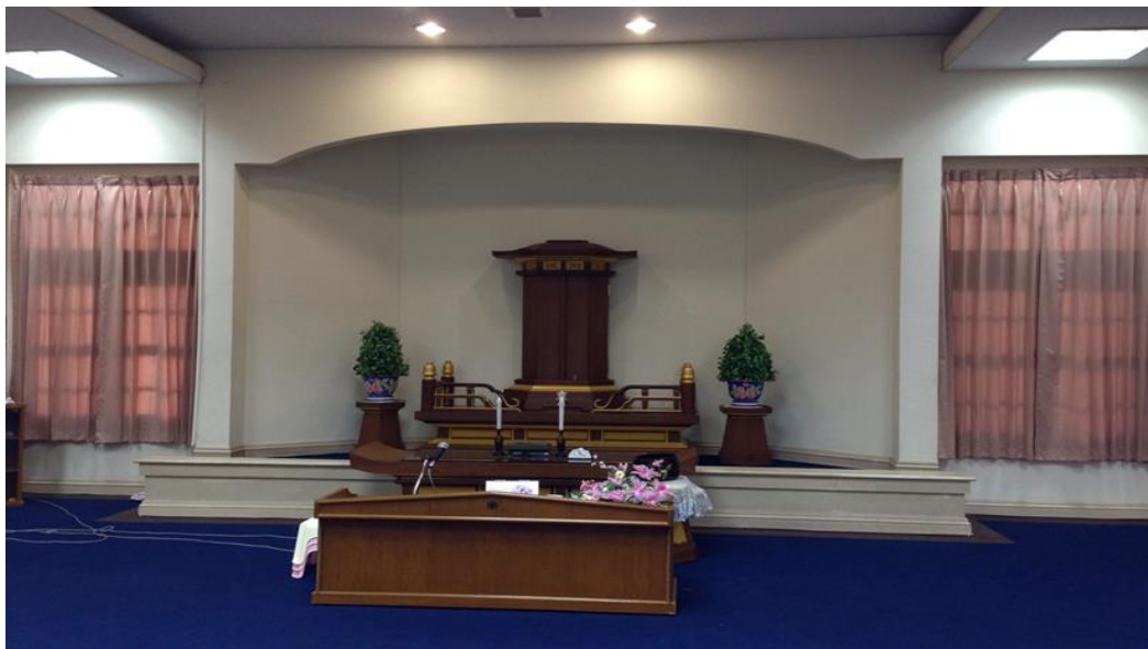
ภาพที่ 1 สถานที่ประดิษฐานโงะฮอนชนภายในอาคารสมาคม เขตสุขโขงโก-ลก ที่มา : ผู้วิจัย, ถ่ายเมื่อ 9 พฤษภาคม 2558