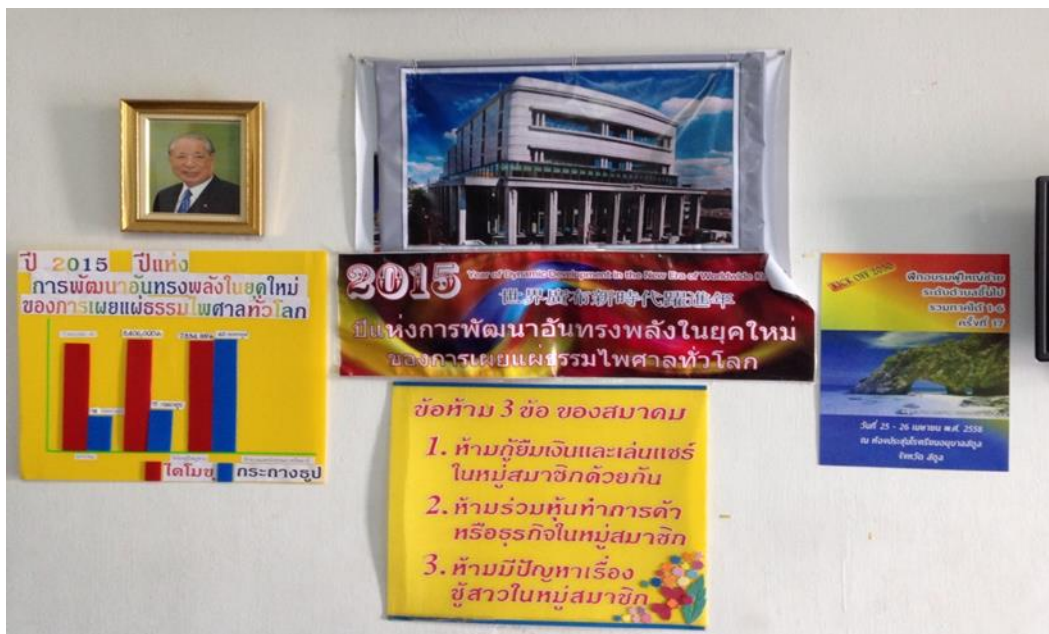
ภาพที่ 5 การรณรงค์เพื่อการเผยแพร่ธรรมภายในห้องพระผู้นำภาคปัตตานี