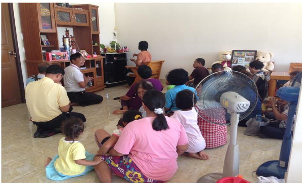
ภาพที่ 8 บรรยากาศในพิธีสวดมนต์ตั้งโต๊ะบูชาและกระถางรูปภาคยะลา ที่มา : ผู้วิจัย, ถ่ายเมื่อ 22 เมษายน 2558