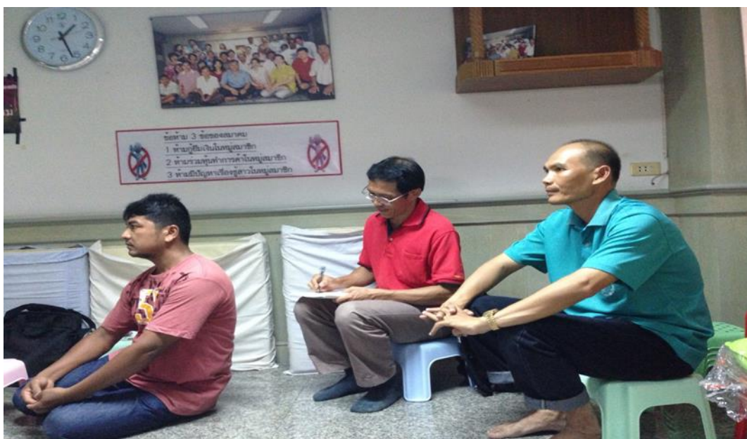
ภาพที่ 4 บรรยายภาคการประชุมสนทนาธรรม 4 ฝ่าย เขตสุโขทัย-ลก