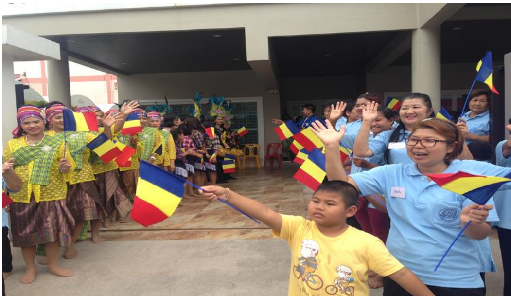
ภาพที่ 7 บรรยากาศการต้อนรับในพิธีสวดมนต์ในโอกาสพิเศษภาคยะลา