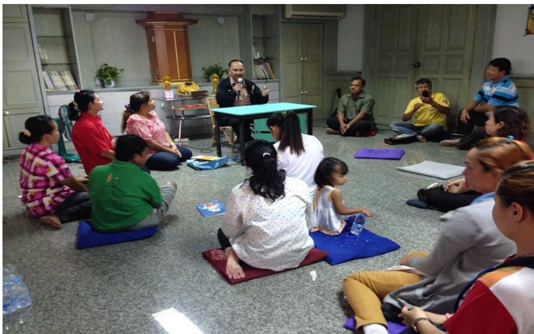
ภาพที่ 3 บรรยายภาคการประชุมสนทนาธรรม 4 ฝ่าย เขตสุโขทัย-ลก ที่มา : ผู้วิจัย, ถ่ายเมื่อ 9 พฤษภาคม 2558