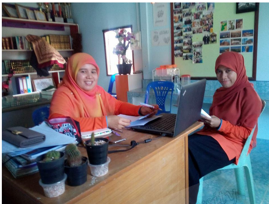
ครูสอนศาสนาโรงเรียนประทีปวิทยา