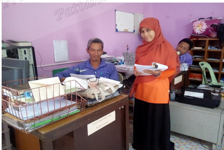
ครูสอนสามัญ โรงเรียนประทีปวิทยา