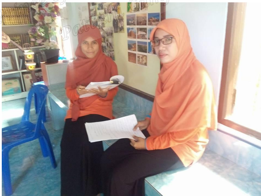
ครูสอนศาสนาโรงเรียนประทีปวิทยา