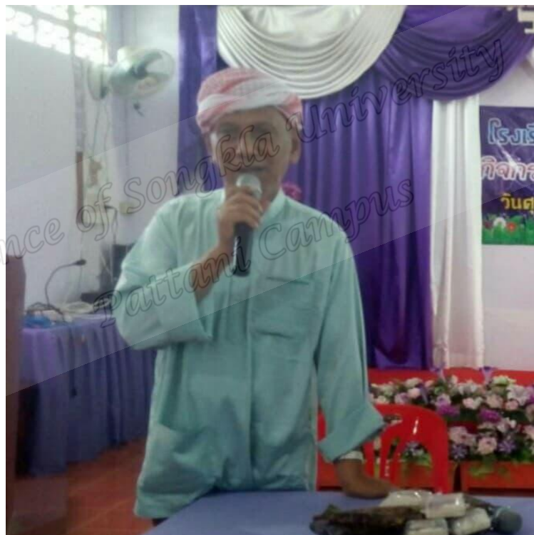
ผู้นำทางศาสนา อีหม่ามบ้านบาตัน ตำบลลิคูล อำเภอมือทอง จังหวัดยะลา