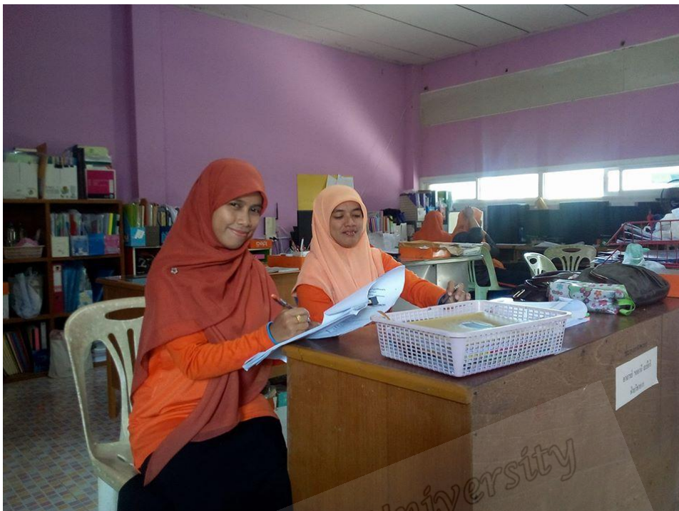
ครูสอนสามัญ โรงเรียนประทีปวิทยา