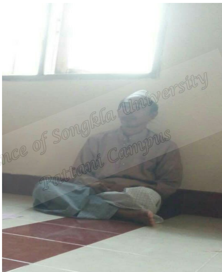
ผู้นำทางศาสนา เคาะฎีบบ้านบาตัน ตำบลลิคด อำเภอมืออง จังหวัดยะลา