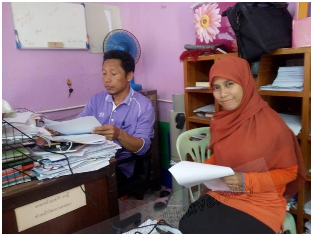
ผู้นำทางศาสนา บิลาบ้านบาตัน ตำบลลิคูล อำเภอเมือง จังหวัดยะลา