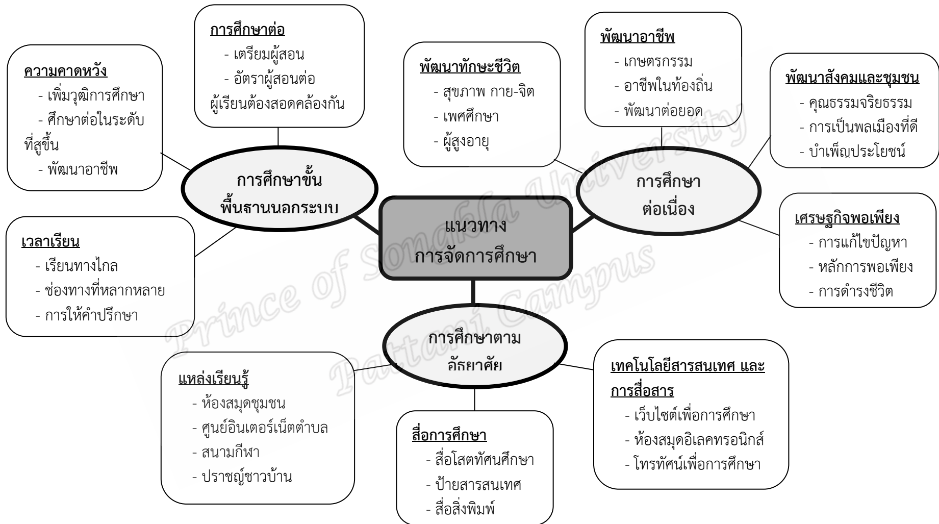
ภาพประกอบ 4 แนวทางการจัดการศึกษานอกระบบและการศึกษาตามอัธยาศัยของผู้เรียนในจังหวัดปัตตานี