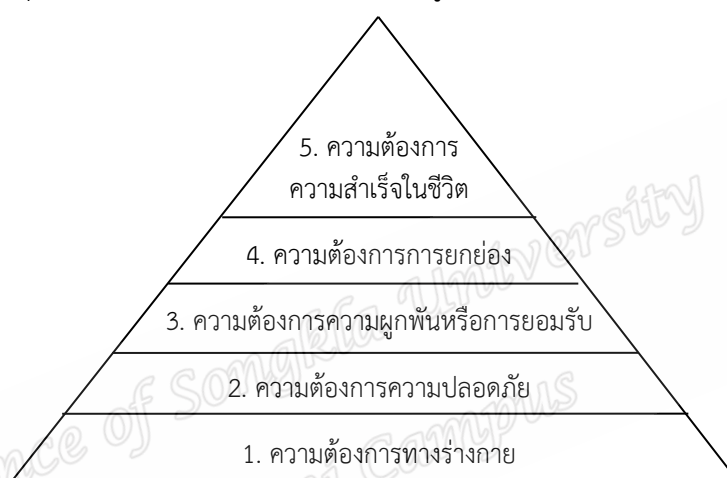
ภาพประกอบที่ 2 แสดงลำดับขั้นความต้องการของ Maslow

ริงสรรค์ ประเสริฐศรี (2548: 90-91) ได้กล่าวถึงทฤษฎีลำดับขั้นความต้องการของ Maslow เป็นทฤษฎีที่เกี่ยวข้องกับความต้องการขั้นพื้นฐานของมนุษย์ ซึ่งกำหนดโดยนักจิตวิทยาชื่อ Maslow เป็นทฤษฎีการจูงใจที่มีการกล่าวกันอย่างแพร่หลาย Maslow มองว่าความต้องการของมนุษย์มีลักษณะเป็นลำดับขั้นจากระดับต่ำสุดไปยังระดับสูงสุด เมื่อความต้องการในระดับหนึ่งได้รับการตอบสนองแล้ว มนุษย์ก็จะมีความต้องการอื่นในระดับที่สูงขึ้นต่อไป