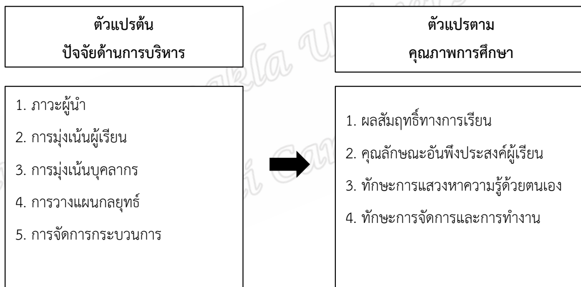
ภาพประกอบ 1 กรอบตัวแปรในการวิจัย