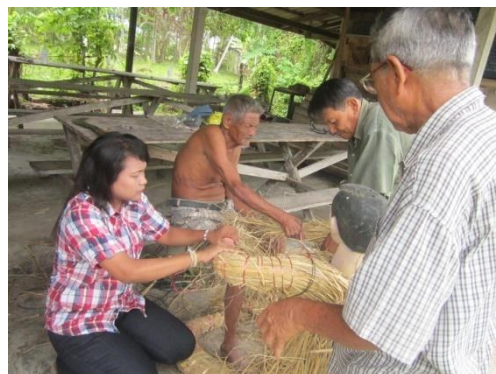
ภาพที่ 3 การนำซังข้าวของทุกคนมามัดรวมกัน และภาพที่ 4 การทำหุ่นฟาง ที่มา : ถ่ายโดยผู้วิจัยวันที่ 18 พฤษภาคม 2557

ส่วนการนำซังข้าวที่เก็บมาจากนาแปลงสุดท้าย คนละ 2-3 ตัน นำมามัดรวมเข้า ด้วยกัน โดยแบ่งเป็น 2 กอง ช่วยกันมัดทำเป็นหุ่นคน ให้มีหัว คอ ลำตัว แขน ขา ตัวหนึ่งทำเป็นผู้หญิง อีกตัวหนึ่งทำเป็นผู้ชาย แต่งตัวให้อย่างสวยงาม “สมมุติชื่อหุ่นฝ่ายชายว่าซุ่มพุก หุ่นฝ่ายหญิงว่าสุนทรี ชื่อนี้มีมาแต่โบราณ นับถือว่าเป็นผีเชื่อ เชื่อสายบรรพบุรุษ ปู่ ย่า ตา ทวด คนที่ดลบันดาลให้ข้าว มีความอุดมสมบูรณ์ ไม่มีศัตรูพืช ออกผลดี” (บุญศรี แก้วเรือง, สัมภาษณ์วันที่ 12 มี.ค. 57)