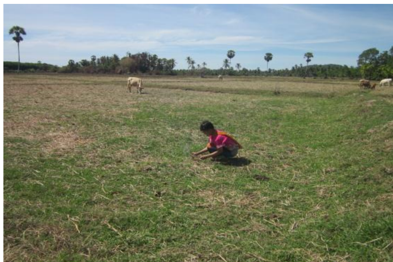
ภาพที่ 31 การใช้แรงงานคนและสัตว์ในการทำนา

“การรื้อฟื้นพิธีกรรมลาซังกลับมา ก็ทำให้วิถีชีวิตของคนทำนาก็กลับมาเช่นกัน การใช้แรงงานคน และสัตว์แทนเครื่องจักรกล การร่วมแรงร่วมใจช่วยกันทำให้วิถีชีวิตที่เคยเกิดขึ้นในชุมชนตระกานเมื่อครั้งอดีตกลับมาอีกครั้ง” (ดารุณี ศักดิ์เจริญ ณ นครพนม , สัมภาษณ์ วันที่ 12 มีนาคม 2557)