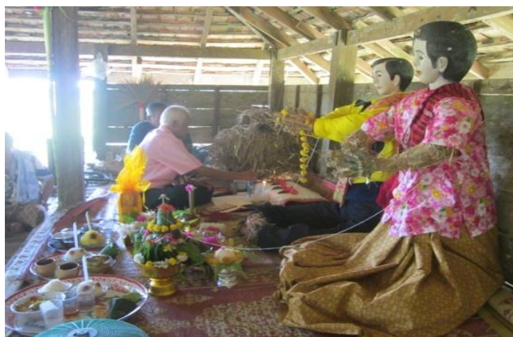
ภาพที่ 30 ครูหมอและผู้สืบทอดรุ่นต่อไป

“การทำพิธีกรรมลาซังในชุมชนตระเถาะแก่นนี้ ต้องใช้ความรู้ ความเข้าใจของคนที่เคยร่วมพิธีกรรมเมื่อครั้งก่อน ก่อนเกิดเหตุการณ์มาช่วยกันวางแผนว่าจะทำแบบไหนให้ถูกต้อง ตามความเข้าใจที่ตรงกัน” (ผิน จุลราช, สัมภาษณ์วันที่ 19 กุมภาพันธ์ 2557)