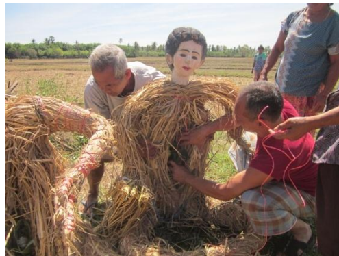
ภาพที่ 9 การทำพิธีบวงสรวง และภาพที่ 10 แหวกท้องทุ่งฟางใส่เครื่องสังเวย