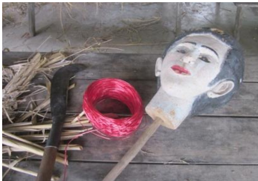
ภาพที่ 9 อุปกรณ์ที่ใช้ในการทำหุ่นฟาง