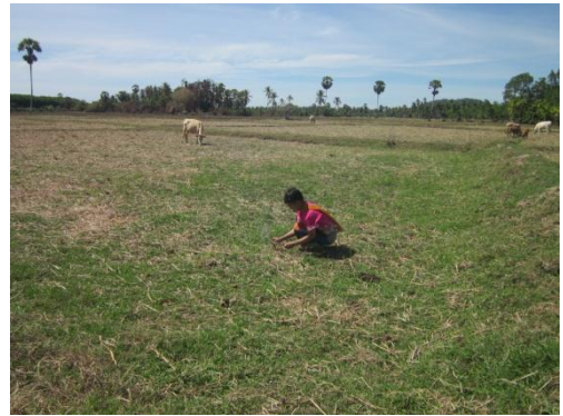
ภาพที่ 7 การทำพิธีบวงสรวง และภาพที่ 8 การใช้แรงงานคนและสัตว์ในการทำนา