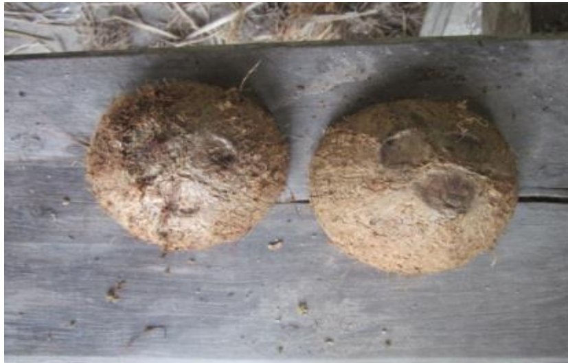
ภาพที่ 8 กะลามะพร้าวนำมาทำเป็นหน้าอกของหุ่นฟางผู้หญิง