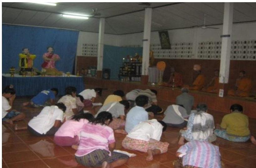
ภาพที่ 13 วัดโบกขรณี สถานที่สมโภชหุ่นฟาง ที่มา : ถ่ายโดยผู้วิจัยวันที่ 18 พฤษภาคม 2557