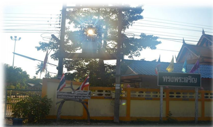
ภาพที่ 3 วัดโบกขรณี

นอกจากนั้นยังพบว่า คนในเตราะแก่นนับถือศาสนาพุทธ 100% ในการทำกิจกรรมทางศาสนา ก็ทำที่วัดโบกขรณี และวัดจุฬามณี (เจ้าอาวาสดำรงตำแหน่งเจ้าคณะอำเภอ) หรือว่าวัดแป้น การทำกิจกรรมต่าง ๆ ที่มีในชุมชนได้รับความร่วมมือเป็นอย่างดี ไม่ว่าจะเป็นหน่วยงานรัฐที่เข้ามาสนับสนุนการพัฒนาชุมชน หรือหน่วยงานอื่นนะ เห็นได้จากคนส่วนใหญ่ในชุมชนเดินทางมาร่วมกิจกรรมพร้อมเพรียงกัน ให้ความสำคัญกับสิ่งที่เกิดขึ้นในชุมชน ชาวบ้านส่วนใหญ่ยังคงยึดอาชีพทำนา ทำสวน ทำไร่และเลี้ยงสัตว์ (ดารุณี ศักดิ์เจริญ ณ นครพนม, สัมภาษณ์วันที่ 12 มี.ค. 57)