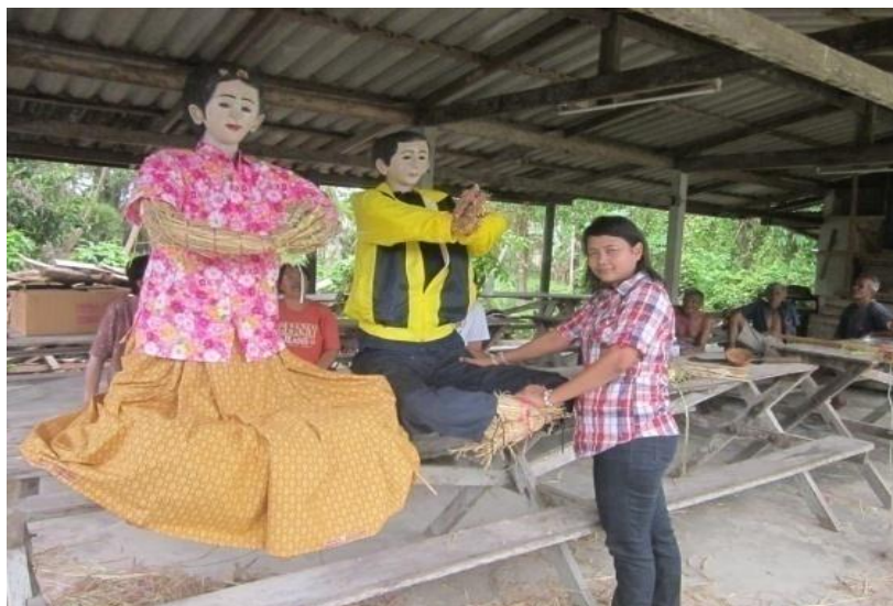
ภาพที่ 12 หุ่นฟางที่เตรียมประกอบพิธีกรรม

“การทำพิธีนั้น ต้องเตรียมหลายอย่าง แต่หลายคนก็พอรู้ว่าเป็นแบบไหน” (สุนีย์ ยกสกุล, สัมภาษณ์วันที่ 4 มี.ค. 57)