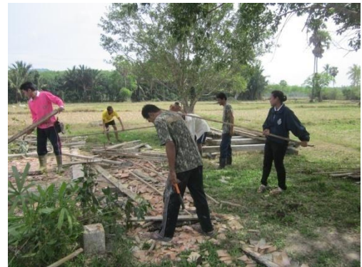
ภาพที่ 5 การประชุมเพื่อเตรียมประกอบพิธีกรรมลาซัง และภาพที่ 6 ผู้วิจัยร่วมกิจกรรมการซ่อมศาลากลางทุ่งนาซึ่งเป็นสถานที่ประกอบพิธีพิธีกรรมลาซัง