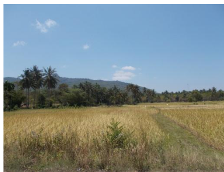
ภาพที่ 1 แผนที่อำเภอสายบุรี และภาพที่ 2 บริเวณทุ่งนาในชุมชนตระแค้น

พื้นที่ตำบลแป้น เป็นตำบลหนึ่งในอำเภอสายบุรี จังหวัดปัตตานี “ชาวบ้านในตำบลแป้น นับถืออิสลามและพุทธ คนในหมู่ 1, 2, 3 และ 4 ทุกคนนับถือศาสนาอิสลาม ในหมู่ 5 และหมู่ 6 นับถือพุทธ ส่วนหมู่ 7 กับ 8 มีทั้งพุทธและอิสลาม มีการผสมผสานวัฒนธรรมอยู่ร่วมกัน ตระกูลใหญ่คนตำบลนี้ มี หะยีปือราเฮง ตาเห สาแม แดงวิไล เงินราชฎร์และแดงเงิน แล้วยังอื่น ๆ อีกมากมาย ที่พบบ่อยนะ” (อังคณา หะยีปือราเฮง, สัมภาษณ์วันที่ 12 มี.ค. 57)