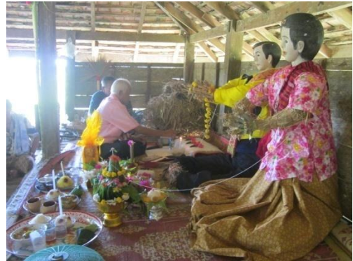
ภาพที่ 1 การสมโภชหุ่นฟาง และภาพที่ 2 การทำพิธีลาซัง