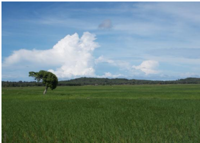
ภาพที่ 27 พื้นที่นาในชุมชนตระระแก่น ที่มา : ถ่ายโดยผู้วิจัยวันที่ 23 กุมภาพันธ์ 2557