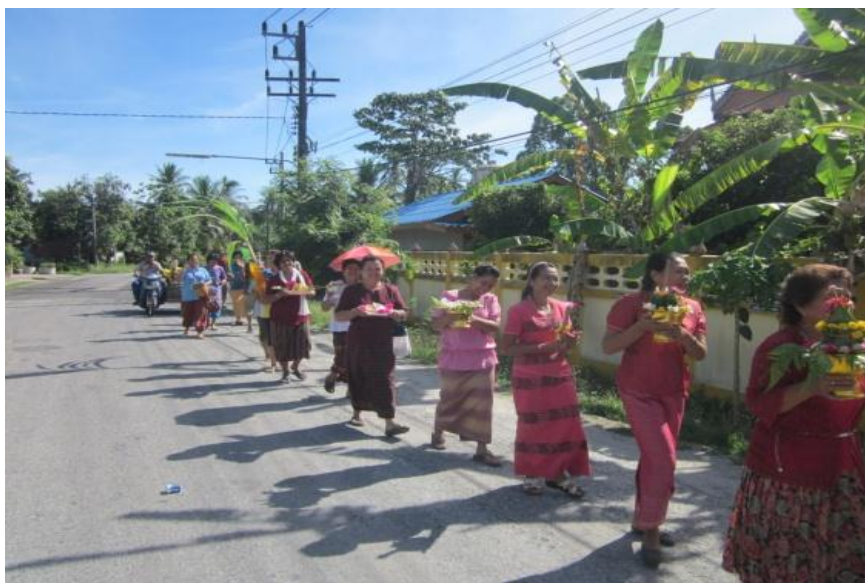
ภาพที่ 15 ขบวนแห่ขันหมาก

ขบวนแห่ขันหมากทั้งในอดีตและในปัจจุบัน รูปแบบขบวนแห่ขันหมากจะคล้ายคลึงกัน โดยจะประกอบไปด้วยผู้ที่ถือขันหมากจำนวน 9 คน (ตามจำนวนขันหมาก) คุณสมบัติของผู้ที่จะถือขันหมาก จะต้องเป็นเพศหญิงเท่านั้น และจะต้องมีชีวิตครอบครัวที่สมบูรณ์ มีความสุขในชีวิต เพื่อจะได้แสดงออกถึงความเป็นสิริมงคลให้แก่หุ่นบ่าว-สาวที่จะแต่งงานกัน ชีวิตจะได้สมบูรณ์และมีความสุขไปด้วย การแต่งกายของผู้ถือขันหมากจะแต่งกายด้วยชุดผ้าไหมที่มีการตัดเย็บขึ้นมาใหม่เพื่อใช้สวมใส่ในพิธี รูปแบบแตกต่างกันไปตามความชอบของแต่ละคน นอกจากผู้ถือขันหมากแล้วยังมีผู้ที่ถือต้นกล้วย ต้นอ้อย มีกลอง ทับ ฉิ่ง ฉาบ บรรเลงตลอดเส้นทางขบวนแห่จนถึงจุดประกอบพิธีกรรม และผู้ที่แห่หุ่นฟางที่เป็นเจ้าบ่าวจะต้องเป็นผู้ชายเท่านั้น ส่วนที่แตกต่างจากอดีตก็คือพาหนะที่ใช้ในการเดินทางของหุ่นฟาง ในอดีตจะเป็นการลากเกวียน แต่ในปัจจุบันจะเป็นการใช้รถจักรยานยนต์สามล้อเป็นยานพาหนะให้หุ่นฟาง เนื่องจากเกวียนนั้นไม่ปรากฏการนำมาใช้ในการทำนาในปัจจุบัน แต่ยานพาหนะที่ใช้ในเดินทางจากบ้านไปยังทุ่งนานั้นกลับกลายเป็นรถจักรยานยนต์สามล้อ