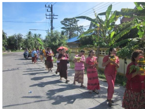
ภาพที่ 7 เครื่องสังเวย และภาพที่ 8 ขบวนแห่ขันหมาก ที่มา : ถ่ายโดยผู้วิจัยวันที่ 19 พฤษภาคม 2557