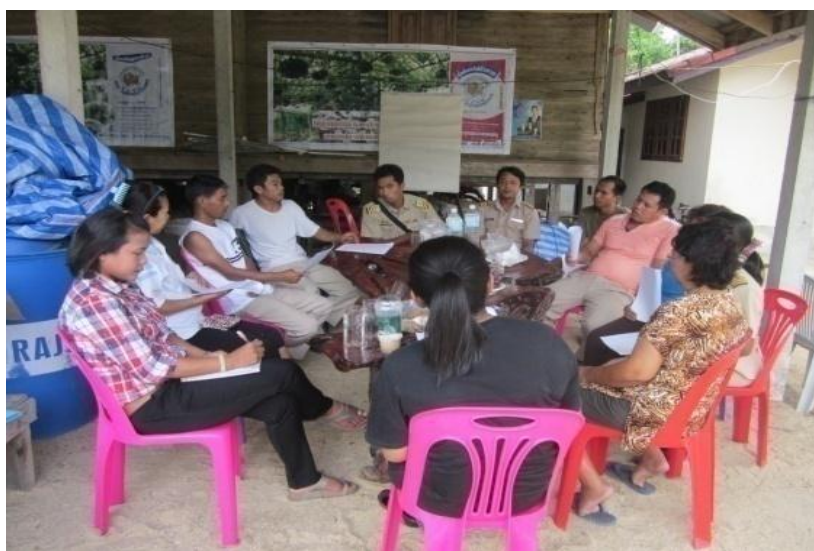
ภาพที่ 23 การประชุมเพื่อเตรียมประกอบพิธีกรรมลาซัง