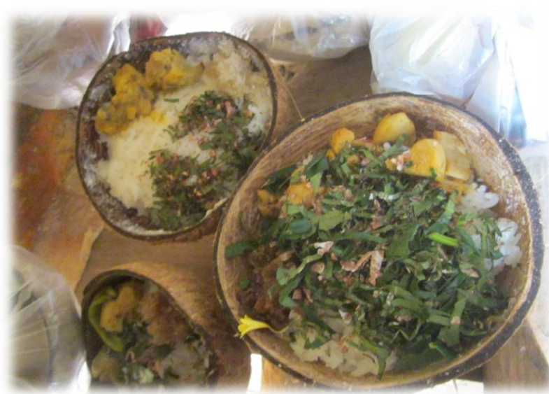
ภาพที่ 20 เครื่องสังเวยที่จะตั้งในทุกราชของแต่ละแปลง

“ตอนที่ครูหมอบำทำพิธีอยู่นั้น แต่ละขั้นตอนจะมีการสอดแทรกคำสอน หลักในการดำรงชีวิต การระลึกถึงบุญคุณของข้าว ให้แก่ผู้เข้าร่วมพิธีฟัง” (พรศิริ สุขเสียง, สัมภาษณ์วันที่ 15 พ.ค. 58)