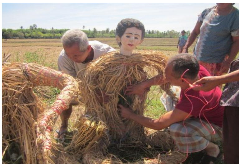
ภาพที่ 22 แหวกท้องหุ่นฟางใส่เครื่องสังเวสวันที่ 19 พฤษภาคม 2557

หลังจากนั้นก็ให้นำหุ่นฟางทั้งคู่ไปไว้กลางทุ่งนา แล้วแหวกท้องของหุ่นฟาง ผู้ร่วมพิธีก็จะนำเครื่องสังเวสไนท้องของหุ่นฟาง ถือว่าหุ่นฟางได้รับประทานแล้ว ส่วนเครื่องสังเวสที่เหลือ ผู้ร่วมพิธีจะนำไปไหว้เจ้าที่ เจ้าเรือนที่บ้านต่อไป ถือเป็นอันเสร็จพิธี