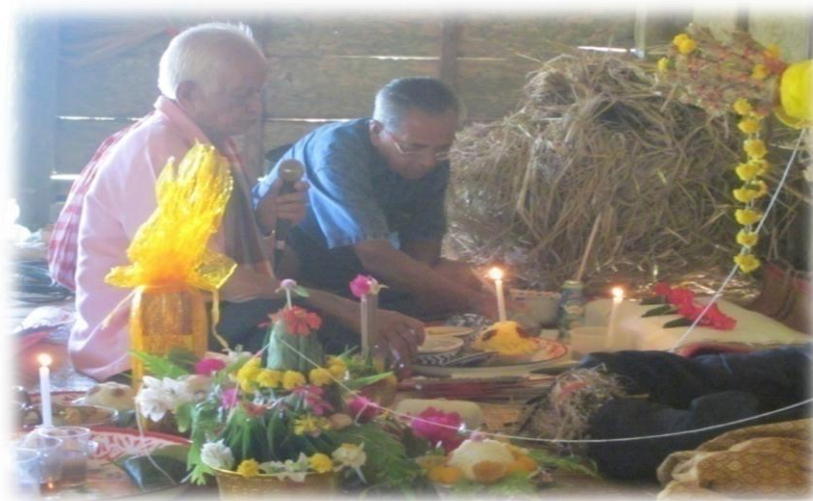
ภาพที่ 21 ครูหมอผู้ทำพิธีและผู้ช่วยครูหมอ

“การประกอบพิธีนั้นต้องอาศัยการเข้าใจในขั้นตอนต่าง ๆ คนที่เคยเข้าร่วมพิธีมาก่อนจะคอยแนะนำให้กับคนรุ่นหลัง ๆ ว่าต้องทำอะไรถึงจะถูกต้อง เพราะถ้าทำผิดกระบวนการผิดขั้นตอนก็อาจจะทำให้ไม่สบายใจว่าไม่ประสบความสำเร็จ” (พร้อม จินเตียง, สัมภาษณ์วันที่ 15 พ.ค. 58)