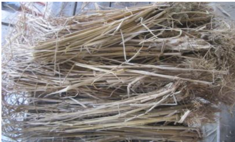
ภาพที่ 7 ซึ่งข้าวแต่ละแปลงนาที่นำมามัดรวมทำหุ่นฟาง ที่มา : ถ่ายโดยผู้วิจัยวันที่ 18 พฤษภาคม 2557

“หุ่นนั้น จะเป็นหัวใจหลักของการประกอบพิธี” (เชื้อ แม่นย่า, สัมภาษณ์วันที่ 20 เม.ย. 58)