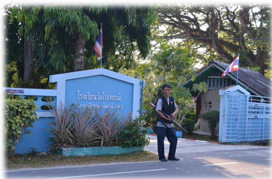
ภาพที่ 6 การรักษาความปลอดภัยของชุดรักษาความสงบหมู่บ้าน (ชรบ.)