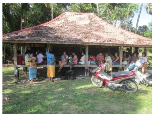
ภาพที่ 5 หุ่นฟางที่เตรียมประกอบพิธี และภาพที่ 6 ศาลากลางทุ่งนา สถานที่ประกอบพิธี