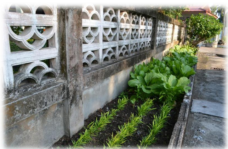
ภาพที่ 29 อาชีพเสริมหลังจากว่างเว้นจากทำนาของคนในชุมชน