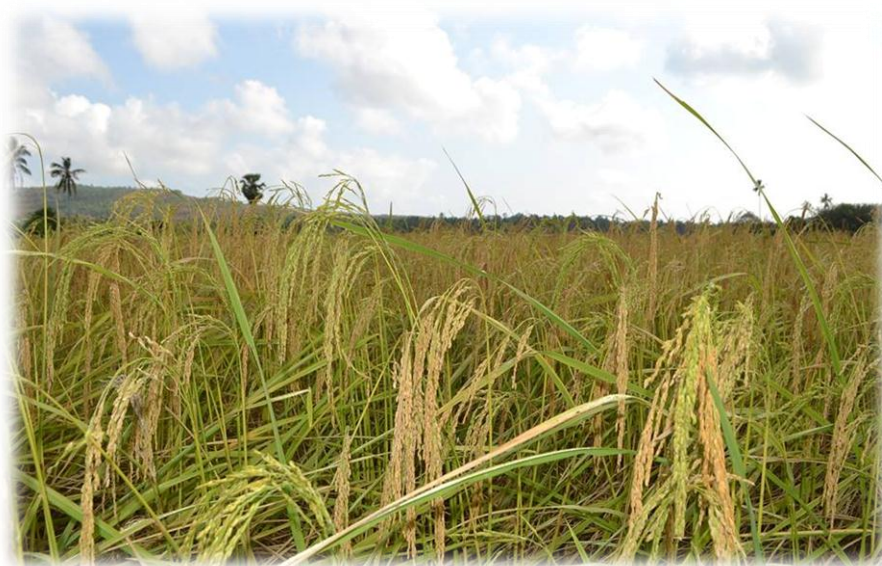
ภาพที่ 5 บริเวณทุ่งนาในชุมชนตราระแก่น ที่มา : ถ่ายโดยผู้วิจัยวันที่ 10 กุมภาพันธ์ 2557

ในอดีตการประกอบพิธีกรรมลาซังเกิดขึ้นจากการประกอบอาชีพทำนา เพื่อให้เกิดความเป็นสิริมงคลกับคนที่ทำนาในพื้นที่ชายแดนภาคใต้ การประกอบพิธีกรรมลาซังในอดีต เป็นการแสดงความเคารพบูชาต่อเทพเจ้าประจำนาข้าว ที่หล่อเลี้ยงคนในชุมชนให้มีชีวิตรอดมาได้