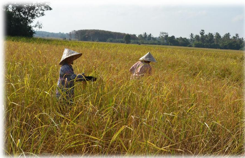
ภาพที่ 4 คนในชุมชนตราระแก่นประกอบอาชีพทำนา