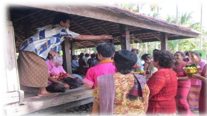
ภาพที่ 17 ขบวนขันหมากเดินทางมาถึงศาลากลางทุ่งนา สถานที่ประกอบพิธีกรรม

“พวกเราจะตื่นแต่เช้า ไปเตรียมที่เตรียมทางที่จะทำพิธี ส่วนพวกผู้หญิงเขาก็แต่งตัวสวย ทำผม นุ่งผ้าไหม งาม ๆ ร่วมขบวนแห่ขันหมากฝ่ายเจ้าบ่าว พวกคนเฒ่า คนแก่ก็ไปรออยู่ศาลากลางทุ่งนา อยู่ฝ่ายเจ้าสาว” (ประเทือง แดงวิไล, สัมภาษณ์วันที่ 4 มี.ค. 57)