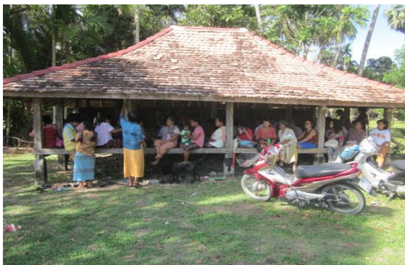
ภาพที่ 14 ศาลากลางทุ่งนา สถานที่ประกอบพิธี