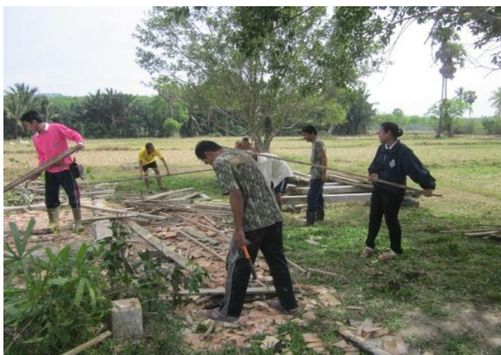
ภาพที่ 25 ผู้วิจัยร่วมกิจกรรมการซ่อมบริเวณด้านข้างศาลากลางทุ่งนา