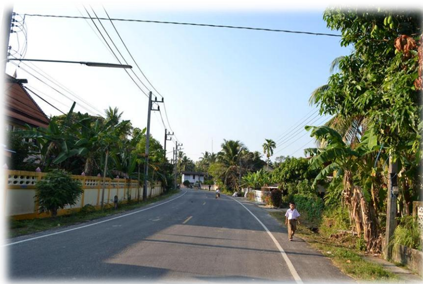
ภาพที่ 2 ภูมิทัศน์ภายในชุมชนเตราะแก่น