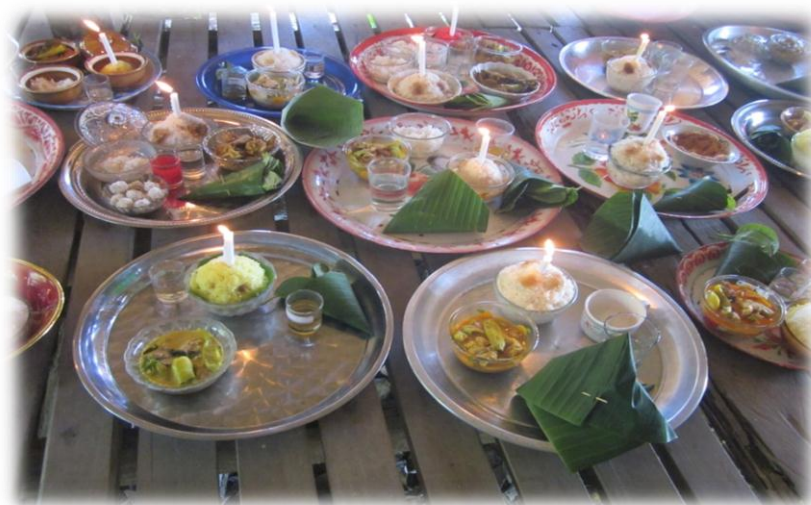
ภาพที่ 19 เครื่องสังเวยหุ่นฟางเจ้าป่าว – เจ้าสาว