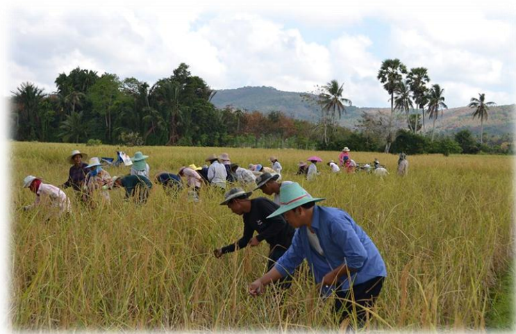
ภาพที่ 24 การลงแขกเกี่ยวข้าวของคนในชุมชนเตราะแก่น