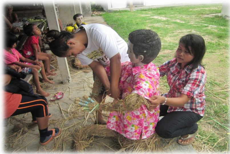
ภาพที่ 11 การสวมเสื้อผ้าให้หุ่นฟาง