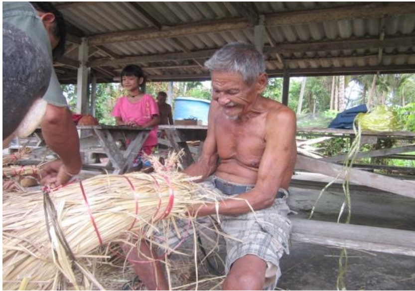
ภาพที่ 10 การนำซึ่งข้าวของทุกคนมามีตรวมกัน ที่มา : ถ่ายโดยผู้วิจัยวันที่ 18 พฤษภาคม 2557