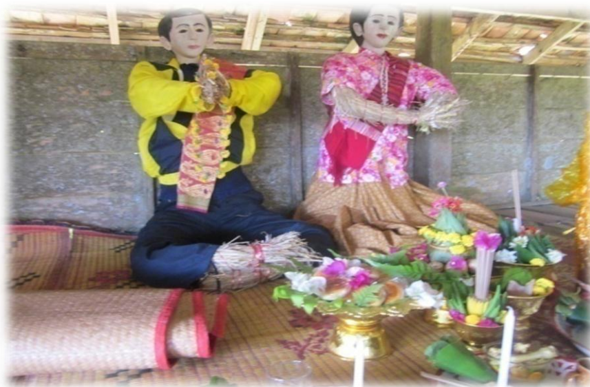
ภาพที่ 18 การจัดวางหุ่นฟางเจ้าบ่าว – เจ้าสาว ในการประกอบพิธีกรรม

“สอนให้รู้บุญคุณของพระแม่โพสพ บุญคุณบรรพบุรุษ ที่ทำนามีข้าวให้พวกเรา กิน เมื่อแต่งงานให้หุ่นฟางแล้วก็นำเครื่องสังเวยที่แต่ละครัวเอามา หยิบอย่างละชนิดใส่กระทงใบตองไปวางในแปลงนา และนำไปไหว้เจ้าที่เจ้าเรือนที่บ้านกัน” (สุณี ไกรดำ, สัมภาษณ์วันที่ 4 มี.ค. 57)