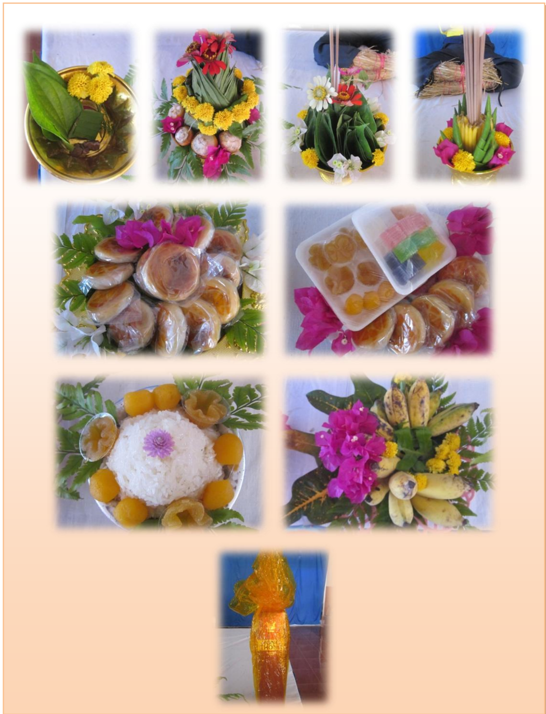
ภาพที่ 16 สิ่งของที่นำมาใส่ในขันหมาก