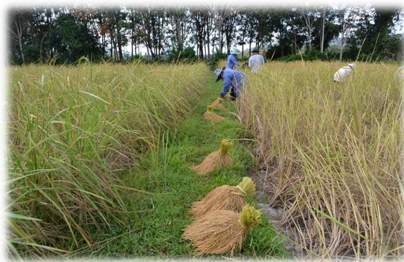
ภาพที่ 28 ผลผลิตจากการทำนา ที่มา : ถ่ายโดยผู้วิจัยวันที่ 23 กุมภาพันธ์ 2557