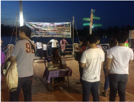
ภาพที่ 13 เมื่อวันที่ 8 พฤษภาคม 59

สถานที่จำหน่ายตัวชมหิ่งห้อยแม่น้ำตาปี หมายเหตุ สำหรับภาพถ่ายในการลงเรือดูหิ่งห้อย ไม่สามารถนำมาลงได้เนื่องจากท้องฟ้ามีตมามากไม่ สามารถถ่ายได้ เนื่องจากหากใช้แฟลตแล้ว หิ่งห้อยอาจจะเป็นหมันได้