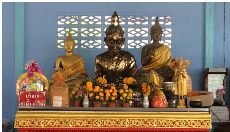
ภาพที่ 4.3 หลวงพ่อข้าวสุก