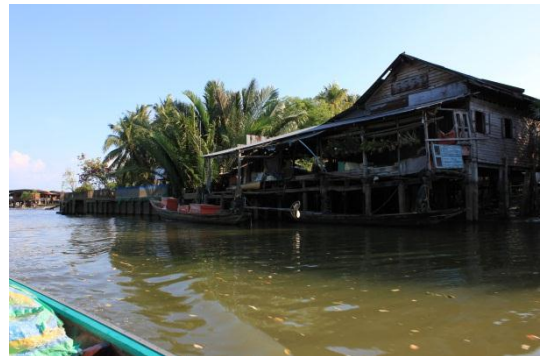
ภาพที่ 4 เมื่อวันที่ 9 พฤษภาคม 59 บ้านเรือนทุกหลังจะมีท่อน้ำและเรือทุก บ้านเพื่อใช้เป็นพาหนะในการเดินทาง