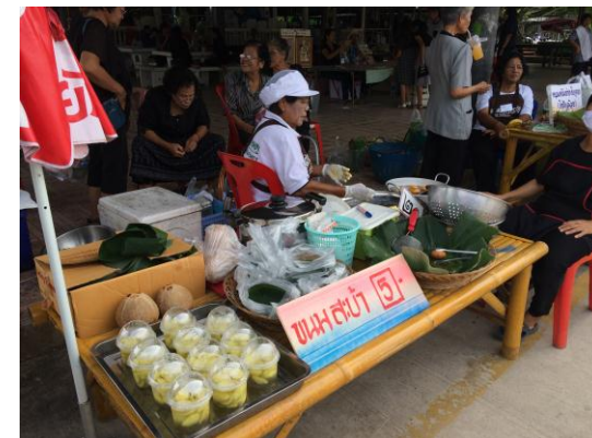
ภาพที่ 18 เมื่อวันที่ 16 ตุลาคม 2559