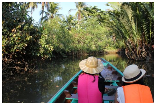
ภาพที่ 10 เมื่อวันที่ 9 พฤษภาคม 59 สภาพแวดล้อมในพื้นที่ตำบลบางโป้ไม้