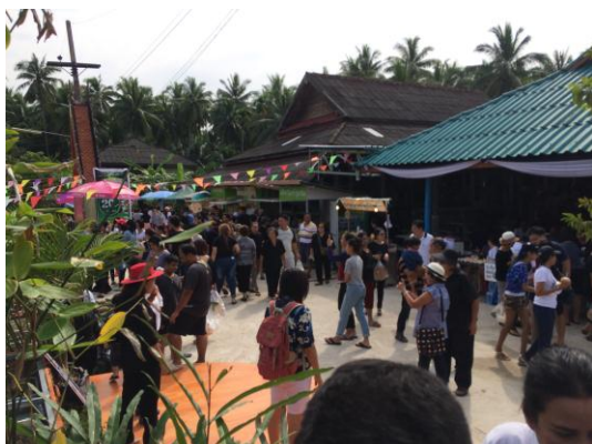
ภาพที่ 21 เมื่อวันที่ 16 ตุลาคม 2559 นักท่องเที่ยวเข้ามาติดต่อซื้อตัวลงเรือ เพื่อล่องเรือชมวิถีชีวิตชาวบ้านตำบลบางไผ่