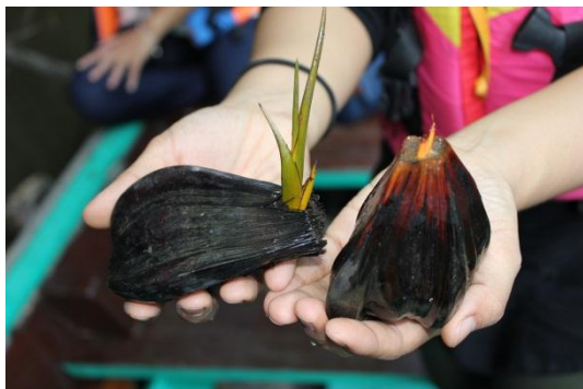
ภาพที่ 7 เมื่อวันที่ 9 พฤษภาคม 59 ต้นจากที่กำลังงอกต้นอ่อน