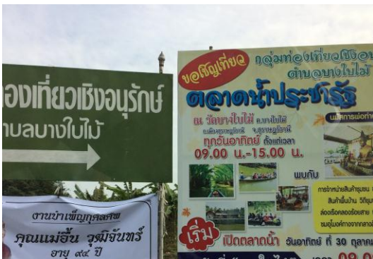
ภาพที่ 15 เมื่อวันที่ 16 ตุลาคม 2559