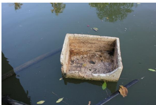
ภาพที่ 11 เมื่อวันที่ 9 พฤษภาคม 59 เกิดขยะมูลฝอยไปติดตามพื้นที่ต่างๆ