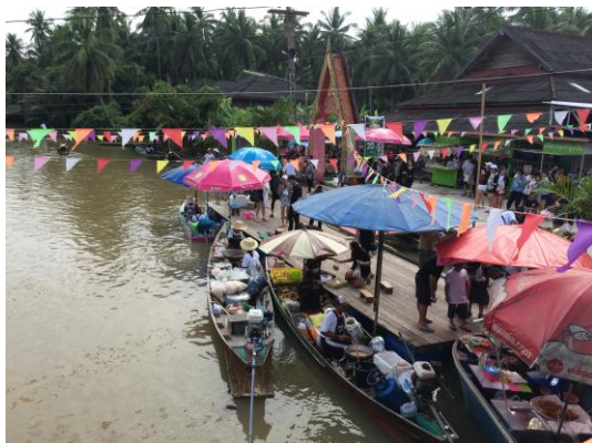
ภาพที่ 19 เมื่อวันที่ 16 ตุลาคม 2559 บรรยากาศตลาดน้ำประชารัฐบางไผ่ มีการจำหน่ายอาหารบนเรือ