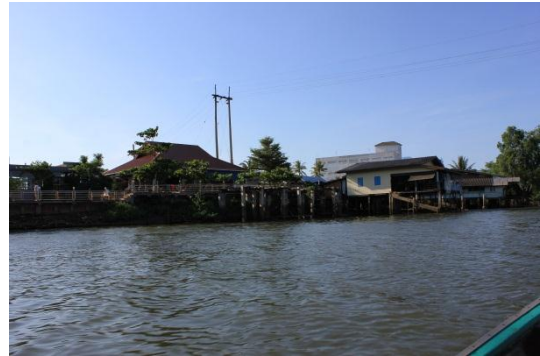
ภาพที่ 2 เมื่อวันที่ 9 พฤษภาคม 59 บ้านเรือนที่อาศัยอยู่ริมแม่น้ำตาปี บริเวณพื้นที่ตำบลบางไผ่ จังหวัดสุราษฎร์ธานี