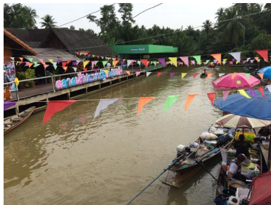
ภาพที่ 17 เมื่อวันที่ 16 ตุลาคม 2559

บริเวณพื้นที่หน้าตลาดน้ำประชารัฐ บางโป้ไม้