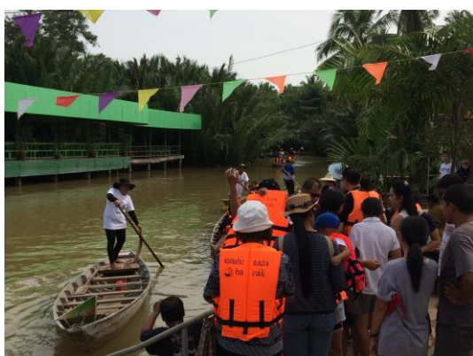
ภาพที่ 23 เมื่อวันที่ 20 พฤศจิกายน 2559 นักท่องเที่ยวรอลงเรือ โดยจะมีการให้ นักท่องเที่ยวใส่ชูชีพ เพื่อความปลอดภัย