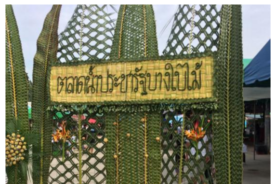
ภาพที่ 16 เมื่อวันที่ 16 ตุลาคม 2559

บริเวณพื้นที่หน้าตลาดน้ำประชารัฐ บางโป้ไม้