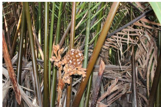
ภาพที่ 8 เมื่อวันที่ 9 พฤษภาคม 59 ลูกจาก สามารถกินสดจากต้นได้