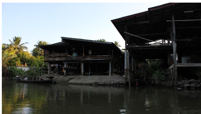
ภาพที่ 4.1 สภาพบ้านเรือนในชุมชนบางใบไม้ ที่มา : จากการลงพื้นที่สำรวจและเก็บข้อมูลจากตำบลบางใบไม้ โดย นางสาวกรรณก เกิดสังข์ เมื่อวันที่ 9 พฤษภาคม 2559

1.3.4 สภาพชีวิตความเป็นอยู่ ความสัมพันธ์ของคนในชุมชนดั้งเดิมเป็นอย่างไร มีการเปลี่ยนแปลงไปอย่างไร ผลการสัมภาษณ์พบว่า ชุมชนบางใบไม้เป็นชุมชนเก่าแก่เริ่มแรกของชาวในบางมีประวัติความเป็นมายาวนานกว่า 200 ปี สภาพวิถีชีวิตของชุมชนก่อนและหลังการเข้ามาของการท่องเที่ยวไม่มีการเปลี่ยนแปลงมากนัก โดยส่วนใหญ่แล้วประชาชนในพื้นที่ก็ยังใช้ชีวิตประจำวันเหมือนเดิมและยังคงมีความสัมพันธ์กับคนในชุมชนเหมือนเดิม และยังคงอนุรักษ์บ้านเรือนแบบเดิมไว้ ซึ่งสภาพของชุมชนบางใบไม้ในปัจจุบันแสดงได้ดังภาพที่ 4.1