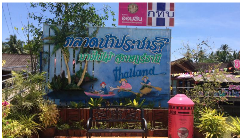
ภาพที่ 4.5 ตลาดน้ำประชารัฐบางไผ่ ที่มา : จากการลงพื้นที่สำรวจและเก็บข้อมูลจากตำบลบางไผ่ โดย นางสาวกรรณก เกิดสังข์ เมื่อวันที่ 16 ตุลาคม 2559

2.5.2 นมัสการพ่อท่านข้าวสุกซึ่งคนเฒ่าคนแก่เล่ากันว่าเกิดจากพระรูปหนึ่งที่น่าไม้จันทน์ลงอักขระเป็นแกนกลางองค์พระและนำข้าวสุกที่เหลือจากการฉันแล้วมาปั้นขึ้นเป็นองค์พระเพื่อเป็นที่ยึดเหนี่ยวและศรัทธารวมจิตใจของพุทธศาสนิกชนละแวกนั้นต่อมามีการสร้างพระทองเหลืองหุ้มหลวงพ่อบ้างแล้วแต่ไม่มีความวิเศษเหมือนองค์เดิมให้เห็นเลย ดังภาพที่ 4.6