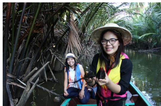
ภาพที่ 6 เมื่อวันที่ 9 พฤษภาคม 59 ลูกจากที่หล่นลงน้ำและแตกต้นอ่อน ขยายพันธุ์ต่อไป