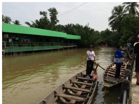
ภาพที่ 22 เมื่อวันที่ 20 พฤศจิกายน 2559 เรือสำหรับพานักท่องเที่ยวชมวิถีชีวิต สองฝั่งคลองตำบลบางไผ่ จำเป็นเรือแจว