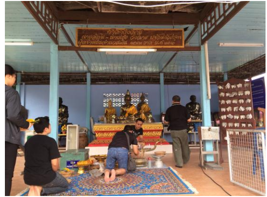
ภาพที่ 26 เมื่อวันที่ 20 พฤศจิกายน 2559 นักท่องเที่ยวไว้สักการะและนมัสการ พ่อท่านข้าวสุก