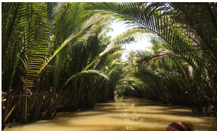
รูปที่ 4.4 เส้นทางเรือในพื้นที่บางใบไม้

ส่วนเรือแจวใช้เพื่อบริการนักท่องเที่ยวในการล่องเรือชมหิ่งห้อย และล่องเรือชมวิถีชีวิตชุมชน โดยเส้นทางเรือในชุมชน บางใบไม้ แสดงได้ดังรูปที่ 4.4