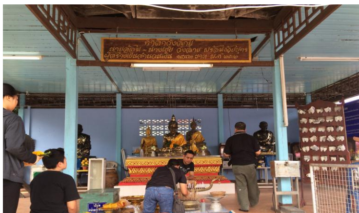
ภาพที่ 4.6 กิจกรรมนมัสการพ่อท่านข้าวสุก

2.5.2 นมัสการพ่อท่านข้าวสุกซึ่งคนเฒ่าคนแก่เล่ากันว่าเกิดจากพระรูปหนึ่งที่น่าไม้จันทน์ลงอักขระเป็นแกนกลางองค์พระและนำข้าวสุกที่เหลือจากการฉันแล้วมาปั้นขึ้นเป็นองค์พระเพื่อเป็นที่ยึดเหนี่ยวและศรัทธารวมจิตใจของพุทธศาสนิกชนละแวกนั้นต่อมามีการสร้างพระทองเหลืองหุ้มหลวงพ่อบ้างแล้วแต่ไม่มีความวิเศษเหมือนองค์เดิมให้เห็นเลย ดังภาพที่ 4.6