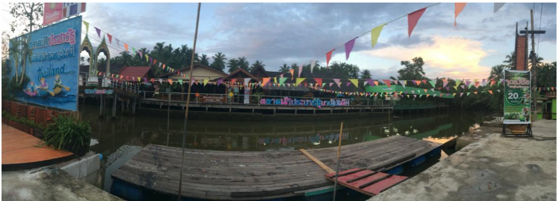
ภาพที่ 27 เมื่อวันที่ 20 ธันวาคม 2559 ภาพบรรยากาศตลาดน้ำประจักษ์ตำบลบางโป้ไม้ อำเภอเมือง จังหวัดสุราษฎร์ธานี