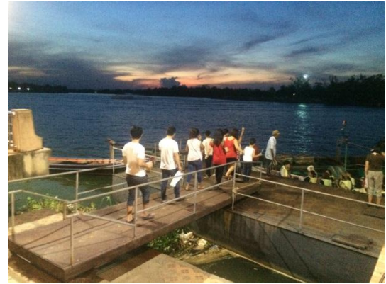
ภาพที่ 14 เมื่อวันที่ 8 พฤษภาคม 59

สถานที่จำหน่ายตัวชมหิ่งห้อยแม่น้ำตาปี หมายเหตุ สำหรับภาพถ่ายในการลงเรือดูหิ่งห้อย ไม่สามารถนำมาลงได้เนื่องจากท้องฟ้ามีตมามากไม่ สามารถถ่ายได้ เนื่องจากหากใช้แฟลตแล้ว หิ่งห้อยอาจจะเป็นหมันได้