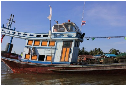
ภาพที่ 3 เมื่อวันที่ 9 พฤษภาคม 59 เรือประมงสำหรับหากุ้ง หอย ปู ปลา ของ คนในชุมชนเพื่อนำไปประกอบอาหารและขาย