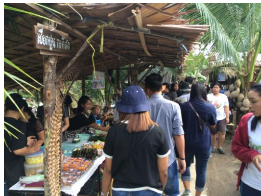
ภาพที่ 20 เมื่อวันที่ 16 ตุลาคม 2559 นักท่องเที่ยวเข้ามาจับจ่ายซื้ออาหาร อาหารภายในตลาด