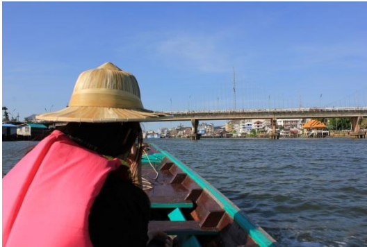
ภาพที่ 1 เมื่อวันที่ 9 พฤษภาคม 59 ลงเรือจากท่าเรือริมฝั่งแม่น้ำตาปีโดยเรือ ของพี่ต๋อยเพื่อเดินทางไปชมบรรยากาศของพื้นที่ ตำบลบางไผ่ จังหวัดสุราษฎร์ธานี