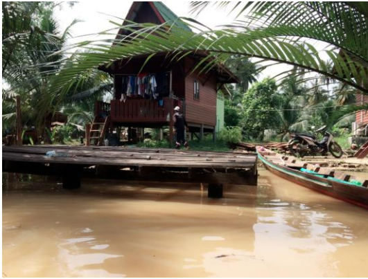
ภาพที่ 25 เมื่อวันที่ 20 พฤศจิกายน 2559 บ้านเรือนของชาวบ้านตำบลบางโป้ไม้ ที่อาศัยอยู่บริเวณสองฝั่งคลอง แต่หลังจะมีทำ น้ำเพื่อเทียบเรือไว้คมนาคม