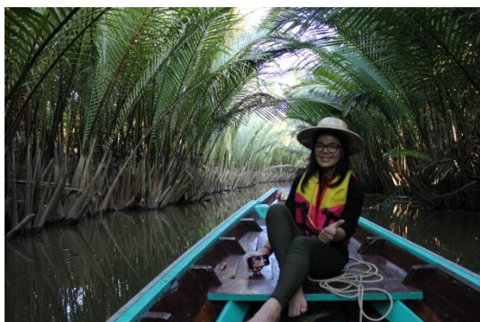
ภาพที่ 9 เมื่อวันที่ 9 พฤษภาคม 59 ต้นจากสองข้างทางโค้งชนกันสวยงาม