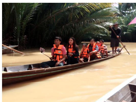
ภาพที่ 24 เมื่อวันที่ 20 พฤศจิกายน 2559 นักท่องเที่ยวล่องเรือแจว ชมความวิถี ชีวิตและความงดงามของอุโมงค์จาก