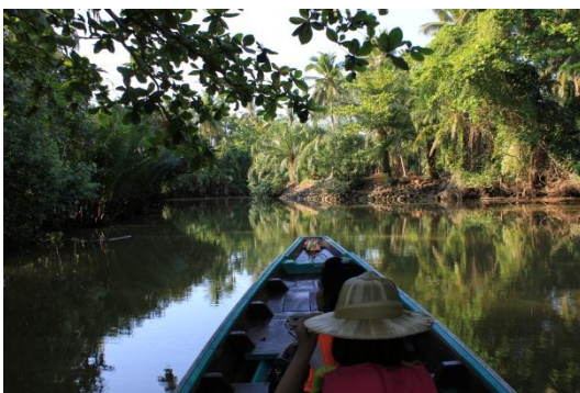
ภาพที่ 5 เมื่อวันที่ 9 พฤษภาคม 59 สองฝั่งคลองเต็มไปด้วยต้นจาก ต้นลำพู เพื่อต้นโกงกาง ต้นเหียงกลาหมอ เป็น