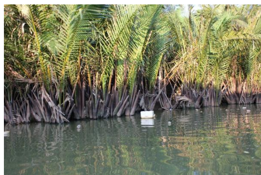
ภาพที่ 12 เมื่อวันที่ 9 พฤษภาคม 59 ขยะมากมาย เช่น พลาสติก โฟม เริ่มทำให้แม่น้ำเกิดการเน่าเสีย