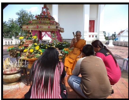
ภาพที่ 1: พระสงฆ์สวดมนต์ให้พรและประพรหมน้ำมนต์แก่ผู้มาทำพิธีสะเดาะเคราะห์ เมื่อวันที่ 1 มกราคม พ.ศ. 2559

นอกจากนี้ในงานจะมีเวทีการแสดงดนตรี ชุมนำเสนอผลผลิตสินค้าชุมชนจากศูนย์การเรียนรู้ชุมชนการทำเกษตรแบบทฤษฎีใหม่ตามแนวทางพระราชดำริ และการร่วมทำบุญสะเดาะเคราะห์ที่แพบริเวณหน้าพระอุโบสถ ผู้หญิงช่วยกันจัดทำช่อดอกไม้สำหรับใช้ในพิธีกรรม ผู้ชายช่วยกันเตรียมสถานที่ และอีกบางส่วนทั้งหญิงและชายช่วยกันหุงหาอาหารในโรงครัว นอกจากนี้ยังมีญาติพี่น้องที่อยู่นอกชุมชนทั้งต่างจังหวัดและภายในจังหวัด บุคคลทั่วไปเดินทางมาร่วมงานนี้ ได้เข้าไปสวดมนต์ขอพรที่แพสะเดาะเคราะห์โดยมีพระสงฆ์ประพรหมน้ำมนต์ (ดูภาพที่ 1)