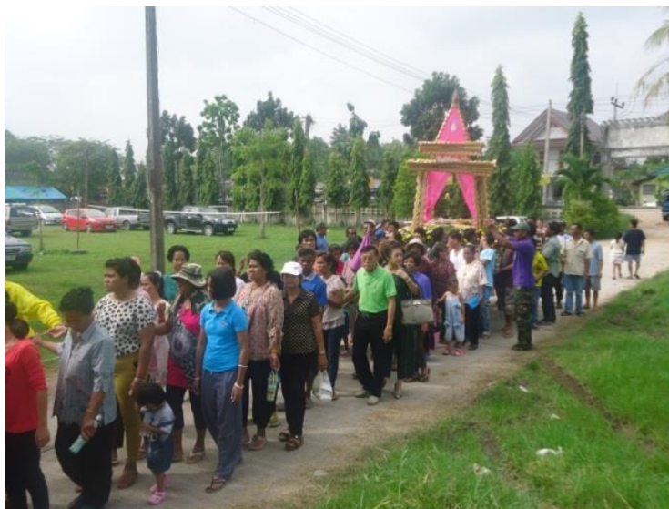
ภาพที่ 2 : ขบวนแห่ของชาวตะเคียนชะเมาที่มุ่งมั่นส่งเภาลงสู่ทะเลสาบสงขลาเพื่อลอยทุกข์โศกและ สิ่งชั่วร้ายออกไปจากหมู่บ้านของตนที่วัดวาริปาโมกษ์ ในวันที่ 31 ธันวาคม 2558- วันที่ 1 มกราคม 2559 (ถ่ายภาพเมื่อวันที่ 1 มกราคม พ.ศ. 2559)