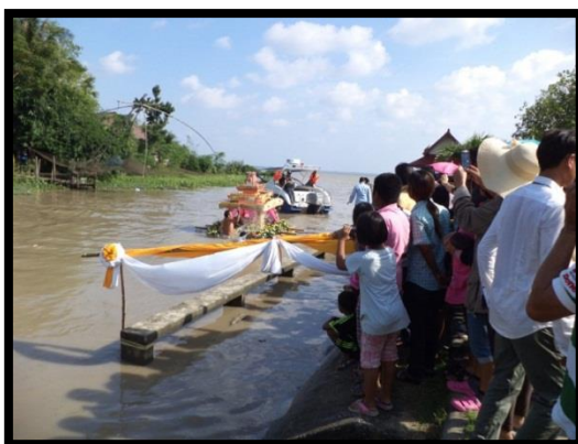
ภาพที่ 3 : ชาวตะเคียนะส่งแพสะเดาะเคราะห์ออกสู่ทะเลอ่าวไทย เพื่อปล่อยความทุกข์และโรคร้าย ไข้เจ็บออกไปจากชีวิต เมื่อวันที่ 1 มกราคม 2559