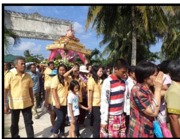
ภาพที่ 2 : ขบวนแห่แพสะเดาะเคราะห์ของชาวตะเคียนะ อำเภอระโนด จังหวัดสงขลา เมื่อวันที่ 1 มกราคม พ.ศ. 2559

เมื่อเวลา 13.00 น. สมาชิกองค์การบริหารส่วนตำบล ผู้ใหญ่บ้าน และแกนนำชุมชนทำการต้อนรับประธานในพิธีคือ นายนิพนธ์ บุญญามณี นายกองค์การบริหารส่วนจังหวัดสงขลา พร้อมด้วยการแสดงจากคณะกลองยาว อีกทั้งพระสงฆ์นั่งประจำที่แพสะเดาะเคราะห์ทำการสวดมนต์ หลังจากพิธีการบนเวทีเสร็จสิ้น ชาวตะเคียนะจัดเตรียมขบวนแพสำหรับแห่เวียนรอบโบสถ์หนึ่งครั้งก่อนจะส่งแพออกสู่ทะเล พร้อมทั้งความสนุกสนานครื้นเครงที่เกิดขึ้นจากการบรรเลงของดนตรีกลองยาว การโห่ร้องรำรำ เปิดโอกาสให้ชาวตะเคียนะได้ปลดปล่อยความทุกข์ที่สะสม ผสมผสานกับเสียงหัวเราะที่ได้แสดงออกมาในขณะที่มีการแห่ขบวนแพ (ดูภาพที่ 2)