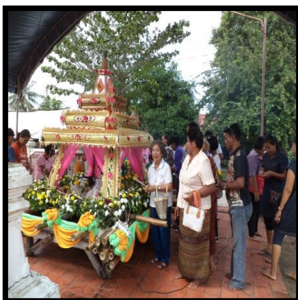
ภาพที่ 5 : แพนสะเดาะเคราะห์ของชาวตะเคียนชะเมา ตำบลตะเคียนชะเมา อำเภอรโนด จังหวัดสงขลา ในงานประเพณีลอยแพสะเดาะเคราะห์ เมื่อวันที่ 1 มกราคม พ.ศ. 2559