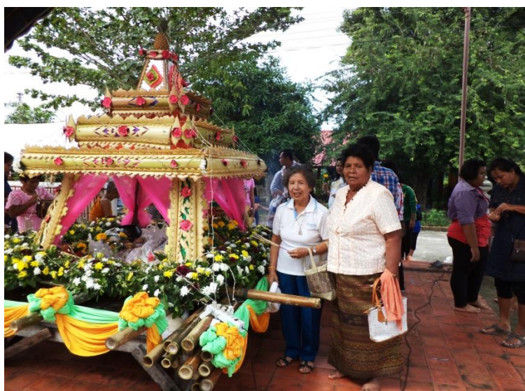
ภาพที่ 1 : เภาที่ใช้ในการประกอบพิธีกรรมส่งเภาของชาวตะเคียนะ ที่วัดวาริป่าโมกข์ ในวันที่ 31 ธันวาคม 2558-วันที่ 1 มกราคม 2559 (ถ่ายภาพเมื่อวันที่ 1 มกราคม พ.ศ. 2559)

หลังจากการบูชาเภาเสร็จเรียบร้อยแล้ว ในเวลา 15.00 น. มีการแห่เภาเวียนรอบอุโบสถ 3 รอบ เป็นสัญลักษณ์การบูชาอำนาจสิ่งศักดิ์สิทธิ์ และการบูชาพระพุทธรูปเจ้า มีการหยุดเพื่อทำการอธิษฐานจิตอีกครั้งก่อนที่จะส่งเภาลงสู่ทะเล พร้อมกับการตัดสายสัญญาณออกจากตัวเภา แจกจ่ายผู้เข้าร่วมการประกอบพิธีกรรม อันเป็นวัตถุมงคลที่ระลึกสร้างความเชื่อมั่นให้กับตนเองว่า หากใครได้สายสัญญาณเก็บไว้กับตัวเหมือนมีสิ่งศักดิ์สิทธิ์คอยปกป้องรักษา จากนั้นขบวนแห่กลองยาวเดินนำหน้าตามด้วยนางรำและประธานในพิธี และชาวตะเคียนะที่เป็นหญิงอาวุโสมัดถุงผ้าถุงและเสื้อลูกไม้ ส่วนวัยทำงานและวัยรุ่นแต่งกายตามความสะดวกของตนเอง เดินนำเภาไปยังท่าน้ำแล้วจึงปล่อยเภาลงสู่ทะเลสาบสงขลา ถึงแม้การส่งเภาจะสร้างขยะจากเศษถุงพลาสติกบ้าง แต่ในส่วนตัวเภาที่ทำจากกาบกล้วย ดอกไม้ ถ้าไม่ไฟ จะค่อยๆย่อยสลายไปตามกาลเวลา และกลายเป็นอาหารให้กับกุ้ง หอย ปู ปลาต่อไป