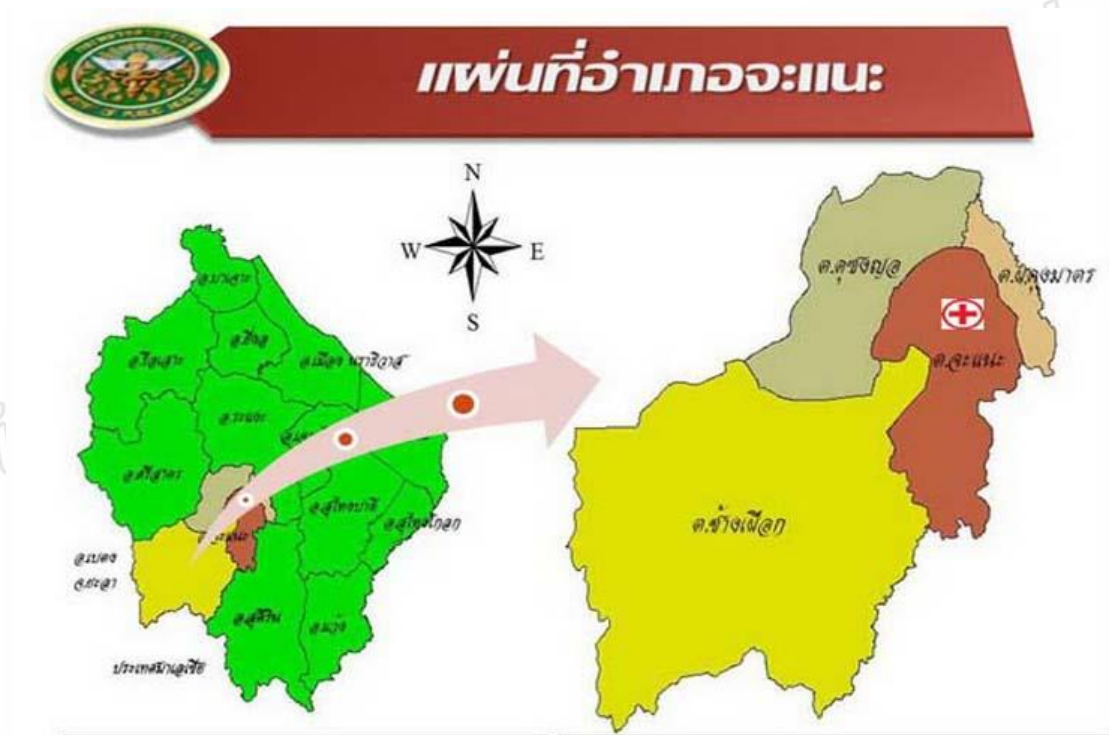
รูปภาพ 3.1 แผนที่อำเภोजะแนะ