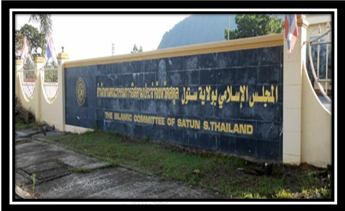
ภาพที่ 1 : สำนักงานคณะกรรมการอิสลามประจำจังหวัดสตูล ที่อยู่ : 282 ถ.ยন্ত্রการกำธร หมู่ 1 ต.ฉลุง อ.เมือง จ.สตูล 91140 โทรศัพท์ 074-799-338 โทรสาร 074-799-223