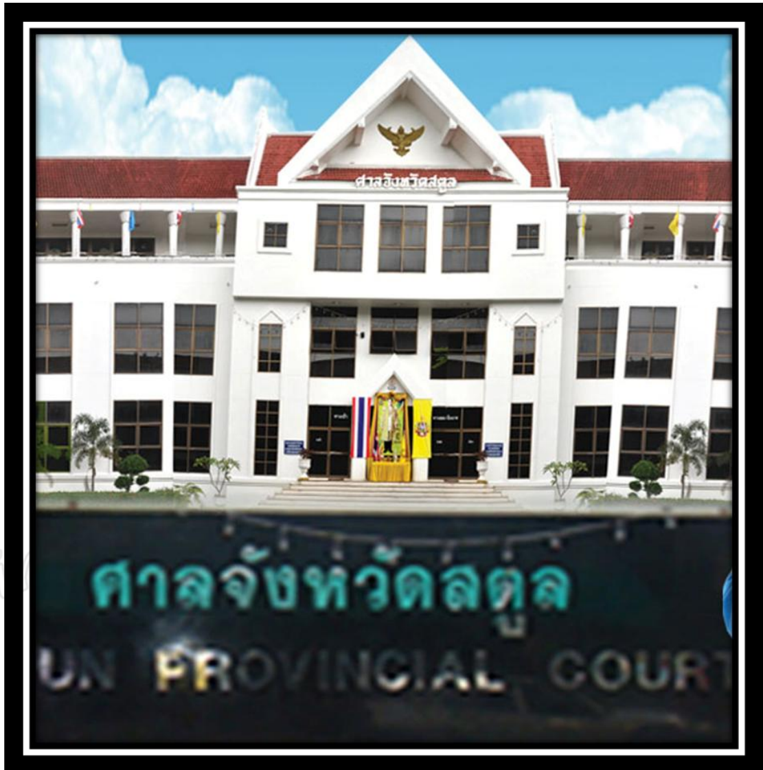
ภาพที่ 4 : ศาลจังหวัดสตูล ที่อยู่ : ถนนสินีวิถี ตำบลพิมาน อำเภอเมืองสตูล จังหวัด สตูล 91000