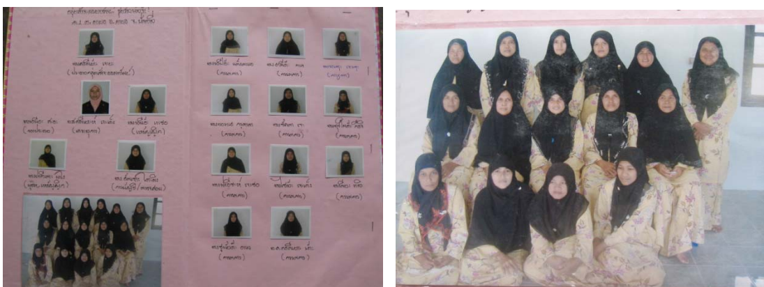
ภาพประกอบ 4 การรวมกลุ่มทำกิจกรรมของกลุ่มสัจจะออมทรัพย์ของชุมชนบ้านจ๊ะ