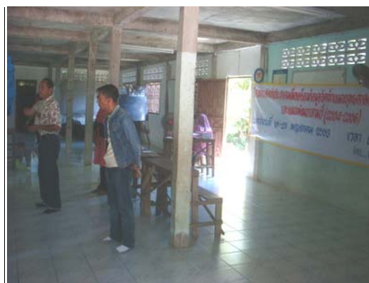
ภาพประกอบ 6 การมีส่วนร่วมของผู้นำชุมชนกับองค์กรปกครองส่วนท้องถิ่นในการพัฒนาชุมชน ที่มา : ถ่ายโดยผู้วิจัย เมื่อวันที่ 12 พฤษภาคม 2553