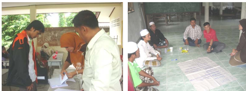
ภาพประกอบ 5 การมีส่วนร่วมของผู้นำชุมชนกับเทศบาลฯ

การมีส่วนร่วมในกระบวนการพัฒนาของชุมชนในการดำเนินกิจกรรมต่างๆ ยังพบข้อบกพร่องในเรื่องของการประสานงาน จึงทำให้การดำเนินการในบางกิจกรรมยังขาดการเข้าถึงในกิจกรรมนั้นๆ