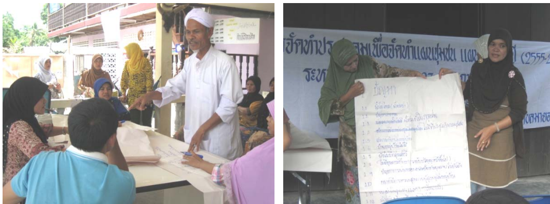
ภาพประกอบ 7 การมีส่วนร่วมของชุมชนกับองค์กรปกครองส่วนท้องถิ่น ในการร่วมกันจัดทำแผนที่ชุมชน เมื่อวันที่ 24 พฤษภาคม 2554

ดังนั้นจากข้อความที่กล่าวมาทำให้รู้ว่าทั้งทางภาครัฐและภาคประชาชนควรมีการสร้างหลักการมีส่วนร่วมเข้าด้วยกัน เพื่อให้ต่างฝ่ายได้รับรู้ถึงปัญหาและความต้องการไปพร้อมกัน ประชาชนก็จะได้มีส่วนร่วมมากยิ่งขึ้นในการทำกิจกรรมและการพัฒนาชุมชนของตนเองให้มีความเข้มแข็งมากยิ่งขึ้น เพราะการมีส่วนร่วมเป็นหลักประกันที่สำคัญที่จะทำให้ประชาชนทุกคนดำเนินชีวิตอยู่ในชุมชนได้อย่างยั่งยืน