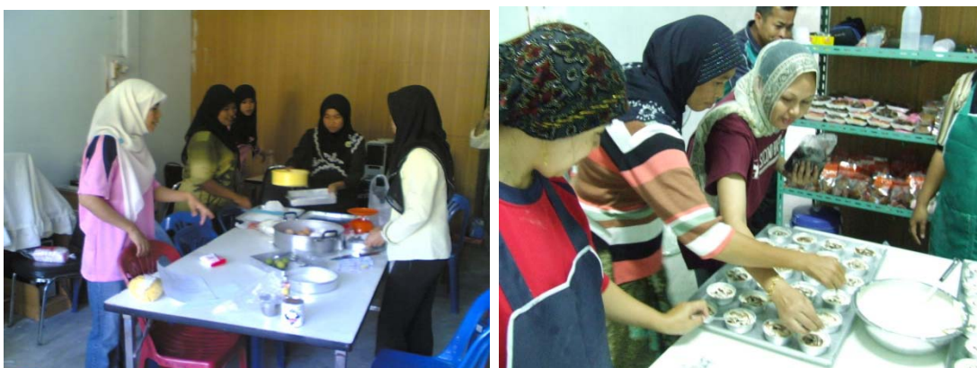
ภาพประกอบ 3 การรวมกลุ่มทำกิจกรรมของกลุ่มสตรีชุมชนมายอ

บทบาทการเป็นผู้บริหารจัดการ ผลการศึกษา พบว่า บทบาทของผู้นำชุมชนมีบทบาทที่คล้ายคลึงกัน กล่าวคือ เป็นผู้บริหารจัดการกลุ่ม เป็นผู้วางแผนและดำเนินการร่วมกับเทศบาล ด้วยความที่เป็นผู้ที่รู้จักปัญหาของชุมชน รู้วิธีจะพัฒนาชุมชนให้สอดคล้องกับสภาพแวดล้อมและวิถีชีวิตของชาวบ้านในชุมชน