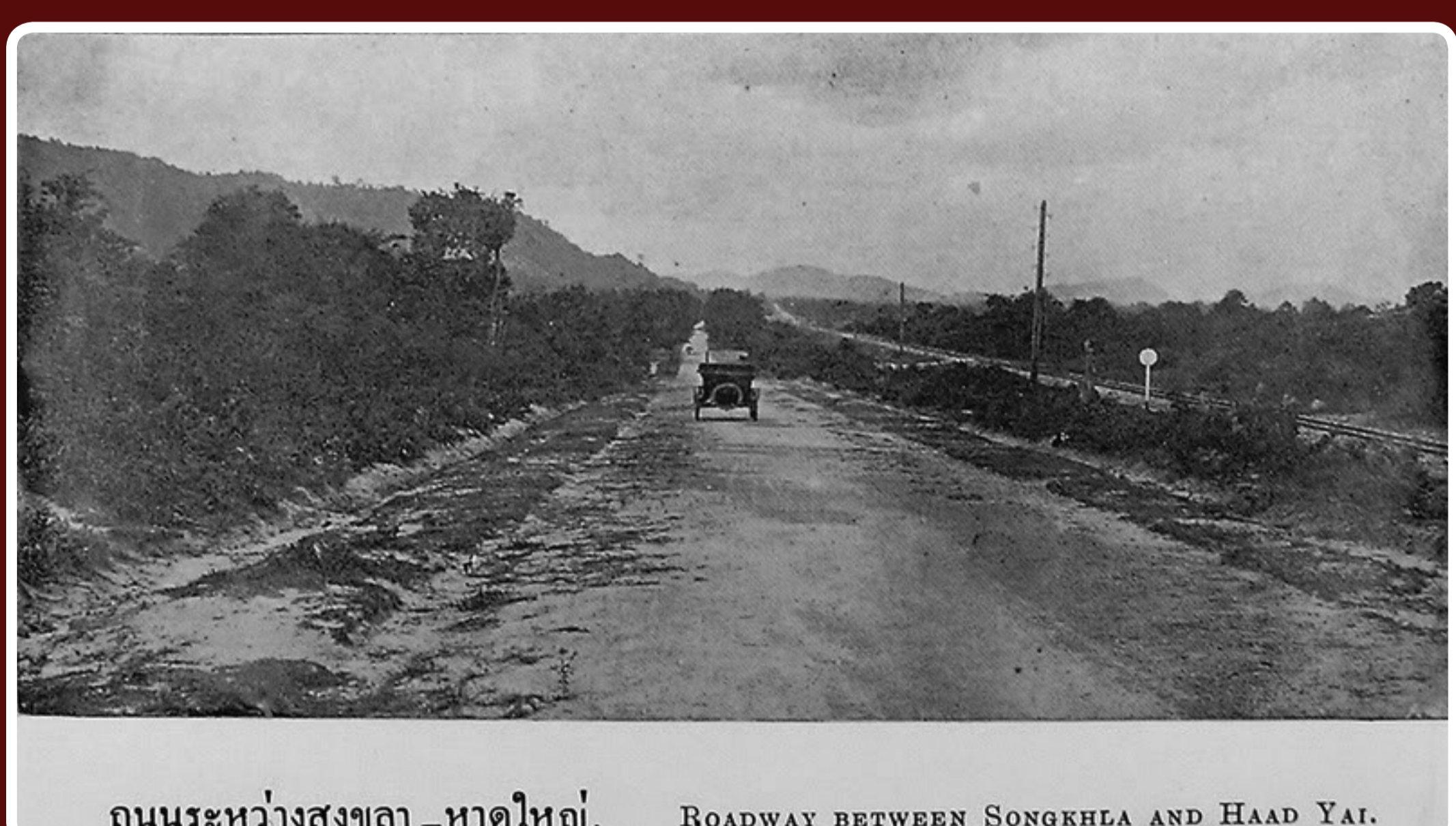
ถนนระหว่างสงขลา-หาดใหญ่. ROADWAY BETWEEN SONGKHLA AND HAAD YAI.

เป็นที่น่าสังเกตว่า ความหมายของคำว่า "หาดใหญ่" ทั้งสองกระแสถูกนำมาสัมพันธ์กับความเคลื่อนไหวในกิจกรรมทางเศรษฐกิจที่ดึงดูดผู้คนจากทั่วสารทิศเดินทางมาพบปะแลกเปลี่ยนซื้อขายสินค้ากัน ดังนั้นจึงถูกเรียกในความหมายและความเข้าใจในทั้งสองกระแส คือ หาดทรายขนาดใหญ่ในคลองอู่ตะเภา และต้นมะหาดขนาดใหญ่ริมคลองเคย ซึ่งบริเวณทั้งสองนี้อยู่ไม่ไกลจากกันมากนัก