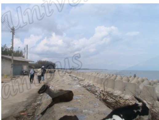
แหล่งที่อยู่อาศัยของหอยแมลงภู่