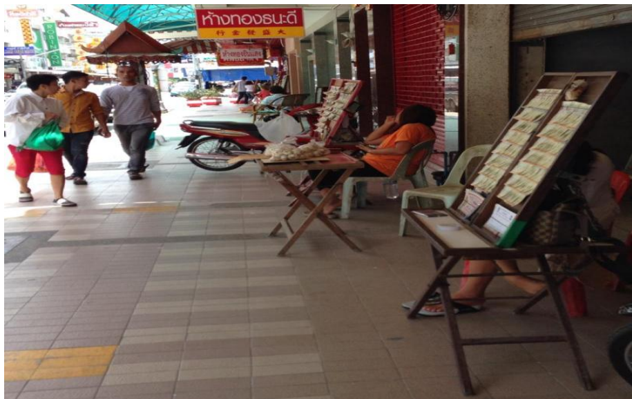
ภาพที่ 2 แสดงสถานที่และลักษณะการตั้งขายของรัฐของยี่ปั่วและผู้ค้าปลีกรายย่อย