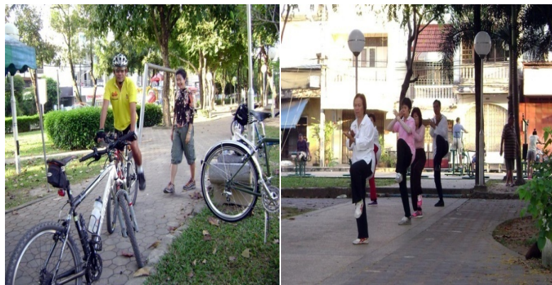
ภาพประกอบที่ 16 ชาวบ้านที่ออกกำลังกายในพื้นที่สวนหย่อมศุภสารรังสรรค์ 9 กันยายน 2554

จากข้อมูลข้างต้นของผู้ที่ใช้ประโยชน์จากบริเวณพื้นที่สวนหย่อมศุภสารรังสรรค์ สะท้อนให้เห็นถึงผลกระทบที่เกิดจากการประดิษฐ์พื้นที่สาธารณะให้กลายเป็นเทศกาลกินเจ ขนาดใหญ่ โดยใช้พื้นที่สวนหย่อมศุภสารรังสรรค์เพื่อจัดงานนั้นทำให้วิถีชีวิตของชาวบ้านที่ได้ใช้ประโยชน์อยู่เป็นประจำจากพื้นที่นี้ต้องเปลี่ยนแปลงไปเพียงชั่วคราว ซึ่งอาจส่งผลกระทบต่อรายได้ สุขภาพ แต่ถึงอย่างไรเมื่อมองในภาพรวมชาวบ้านที่ได้ใช้สอยประโยชน์จากพื้นที่แห่งนี้ก็มีความ ยินดีและเข้าใจ พร้อมทั้งจะให้ความร่วมมือกับเจ้าหน้าที่ ซึ่งถือว่าผลกระทบที่เกิดขึ้นนั้นเป็นเพียง เรื่องเล็กน้อยมากเมื่อเทียบกับสิ่งดีๆที่ตามมา