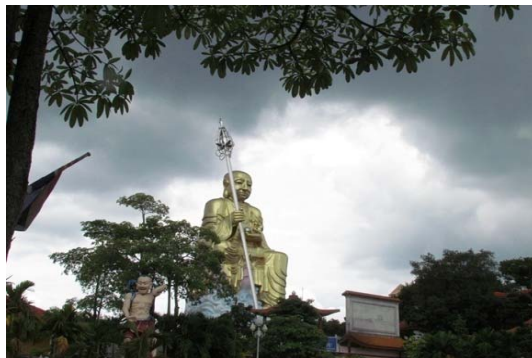
ภาพประกอบที่ 13 วัดถาวราราม หาดใหญ่