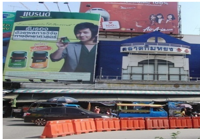
ภาพประกอบที่ 10 ตลาดกิมหยง