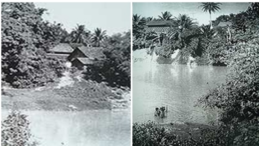
ภาพประกอบที่ 3 อำเภอฝายเหนือหรือหาคีใหญ่ในอดีต

สถานที่อันเป็นที่พักของคนเดินทางและผู้มาค้าขายแลกเปลี่ยนสินค้า คือ ศาลาลุงทอง ปัจจุบันก็ยังคงมีอยู่ซึ่งตั้งอยู่ฝั่งคลองด้านตะวันตกหรือที่เรียกกันทั่วไปว่า ท่าตก ด้านฝั่งตะวันออกเป็นตลาดหรือที่เป็นตลาดหาคีใหญ่เดิม ซึ่งเคยเป็นแหล่งค้าขายที่สำคัญ อาคารบ้านเรือนห้องแถวร้านค้าทั้งหลายก็ยังคงมีลักษณะดั้งเดิมปรากฏอยู่จนทุกวันนี้ ริมถนนในตลาดมีต้นมะเฟืองปลูกเรียงรายตลอดแนวสองฟากถนน ทุกวันนี้ต้นมะเฟืองดังกล่าวก็ยังคงมีให้เห็นอยู่หลายต้น (ถนนราษฎร์เสรี) ถัดจากตลาดหาคีใหญ่มีถนนเชื่อมต่อไปยังถนนสงขลา-ไทรบุรีออกที่บ้านคลองหวะ ถนนเส้นนี้ทางการให้ปลูกต้นประดู่สองข้างทางและกำหนดให้ราษฎรช่วยกันดูแลรับผิดชอบ ผู้ใดเพิกเฉยจะถูกโทษ ถ้าสังเกตดีๆ ปัจจุบันยังมีต้นประดู่เหลืออยู่บ้าง ถ้านับมาแต่สุดถนนสากรมงคล ประดู่ที่ถูกโค่นหลังสุดอยู่บริเวณใกล้สะพานรถไฟอุตะเกา ถัดมายังมีอยู่ที่กุโบร์หน้าโรงน้ำแข็ง และที่เกือบสุดถนนพลพิชัย บ้านเรือนดั้งเดิมที่ตลาดหาคีใหญ่ส่วนใหญ่เป็นอาคารไม้เสาเรือนส่วนใหญ่มักจะทำด้วยไม้มะหาด ซึ่งชี้ให้เห็นว่าบริเวณที่เรียกว่าหาคีใหญ่มีต้นมะหาดเป็นจำนวนมาก จากการสำรวจเส้นทางค้าทางน้ำ พบว่าชาวบ้านที่ลงไปหาปลาในคลองอุตะเกามักจะพบ เครื่องถ้วยชามในคลองบ่อยๆ อย่างที่บ้านบางศาลาได้พบเครื่องถ้วยชามจำนวนมาก ที่บ้านท่าโพธิ์พบถ้วยชามและ เงินตราเป็นเหรียญดีบุกเป็นเงินตราที่เมืองสงขลาทำขึ้นใช้เอง (พิชัย ศรีใส, 2549)