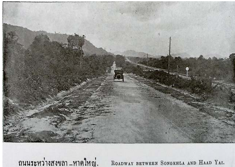
ถนนระหว่างสงขลา-หาดใหญ่. ROADWAY BETWEEN SONGKHLA AND HAAD YAI.

ภาพประกอบที่ 5 ถนนติดต่อระหว่าง สงขลา-ไทรบุรี สมัยพระบาทสมเด็จพระจอมเกล้าเจ้าอยู่หัว ที่มา: www.hatyai.com สืบค้นเมื่อ 18 กันยายน 2555