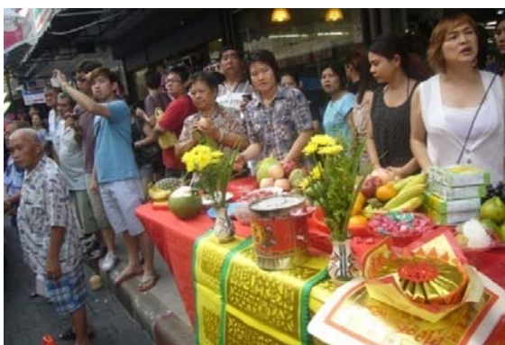
ภาพประกอบที่ 26 นักท่องเที่ยวตั้งโต๊ะเครื่องเล่นไหว้รับพระ ที่มา: ถ่ายโดยผู้วิจัย 2 ตุลาคม 2554

อย่างไรก็ตามการมารวมตัวกันของศาลเจ้าต่างๆ นอกจากจะเป็นผลต่อการท่องเที่ยวแล้วยังก่อให้เกิดความขัดแย้งตามมา ดังคำกล่าวที่ว่า