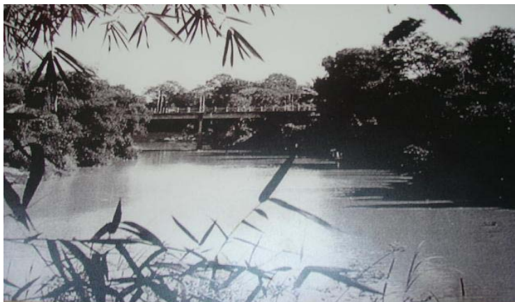
ภาพประกอบที่ 4 คลองอู่ตะเภาในอดีต ที่มา: www.hatyai.com สืบค้นเมื่อ 18 กันยายน 2555

สิ่งหนึ่งที่ทำให้ผู้วิจัยเห็นภาพของพื้นที่ขนาดใหญ่และเรื่องราวการใช้ชีวิตของผู้คนที่ผูกโยงกับสายน้ำ คือคำบอกเล่าของคุณลุงชูชาติ เตงเทศ ได้เล่าให้ฟังถึงการใช้ชีวิตของผู้คนในอดีตที่มีสายน้ำคลองอู่ตะเภาเป็นเสมือนเส้นเลือดหล่อเลี้ยงชีวิต ทั้งการสัญจรไปมา การค้าขายโดยใช้เรือ และยังเป็นแหล่งทำกิน พื้นที่ขนาดใหญ่มีสายน้ำหลายสายที่ตัดผ่าน เช่น คลองวาด คลองเคย คลองเรียน และคลองอู่ตะเภา แต่คลองอู่ตะเภาเป็นแม่น้ำสายหลักที่ใช้กันมาตั้งแต่อดีต เป็นสายน้ำจืดที่เมื่อก่อนคนขนาดใหญ่ใช้เพื่อทำการค้า การเดินทาง และอุปโภค บริโภค