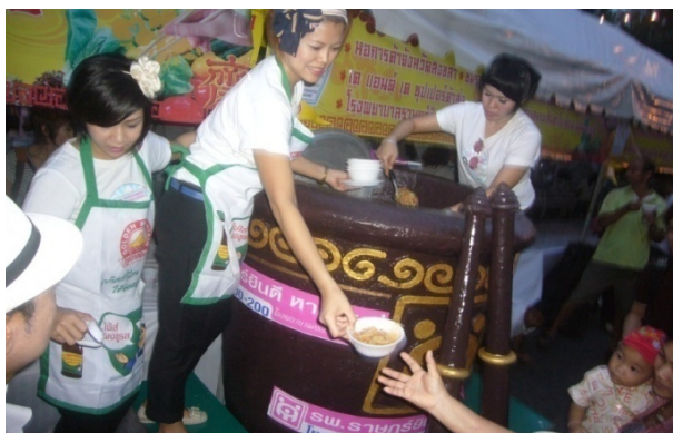
ภาพประกอบที่ 17 สัมภาษณ์ในครัชย์กัษที่หน่วงานเอกชนได้นำมาร่วมแจกจ่ายให้กับนักท่องเที๋ยว ที่มา: ถ่ายโดยผู้วิจัย 27 กันยายน 2554

จากการลงพื้นที่ของผู้วิจัยพบว่า กิจกรรมหลักของงานเทศกาลกินเจหาดใหญ่ นั้น จะเน้นการจัดกิจกรรมบนเวทีเพื่อสร้างความบันเทิงและการสอดแทรกความรู้ให้กับนักท่องเที่ยว และผู้ที่เข้าร่วมงาน ถึงแม้กิจกรรมบางอย่างอาจจะไม่ได้เป็นกิจกรรมที่เกี่ยวข้องอะไรกับ ประเพณีกินเจก็ตาม อาจเป็นเพียงกิจกรรมที่ต้องการจัดขึ้นมาเพื่อต้องการดึงดูดนักท่องเที่ยว ซึ่ง สอดคล้องกับคำสัมภาษณ์ ที่ว่า