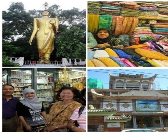
ภาพประกอบที่ 6 แสดงถึงความหลากหลายของกลุ่มคนในหาดใหญ่ 24 กันยายน 2555

จากภาพจะเห็นได้ว่าภายใต้พื้นที่เมืองหาดใหญ่ประกอบด้วยผู้คนที่หลากหลายทางชาติพันธุ์ ศาสนา ที่เข้ามาอยู่ในพื้นที่หาดใหญ่ เช่นพื้นที่ตลาดกิมหยงที่มีทั้งคนไทยเชื้อสายจีน คนมาลาญ คนไทยพุทธ และคนไทยมุสลิม ซึ่งบางส่วนก็เป็นคนที่อาศัยอยู่ในพื้นที่มาเป็นเวลานานแล้ว บางส่วนก็มีการอพยพเข้ามาในพื้นที่เพื่อการประกอบอาชีพ ดังนั้น จะเห็นได้ว่าพื้นที่หาดใหญ่เป็นพื้นที่จุดเชื่อมประสานระหว่างผู้คนที่มีความหลากหลายทางชาติพันธุ์ ซึ่งมาจากทั่วสารทิศทั้งภายในประเทศและจากต่างประเทศ ซึ่งชาวต่างชาติส่วนใหญ่จะเป็น ชาวจีน มาเลเซีย สิงคโปร์ และอินโดนีเซีย