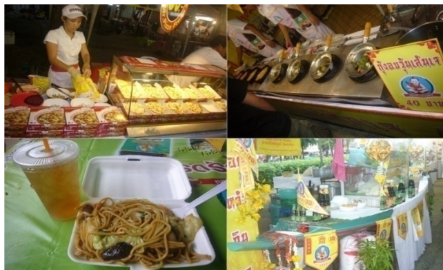
ภาพประกอบที่ 20 ตัวอย่างอาหารเจที่มีจำหน่ายภายในบริเวณงานเทศกาลกินเจหาดใหญ่ 29 กันยายน 2554

จากข้อความดังกล่าว จึงสะท้อนให้เห็นถึงความหลากหลายของอาหารเจ ที่มีการประดิษฐ์ขึ้นมา เป็นการสร้างสรรค์เมนูอาหารใหม่ๆ เพื่อเป็นจุดขายของแต่ละร้านและเป็นผลดีต่อผู้บริโภคที่มีทางเลือกในการหาอาหารเจรับประทานได้ง่าย และหลากหลาย ทำให้รู้สึกว่าการกินอาหารเจไม่ซ้ำซาก จำเจ เหมือนที่ผ่านมามากด้วย