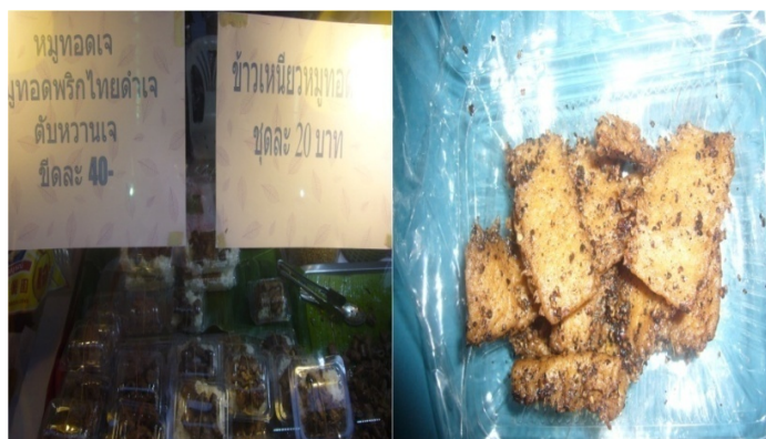
ภาพประกอบที่ 21 หมูทอดพริกไทยดำเจ อาหารเจเลียนแบบเนื้อสัตว์จริง 3 ตุลาคม 2554