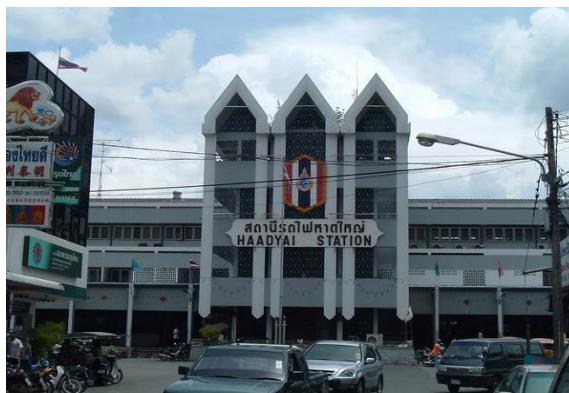
ภาพประกอบที่ 8 สถานีรถไฟหาดใหญ่ 24 กันยายน 2555