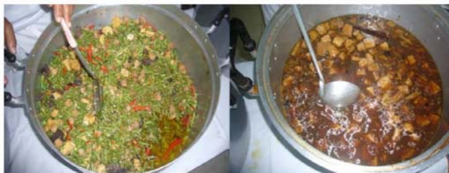
ภาพที่ 1 อาหารเจแบบดั้งเดิมในโรงเจของศาลเจ้าไฉชิงเอี้ย มีส่วนประกอบคือผักและเต้าหู้

ในส่วนของอาหารเจ ซึ่งถือว่าเป็นหัวใจหลักของเทศกาลกินเจ ในงานกินเจเมืองหาดใหญ่มีอาหารเจที่หลากหลายโดยรูปแบบและหน้าตาของอาหารแต่ละชนิดมีความสวยงาม แปลกตา เป็นที่สนใจของนักท่องเที่ยว อาหารเจบางชนิดที่นำมาจำหน่ายในงานเป็นอาหารที่มีรูปแบบและรสชาติที่ไม่แตกต่างกับอาหารที่ทำจากเนื้อสัตว์ เพื่อเป็นอีกจุดเพื่อดึงดูดนักท่องเที่ยวที่ไม่ชอบอาหารเจ แต่อยากทดลองกินเจ จึงทำให้ไม่รู้สึกรว่าอาหารเจไม่ได้แตกต่างจากอาหารทั่วไป