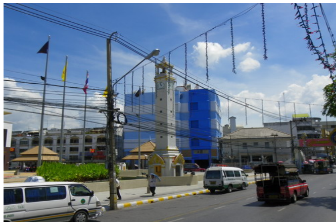
ภาพประกอบที่ 11 หอนาฬิกาหาดใหญ่ 24 กันยายน 2555

(ธรรมบุญ โกวิทยา, สัมภาษณ์ 28 กันยายน 2555)