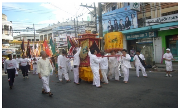
ภาพประกอบที่ 29 เกี้ยวใหญ่หรือตัวเหลียน เป็นที่ประทับของกั๋วอึ้งต่ายเต้ ที่มา: ถ่ายโดยผู้วิจัย 2 ตุลาคม 2554

จากคำสัมภาษณ์สะท้อนให้เห็นว่าพิธีกรรมแห่พระ ในเทศกาลกินเจหาดใหญ่จัดขึ้นมาเพื่อต้องการอนุรักษ์ประเพณีดั้งเดิมของชาวไทยเชื้อสายจีน และในยุคของสังคมผู้คนกำลังโหยหาบรรยากาศแบบดั้งเดิม การประดิษฐ์สร้างพิธีกรรมแห่พระขึ้นมาจึงตอบสนองความต้องการของผู้คนในสังคมเมืองได้เป็นอย่างดี ซึ่งสอดคล้องกับคำสัมภาษณ์ที่ว่า