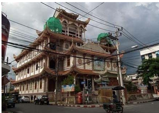
ภาพประกอบที่ 12 วัดฉือฉาง หาดใหญ่ 18 กันยายน 2555