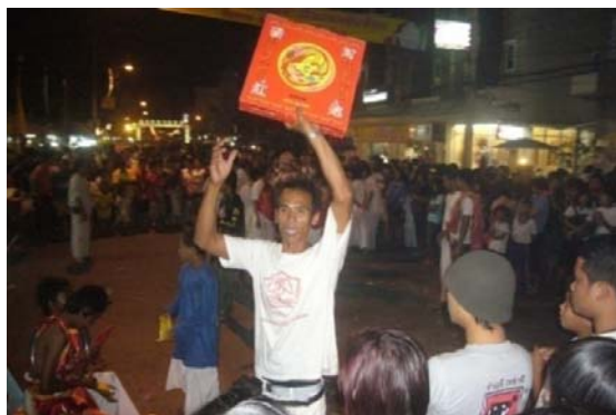
ภาพประกอบที่ 24 ตัวแทนของศาลเจ้าขายประทัดให้กับนักท่องเที่ยว 29 กันยายน 2554

จากคำสัมภาษณ์สะท้อนให้เห็นว่า รายได้ของศาลเจ้าจากการเข้าร่วมงานกับ เทศกาลกินเจหาดใหญ่นั้นมาจากการประกอบพิธีกรรม โดยการขายเครื่องบูชาให้กับนักท่องเที่ยว ได้นำมาประกอบพิธีกรรม เช่น รูป เทียน ประทัด และยังมีช่วงเวลาที่ทางศาลเจ้าสามารถหา รายได้ คือ พิธีแห่พระ ดังคำสัมภาษณ์ที่ว่า