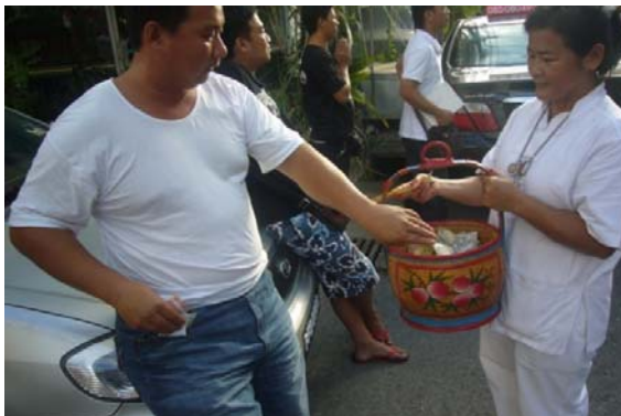
ภาพประกอบที่ 25 ชายผู้หรือผ้ายื่นคำให้กับนักท่องเที่ยว ที่มา: ถ่ายโดยผู้วิจัย 2 ตุลาคม 2554