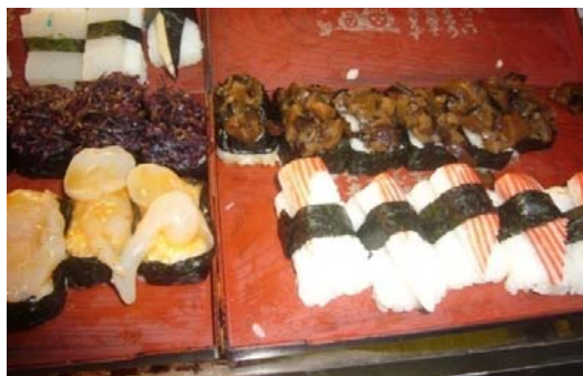
ภาพประกอบที่ 22 ซูชิที่ทำมาจากปูอัดเจ กุ้งเจ เนื้อปลาเจ และหอยเจ ที่มา: ถ่ายโดยผู้วิจัย 29 กันยายน 2554

“...เราไม่รู้หรอกว่าอาหารนั้นทำมาจากวัตถุดิบที่เป็นเจจริงๆหรือไม่ แต่ขอให้ร้านขายอาหารเจมีคุณธรรมในการเลือกผลิตภัณฑ์ที่นำมาทำขายด้วย...”