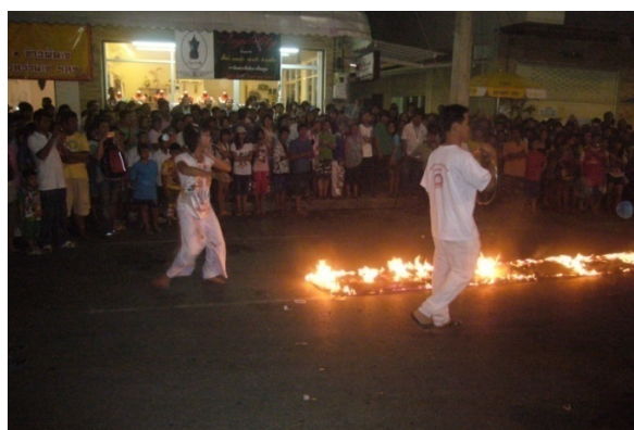
ภาพประกอบที่ 23 นักท่องเที่ยวดูการแสดงอิทธิฤทธิ์ ปาฏิหาริย์ลุยไฟจากร่างทรงของศาลเจ้า ที่มา: ถ่ายโดยผู้วิจัย 2 ตุลาคม 2554

(สุรพล กำพลานนท์วัฒน์, สัมภาษณ์ 27 กันยายน 2554)