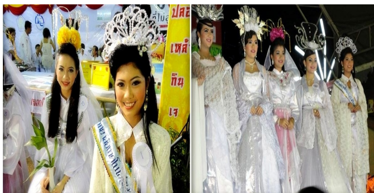
ภาพประกอบที่ 18 การประกวดธิดาเจียะน่ายแต่งกายด้วยเสื้อผ้าเลียนแบบเจ้าแม่กวนอิม ที่มา: ถ่ายโดยผู้วิจัย 2 ตุลาคม 2554

(เจนจิรากริน สาริพันธ์, สัมภาษณ์ 2 ตุลาคม 2554)