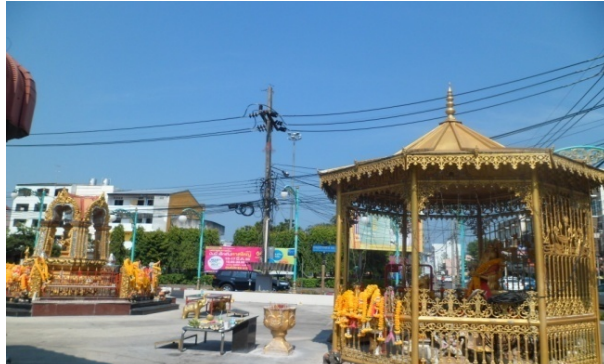
ภาพประกอบที่ 15 ศาลพระพิฆเนศและศาลพระพรหมในบริเวณมูลนิธิท่งเซี่ยเซียงตั้ง ที่มา: ถ่ายโดยผู้วิจัย 18 กันยายน 2554

จากลักษณะทางกายภาพของสถานที่จัดงานเทศกาลกินเจหาดใหญ่สะท้อนให้เห็นว่าบริเวณใกล้เคียงสวนหย่อมศุภสารรังสรรค์นั้น มีสถานที่สำคัญเป็นที่สามารถเป็นที่ดึงดูดให้นักท่องเที่ยวตัดสินใจเดินทางมาท่องเที่ยวในช่วงเทศกาลกินเจได้ เพราะนอกจากได้มาเที่ยวงานเทศกาลกินเจแล้ว ยังสามารถไปกราบไหว้ขอพรจากสถานที่ศักดิ์สิทธิ์ที่ตั้งอยู่บริเวณใกล้เคียงอย่างเช่น มูลนิธิท่งเซี่ยเซียงตั้ง ซึ่งเป็นสถานที่ตั้งของศาลพระพิฆเนศและศาลพระพรหม และยังสามารถไปถึงสวนหย่อมศุภสารรังสรรค์นั้นเป็นสถานที่ที่ตั้งอยู่บริเวณใจกลางของเมืองหาดใหญ่ เมื่อนักท่องเที่ยวเดินทางมาท่องเที่ยวแล้วยังสามารถที่จะเดินทางไปท่องเที่ยวตามสถานที่สำคัญต่างๆ ของ อำเภอหาดใหญ่ได้อย่างสะดวกอีกด้วย