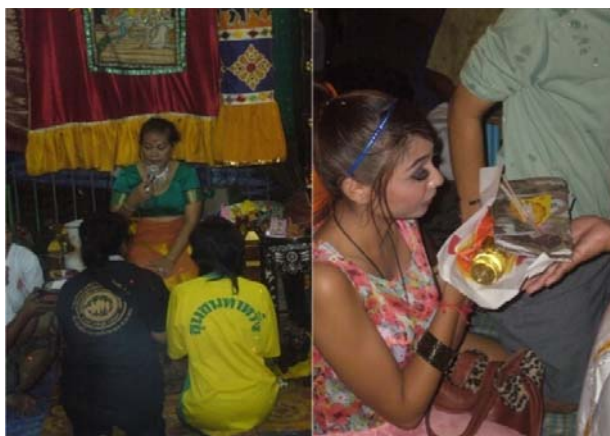
ภาพประกอบที่ 27 นักท่องเที่ยวที่มาทำบุญดูดวง สะเดาะเคราะห์ที่ ที่มา: ถ่ายโดยผู้วิจัย 29 กันยายน 2554