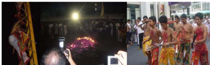
ภาพที่ 3 การปีนบันไดมิด การลุยไฟ และมาทรงในงานกินเจ อำเภอหาดใหญ่

การเดินทางไฟ เต้นบนเศษแก้ว ปีนบันไดมิด การเชิญเทพเจ้าลงมาทรงเพื่อให้นักท่องเที่ยวได้ขอพร และยังมีพิธีกรรมบางอย่างก็เป็นพิธีกรรมที่ไม่ได้มีมาตั้งแต่โบราณหรือว่าไม่ใช่พิธีกรรมในการกินเจอย่างแท้จริง เช่น การตูดวง การสักยันต์ แต่เป็นวิธีการอย่างหนึ่งที่สามารถดึงดูดความสนใจของนักท่องเที่ยวทั้งชาวไทยและชาวต่างชาติให้สนใจได้