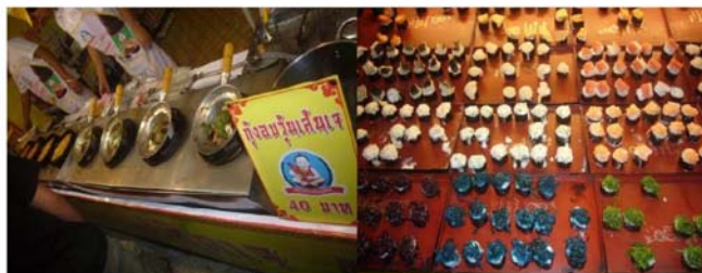
ภาพที่ 2 อาหารเจที่จำหน่ายในงานเทศกาลกินเจ อำเภอหาดใหญ่ ส่วนประกอบทำจากเนื้อสัตว์เจ

พิธีกรรมถือว่าเป็นส่วนที่สำคัญที่ทำให้ประเพณีกินเจมีความสมบูรณ์ ในบริเวณจัดงานเทศกาลกินเจครั้งนี้ประกอบด้วยศาลเจ้าต่างๆ เข้าร่วมงานในครั้งนี้นักว่า 30 ศาลเจ้า เพื่อความสะดวกให้กับนักท่องเที่ยวที่เข้ามาเที่ยวงานได้ขอพรจากเทพต่างๆที่นับถือ ซึ่งเหมาะสำหรับคนที่ไม่มีเวลาเดินทางไปยังศาลเจ้า และที่สำคัญม้าทรงหรือร่างทรงของแต่ละศาลได้แสดงอิทธิฤทธิ์ ปาฏิหาริย์ เช่น