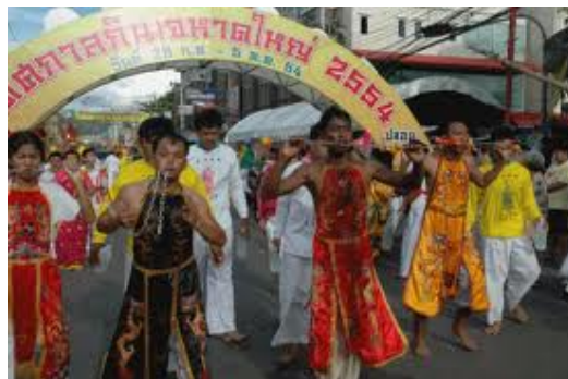
ภาพประกอบที่ 28 ม้าทรงในขบวนแห่พระเทศกาลกินเจหาดใหญ่ 2 ตุลาคม 2554