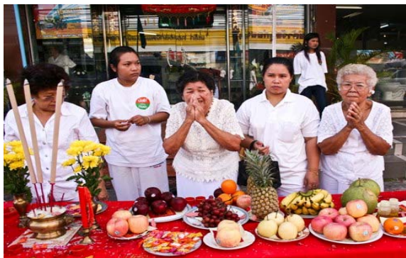
ภาพประกอบที่ 31 ประชาชนตั้ง โถ๊ะบูชารับพระเพื่อความเป็นสิริมงคล 2 ตุลาคม 2554

จากสัมภาษณ์แสดงให้เห็นว่า ชาวไทยเชื้อสายจีนนั้นยังมีความยึดมั่นในความเชื่อดั้งเดิมตามบรรพบุรุษ การที่ขบวนแห่พระผ่านหน้าบ้านนั้นถือเป็นเรื่องมงคล และเป็นโอกาสดีที่จะได้รับพรจากเทพต่างๆจากขบวนที่ผ่านมา และเป็นการทำบุญไปให้กับบรรพบุรุษที่ล่วงลับไปแล้วอีกด้วย ซึ่งสะท้อนอุดมคติของผู้เข้าร่วมพิธีรับพระ ที่ให้ความสำคัญกับ ทรัพย์สินเงินทอง อายุยืนยาว สุขภาพ สุขความเจริญรุ่งเรือง และสะท้อนให้เห็นคุณค่าของความกตัญญู