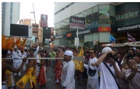
ภาพประกอบที่ 30 นักท่องเที่ยวและประชาชนรอชมความยิ่งใหญ่ ของขบวนแห่พระบริเวณหน้าห้างลิการ์เดิน 2 ตุลาคม 2554

(สุรพล กำพลานนท์วัฒน์, สัมภาษณ์ 27 กันยายน 2554)