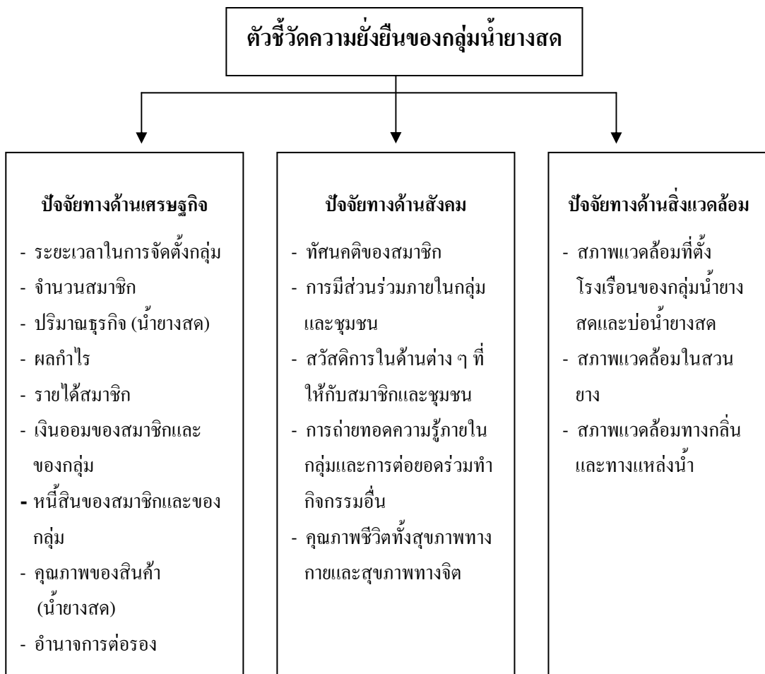
ภาพที่ 3.1 กรอบแนวคิดว่าด้วยความยั่งยืน

3.2.6 ความยั่งยืนของการรวมกลุ่มน้ำยางสด เป็นการสังเคราะห์ข้อมูลที่ได้จากข้อ 3.2.1 – 3.2.5 เพื่อให้ทราบถึงปัจจัยที่ส่งผลให้เกิดความยั่งยืนในการรวมกลุ่มน้ำยางสด โดยแบ่งออกเป็น 3 ด้าน คือ ด้านเศรษฐกิจ ด้านสังคม และด้านสิ่งแวดล้อม ซึ่งทั้ง 3 ด้าน ผู้วิจัยให้ความสำคัญเท่า ๆ กัน โดยตัวชี้วัดความยั่งยืนทั้ง 3 ด้าน มีรายละเอียดดังนี้ ภาพที่ 3.1