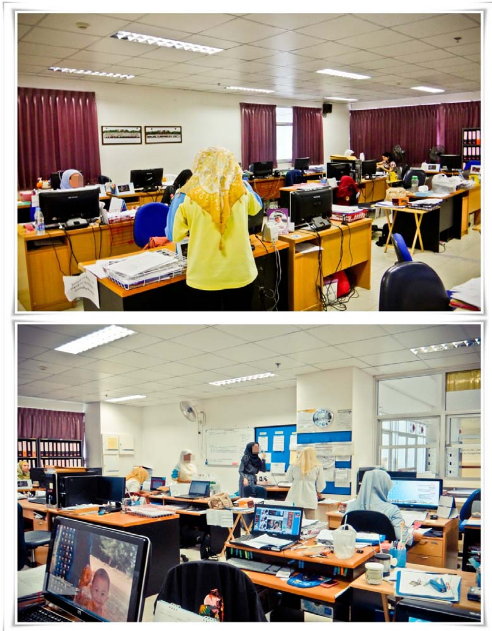
ภาพประกอบ 2 ภายในสำนักงานของเลขานุการแพทย์มิโตะทำงานทั้งสิบเรียงรายอยู่เต็มพื้นที่ ที่มา ถ่ายโดยผู้วิจัย วันที่ 15 ตุลาคม 2555

จากการพูดคุยแสดงให้เห็นว่า นักศึกษาแพทย์จะต้องมีการปฏิสัมพันธ์กับ เลขานุการแพทย์ผ่านบริบทสำนักงานของเลขานุการแพทย์อยู่เสมอ ซึ่งจะติดต่อผ่านช่องทางต่าง หน้าสำนักงานของเลขานุการแพทย์เป็นส่วนใหญ่ ดังกล่าวข้างสะท้อนเห็นถึงความสัมพันธ์ระหว่าง นักศึกษาแพทย์และเลขานุการแพทย์อีกด้วย