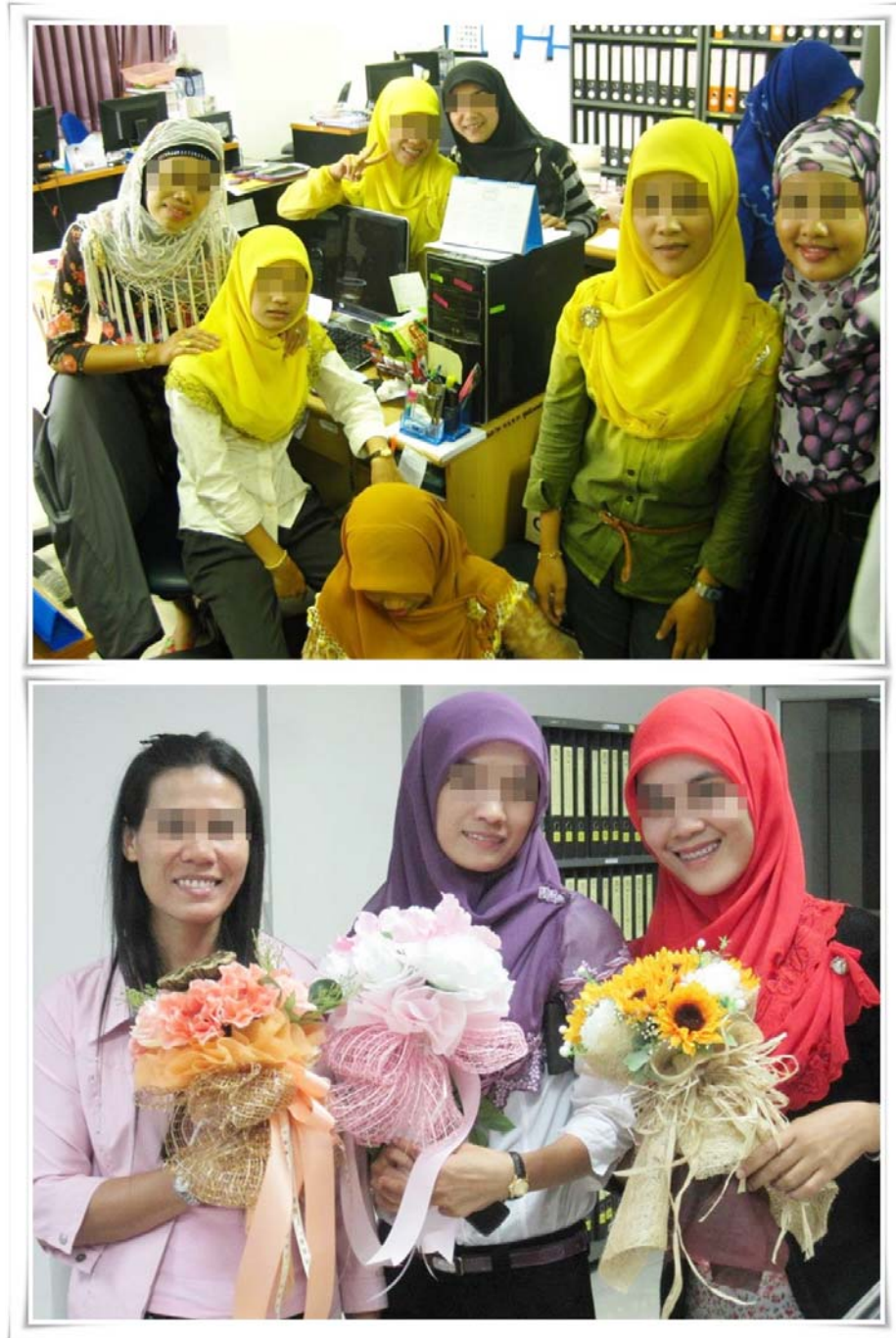
ภาพประกอบ 6 การแต่งกายของกลุ่มเลขานุการแพทย์ ที่มา ถ่ายโดยผู้วิจัย วันที่ 15 ตุลาคม 2555

ยังคงมีรูปแบบทันสมัยตามแฟชั่น มีหลากหลายจุดขาด บางครั้งอาจจะมีรูปแบบแปลกตาไปตาม สมัยนิยมอีกด้วย