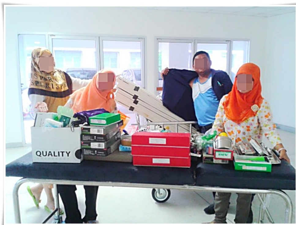
ภาพประกอบ 3 เลขานุการแพทย์ยืมวัสดุและครุภัณฑ์ตามแผนกต่างๆ วันที่ 15 ตุลาคม 2555

จากคำสัมภาษณ์ดังกล่าว ชี้ให้เห็นถึงความสัมพันธ์ระหว่างเลขานุการแพทย์กับพยาบาลผ่านบริบทในแผนกต่างๆ ในสถานพยาบาล ซึ่งเลขานุการแพทย์ได้รับมอบหมายให้ดูแลรับผิดชอบตามแผนกนั้นๆ