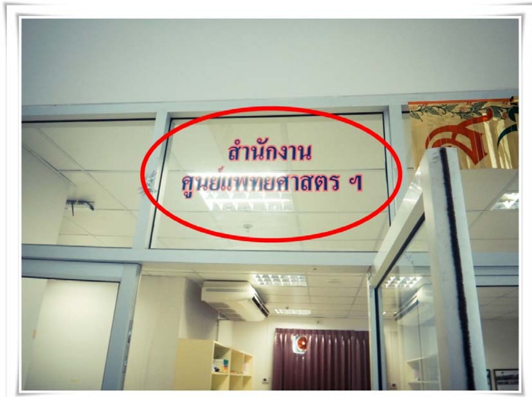
ภาพประกอบ 1 บริเวณทางเข้าของสำนักงานศูนย์แพทยศาสตรศึกษาชั้นคลินิก วันที่ 15 ตุลาคม 2555

ดังนั้น เมื่อเลขานุการแพทย์เข้ามาดำรงในพื้นที่สถานพยาบาลแห่งนี้ เลขานุการแพทย์จะต้องมีการปฏิสัมพันธ์กับกลุ่มบุคคลต่างๆ แทบทุกๆพื้นที่ในสถานพยาบาลอย่างหลีกเลี่ยงไม่ได้ เนื่องจากในงานด้านเลขานุการนั้น การพบปะ ติดต่о หรือประสานงานกับบุคคลต่างๆ ถือเป็นหน้าที่หลักเลยก็ว่าได้ที่เลขานุการแพทย์จะต้องปฏิบัติอยู่เสมอ ซึ่งการปฏิสัมพันธ์ระหว่างเลขานุการแพทย์กับกลุ่มบุคคลต่าง ๆ นั้น ก่อให้เกิดความสัมพันธ์ระหว่างเลขานุการแพทย์กับบุคคลกลุ่มต่างๆภายใต้บริบทสถานพยาบาลแห่งนี้ ดังต่อไปนี้