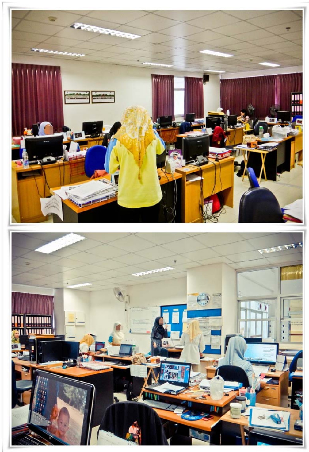
ภาพประกอบ 5 โต๊ะทำงานของกลุ่มเลขานุการแพทย์ที่มีคอมพิวเตอร์วางอยู่ทุกตัว วันที่ 15 ตุลาคม 2555