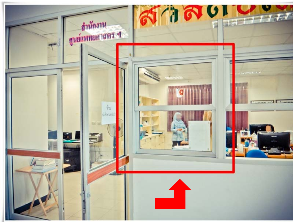
ภาพประกอบ 7 ช่องหน้าต่างกระจกบานเล็กหน้าต่างพื้นที่สำนักงานของเลขานุการแพทย์ วันที่ 15 ตุลาคม 2555

“ เคยมีเหตุการณ์ครั้งหนึ่งค่ะ ตอนนั้นหนูกับเพื่อนนักศึกษาแพทย์คนอื่นๆ จะต้องออกชุมชน หนูรู้ว่าพี่เลขาฯเขาจะต้องเป็นคนแบ่งกลุ่มให้หนูกับเพื่อนแบ่งไปตามโรงพยาบาลชุมชนของอำเภอต่างๆ จะไปอยู่แล้ววันพรุ่งนี้เรายังไม่รู้เลยจะได้ไปโรงพยาบาลชุมชนไหน ไปกับเพื่อนคนไหนบ้าง ดัดสินใจกับเพื่อนห้าหกคนได้มั้ง เดินไปถามกับพี่เขาเลย ล้อมพี่เลขาไว้ด้วยนะ หนูถามกับพี่เขาแบบทำหน้านิ่งๆทำเสียงเครียดนิดหน่อย แต่ไม่ทำอะไรพี่เขาณะ พี่เขาก็ตอบว่ายังไม่แบ่งกลุ่มบ้าง หมอเป็นคนแบ่งให้บ้าง ตอบแบบมั่วไปหมด สุดท้ายพี่เขารีบเดินหนีเข้าไปในสำนักงานของพี่แกเลย เราก็ตามเข้าไปด้วยไม่ได้ไง สรุปวันนั้นก็ไม่รู้อยู่ที่แต่มารู้ทีหลังว่า พี่เขาไม่บอกแต่เนิ่นๆ กลัวเราจะไปสลับกลุ่มกันเอง เพราะมีรุ่นก่อนๆ เค้ายสลับกัน พี่เขาบอกว่ามีปัญหาเวลาพี่เขาส่งใบประเมินไปหมอทางนุ่นเข้าประเมินเรา เค้ายประเมินคะแนนให้ไม่ถูก ประเมินผิดคนว่าจั่นแหละ”