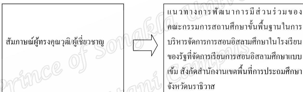
ภาพประกอบที่ 1 กรอบแนวคิดในการวิจัย