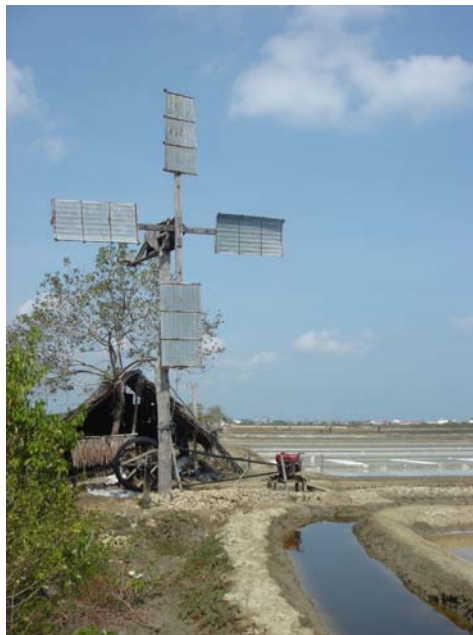
ภาพที่ 5 แสดงกังหันลม บริเวณนาเกลือตำบลบานา อำเภอมืองปัตตานี จังหวัด ปัตตานี ถ่ายเมื่อวันที่ 9 มีนาคม 2549

และกังหันลมถูกนำมาใช้ในนาเกลือที่ปัตตานีตั้งแต่เมื่อใดยังไม่มีคำตอบที่มีน้ำหนักชัดเจน นัก นอกจากคำให้สัมภาษณ์ของนายอูมา อับดุลสาเมาะ ซึ่งพอจะมีน้ำหนักในแง่ของ ประวัติการ ทำนาเกลือ และเขตพื้นที่อำเภอบ้านแหลม จังหวัดเพชรบุรี มีการทำนาเกลือมายาวนาน มีพื้นที่ ทำนาเกลือในลักษณะอุตสาหกรรมที่ค่อนข้างชัดเจน