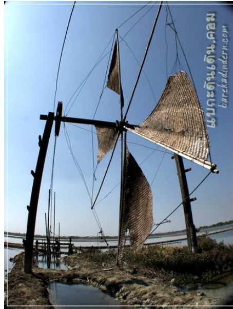
ภาพที่ 4 แสดงกังหันลมเสื่อลำแพนในภาคกลาง