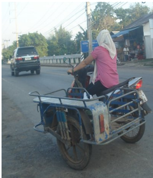
ภาพประกอบที่ 6 การแต่งกายของผู้หญิงไทยมุสลิมสตุลที่เน้นความสะดวกในการขับขี่ ที่มา:ถ่ายโดยผู้วิจัย วันที่ 6 มกราคม พ.ศ.2554