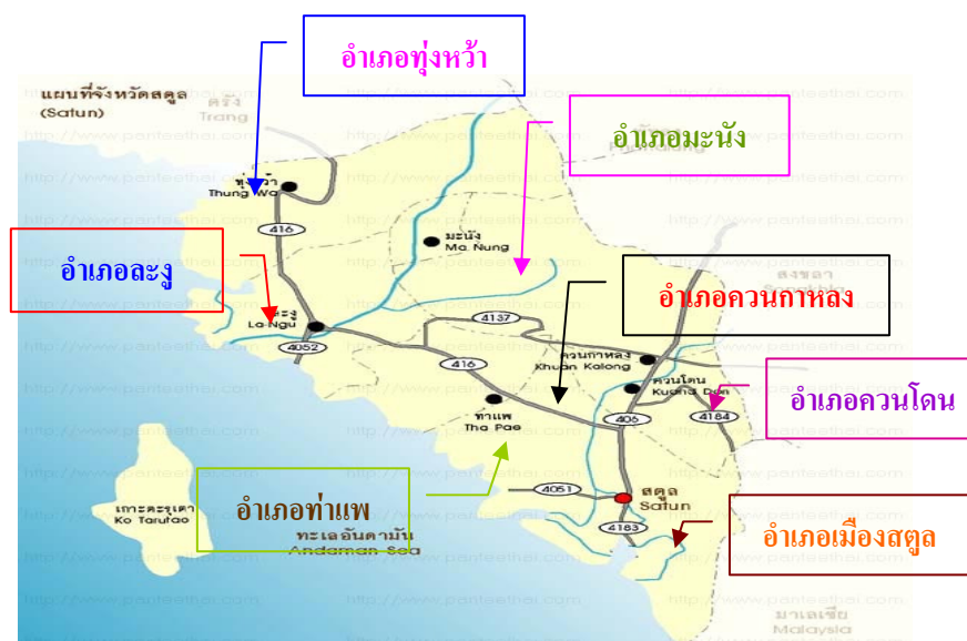
ภาพประกอบที่ 3 แผนที่แสดง อำเภอต่างๆ ในจังหวัดสตูล