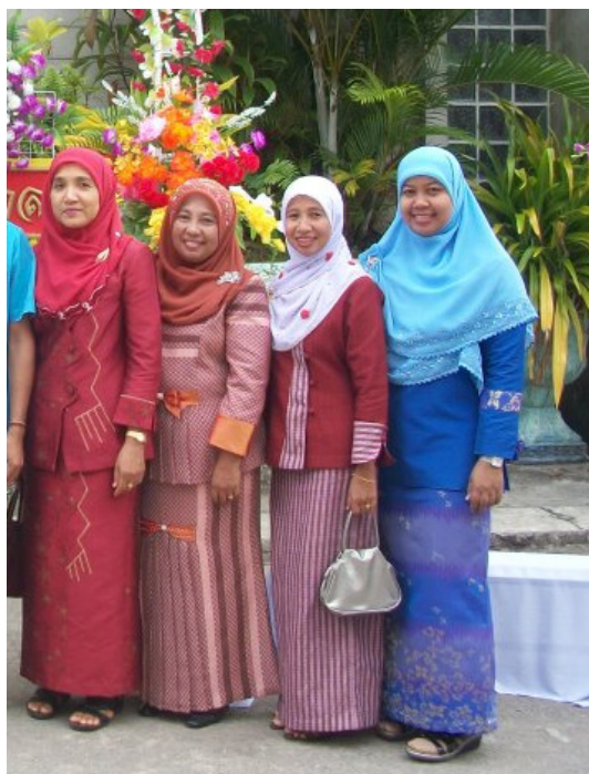
ภาพประกอบที่ 7 สีสันเสื้อผ้าชุดทำงานของผู้หญิงไทยมุสลิม ที่มา:ถ่ายโดย ซากิเร๊ะ เจ๊ะแหว วันที่ 17 เมษายน พ.ศ.2554