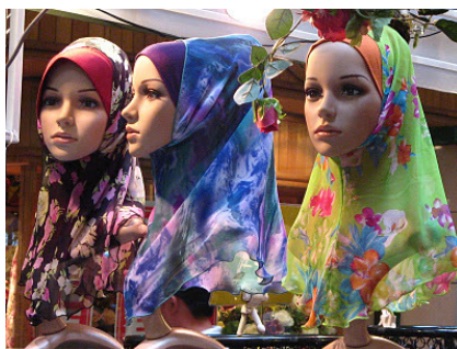
ภาพประกอบที่ 4 ผ้าคลุมสีล้วนสวยงามตามสมัยนิยม

การแต่งกายของผู้คนแต่ละสังคม มีการแต่งกายที่แตกต่างกัน ต่างมีรูปแบบการแต่งกาย ที่เป็นเอกลักษณ์เฉพาะ สำหรับสังคมสตูลนั้น ด้วยประชากรส่วนใหญ่นับถือศาสนาอิสลาม ประกอบกับ เป็นจังหวัดที่มีอาณาเขตติดกับประเทศมาเลเซีย ส่งผลต่อการเกิดการผสมผสาน และแลกเปลี่ยนของ วัฒนธรรมการแต่งกายในแบบเฉพาะ ทั้งของชาวมาเลย์ปะทะกับวัฒนธรรมการแต่งกายแบบไทย และ การแต่งกายแบบมุสลิม ส่งผลให้วัฒนธรรมการแต่งกายของชาวสตูล เป็นอีกประเด็นที่น่าสนใจ โดยเฉพาะการศึกษาเกี่ยวกับการทำงานนอกบ้านของผู้หญิงไทยมุสลิมนั้น เรื่องการแต่งกายของ ผู้หญิงไทยมุสลิมนับเป็นอีกประเด็นที่เป็นเงื่อนไขสำคัญที่ส่งผลต่อ โอกาสการทำงานนอกบ้านของ ผู้หญิงไทยมุสลิม ทั้งในเรื่องของความจำเป็นที่ต้องแต่งกายตามบทบัญญัติศาสนาอิสลามมีความเป็น เอกลักษณ์ และเป็นประเด็นที่น่าจับตามองในสังคมปัจจุบัน บ่อยครั้งที่การแต่งกายถูกต้องตาม หลักการศาสนาอิสลามมีผลต่อการยอมรับหรือโอกาสการทำงานในพื้นที่สาธารณะ หรือแม้กระทั่ง อุปสรรคจากครอบครัวหรือสถานที่ทำงานรวมถึงสังคมสาธารณะ