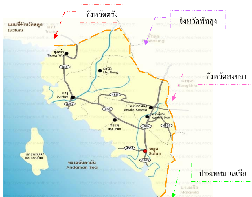
ภาพประกอบที่ 2 แผนที่แสดง อำเภอต่างๆ ในจังหวัดสตูลและจังหวัดใกล้เคียง