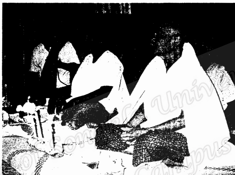
คนทรงด้านซ้ายมือ ชื่อว่า นายสุรพล แก้ววิเชียร ขวามือ ชื่อว่านายเคลือบ บุญล้อม ครุหมอที่มาประทับร่างทรงแต่ละคน ไม่เหมือนกัน (ภาพถ่าย 18 พฤษภาคม 2550)

รูปแบบการแต่งตัวด้วยการนุ่งผ้าถุงกระเบน เสื้อสีขาวและใช้ผ้าขาวคาดทแยงมุม การเชื่อเชิญครุหมอมมาประทับร่างทรง จะเชื่อเชิญพร้อมกันหรือจะเชื่อเชิญครั้งละกี่คน ขึ้นอยู่กับจำนวนร่างทรงมากน้อย และความต้องการของคณะเจ้าภาพ สำหรับคืนวันที่ 18 พฤษภาคม 2550 ที่บ้านโคกตาแปด ผู้ประทับร่างทรงมีจำนวน 4 คน ผู้ชาย 2 คน ผู้หญิง 2 คน ทางคณะเจ้าภาพต้องการให้เชื่อเชิญครุหมอมมาประทับร่างทรงครั้งละ 2 คน พี่เลี้ยงจัดเตรียมการปูเสาดหัวหมอน เชี่ยนรม และขันหมากทรง 2 ที่ และการปูเสาดหัวหมอนนั้น ห้ามซ้อนทับกัน ถ้าทรงมากๆ มีการซ้อนกันได้เหมือนกัน ถ้าร่างทรงยินยอม เพราะการซ้อนทับ ถือว่าเป็นการไม่ให้เกียรติครุหมอประจำร่างทรง