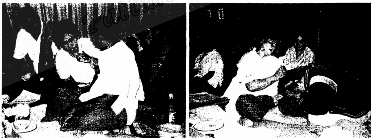
คณะเจ้าภาพ ลูกหลาน ญาติมิตรภายในชุมชน จะเข้าไปหาครูหมอ พร้อมกับบอกเล่าปัญหา อุปสรรค และความต้องการ ให้ครูหมอได้รับฟัง พร้อมกับคำตอบจากครูหมอมตามแนวทางที่ต้องนำไปปฏิบัติ (ภาพถ่าย 18 เมษายน 2550)