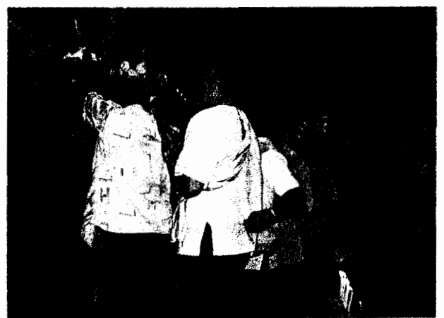
ผู้เป็นร่างทรงนำคณะเจ้าภาพและบรรดาญาติเข้ามาร่วมในพิธีเช่นครุ เช่นสังข์ศักดิ์สิทธิ์ และเช่นเทวดา และแสดงการต้อนรับพ่อแม่ครุหมอในคืนแรก (ภาพถ่าย 18 เม.ย. 50)