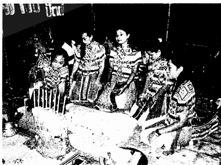
บรรดานางรำโนราโรงครูเข้าร่วมพิธีกราบหรือนอบครู ด้วยการรำรำ และโปรยข้าวตอก ข้าวสาร (ภาพถ่าย 26 เมษายน 2550)

พิธีกราบครู หรือนอบครู เริ่มด้วยเหล่านางรำผู้เป็นประธานจะทำพิธีจุดธูปเทียน กราบสามครั้ง ลูกขึ้นรำรำอวยพร อวยชัยพร้อมกันพอเป็นพิธีกรรมต่อครูหมอบโนรา ด้วยการโปรยข้าวตอกและข้าวสาร (ใช้แทนงา) “เวลาเข้าหว่านดอก เวลาออกหว่านงา”