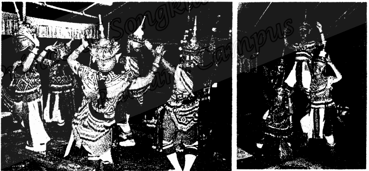
บรรดานางรำได้ทำการรำรำรำไหว้ครู ไหว้ภูมิเจ้าที่ ไหว้สังข์ศักดิ์สิทธิ์ เป็นการเบิกฤกษ์การแสดงโนราโรงครูในคืนแรก (ภาพถ่าย 18 เมษายน 2550)

พิธีกรรมการแสดงเคารพบูชาครูหมอโนรา สังข์ศักดิ์สิทธิ์ และการต้อนรับครูหมอโนราเสร็จแล้ว เหล่านางรำจะออกมารำรำรำ พร้อมกับลูกคู่บรรเลงเครื่องดนตรีให้จังหวะ คืนแรกเป็นการรำรำรำไหว้ครู ไหว้ภูมิเจ้าที่ และไหว้สังข์ศักดิ์สิทธิ์ ถือเป็นการรำเบิกฤกษ์ในการแสดงโนราโรงครู เพื่อให้สิ่งที่อยู่เหนือธรรมชาติอันเป็นที่เคารพบูชาของคณะโนราและบรรดาญาติได้รับรู้ถึงการกตัญญู การเคารพบูชา ซึ่งแสดงออกด้วยการรำรำ “ถวายครู”