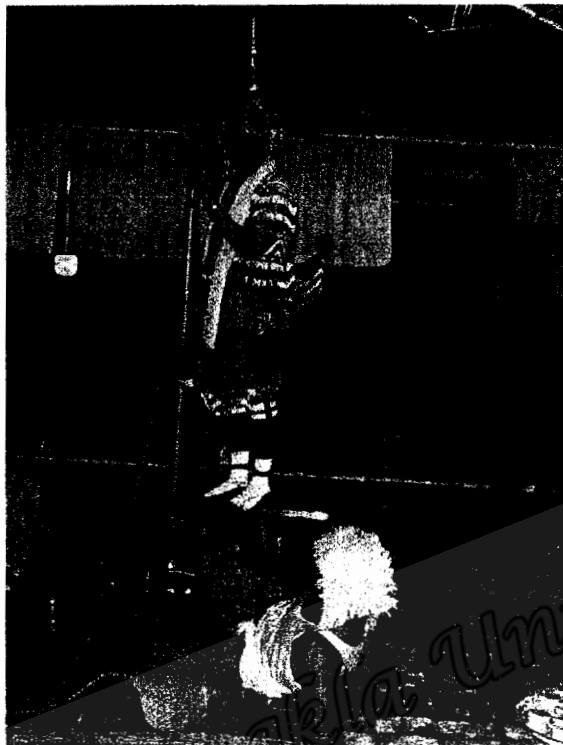
นางโนรากำลังจะบินออกทางช่องจากถูกเปิดออก ไปสู่นบ้านเมืองของนาง (ภาพถ่าย 19 เมษายน 2550)

การรำลึกสองบท เป็นการเล่าเรื่องที่ได้รับความนิยมจากชาวบ้านในอดีตเป็นอย่างมาก เป็นนิยายแบบจักร ๆ วงศ์ ๆ คณะโนราโรงครูได้หยิบยกมาบางตอนขึ้นมาแสดงเพื่อความสนุกสนานและความบันเทิง ส่วนเรื่องที่ได้รับ ความสนใจและคณะโนราโรงครูนิยมแสดง คือ เรื่องโนรา สามารถเรียกน้ำตาจากคนดูได้ เพราะชาวบ้านจะมีความรักนางโนราอยู่แล้ว รู้ว่าถูกใส่ความจนถูกบูชายัญ จะเป็นบทที่เศร้าสุดต่อผู้ชมเป็นอย่างมาก