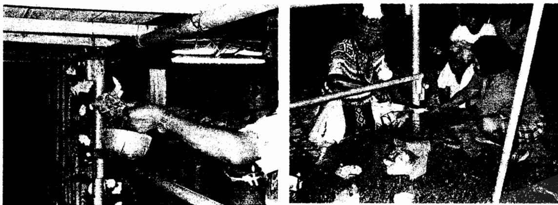
การตัด เหนุขย ต้องการใช้เจ้าภาพหลุดพ้นจาก พันธสัญญาระหว่างเจ้าภาพ กับครุหมอโนรา (ภาพถ่าย 19 เมษายน 2550)