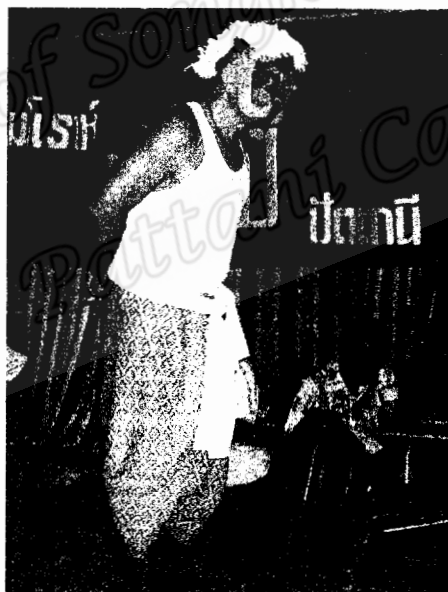
(ภาพถ่าย 19 เมษายน 2550)