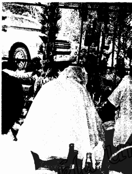
การเชื้อหาครุหมอมาประทับร่างทรงกับผู้ครุหมอได้เลือกให้สืบทอดทายาทต่อจากถิ่นแรก (ภาพถ่าย 19 เมษายน 2550)

ครุหมอมาประทับร่างทรง เวลาใกล้จะล่วงเลย “หยามพระ” * จึงต้องหยุดการเชื้อเชิญ ทำให้การสืบทอดทายาทการเป็นร่างทรงไม่เป็นผล จะต้องแสวงหาร่างทรงกับบุตรหลายคนอื่นต่อไป