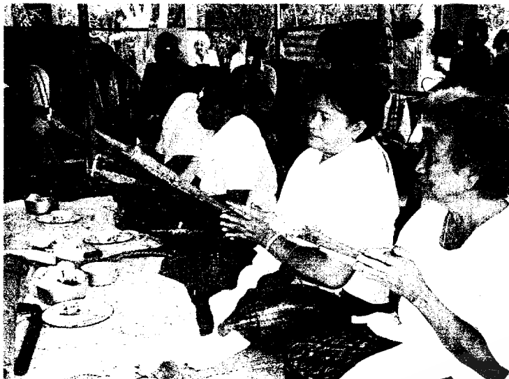
นายโรงโนราและนางโนราจะเป็นตัวแทนฝ่ายโลกทางวิญญาณเป็นสื่อกลางในการถวายนเครื่องเซ่นให้กับครุหมอได้รับผ่านทางร่างทรง (ภาพถ่าย 19 เมษายน 2550)