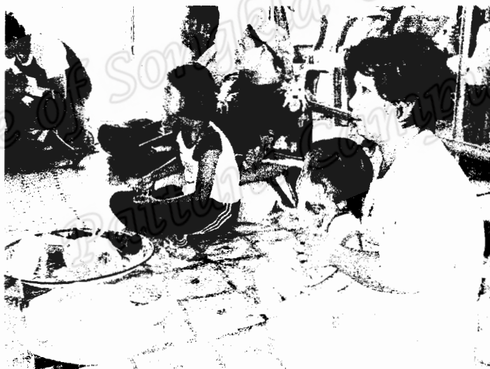
ครอบครัวพญูตรหลานมาเหยียบเสน ครอบครัวหนึ่งเดินทางมาจาก จังหวัดนราธิวาสส่วนอีกครอบครัวหนึ่งเป็น ครอบครัวมุสลิมในพื้นที่ (ภาพถ่าย 18 เมษายน 2550)

การเหยียบเสน เพื่อยับยั้งไม่ให้เสนขยายใหญ่โตขึ้นตามวัยของเด็ก ถ้าต้องการให้เสนหายขาด ต้องเหยียบกับนายโรงโนราโรงครู 3 ครั้ง นายโรงโนราที่ผ่านพิธีกรรมการตัดจุกจากคณะโนราต่าง ๆ มาแล้วเท่านั้น ที่จะเหยียบเสนให้หายขาดได้ นายโนราที่ยังไม่ได้ผ่านการตัดจุกมาก่อน จะไม่สามารถ เหยียบเสนให้หายขาดได้ และการเหยียบเสนนั้น ต้องเหยียบให้ครบ 3 ครั้ง จะเหยียบกับนายโนรา เดียวกันก็ได้ แต่ต้องพญูตรหลานไปเหยียบครั้งต่อไป ตามสถานที่อื่น ๆ ที่นายโรงโนราทำการแสดง