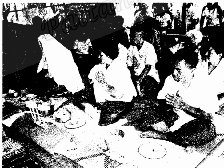
ร่างทรง และคณะเจ้าภาพ ญาติ ๆ เข้ามา ภายในโรงพิธีโรงโนราโรงครุ เพื่อจะได้เข้าสู่การถวาย หมูรับ พร้อมกัน (ภาพถ่าย 19 เมษายน 2550)

ภาคกลางวันเป็นการเชือครุหมอมารับเครื่องสังเวย ตามพันธสัญญาได้ตกลงกันไว้ ซึ่งเจ้าภาพถือว่า วิญญาณของบรรพบุรุษ (ครุหมอโนรา) สามารถรับเครื่องเช่นสังเวยได้ ด้วยการลงมาประทับร่างทรง มีนายโรงเป็นสื่อกลาง ก่อนจะมีพิธีเชือครุหมอโนรา ตัวแทนคณะโนรานำสายสิญจน์จากภายในโรงพิธีโยงรอบล้อมโรงโนรา และเวียนล้อมผู้ที่เข้าร่วมในพิธี เพื่อให้ทุกคนเข้ามาร่วมอยู่ในพิธีกรรม เพื่อป้องกันสิ่งไม่ดีเข้ามาทำลายพิธี และเป็นการเปิดโลกวิญญาณกับโลกมนุษย์ให้พบปะพูดคุย และร่วมกับถวายเครื่องเช่นสังเวยให้กับครุหมอโนราพร้อมกัน