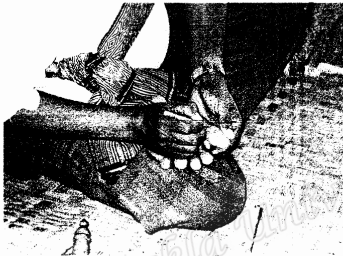
นายโรงโนราคณะ "เฉลิมประพา" เขียนอักขระตัวขอม ที่นิ้วหัวแม่เท้า พร้อมกล่าวคาถาลงไป (ภาพถ่าย 18 เมษายน 2550)

แต่ต้องเป็นครั้งต่อไปที่นายโรง โนราทำการแสดง หรือจะเป็นวันรุ่งขึ้นก็ได้ ตามปกติแล้วนายโรง โนรา จะเหยียบเสนแค่วันเดียวเท่านั้น การละเล่นแต่ละครั้งมีขั้นตอนของพิธีกรรมหลายขั้นตอน จึงไม่มีเวลา เหยียบเสนในวันรุ่งขึ้นได้อีก