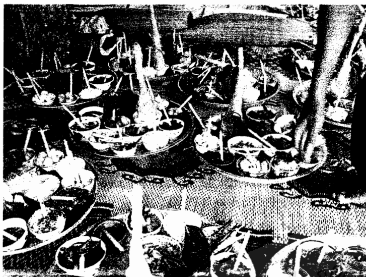
เครื่องเซ่นทางคณะเจ้าภาพ ได้จัด เตรียม ไว้เพื่อเซ่น ให้กับครุหมอ ตามจำนวนครุหมอที่ได้มาประทับร่างทรง (ภาพถ่าย 26 เมษายน 2550)

การจัด หุมริบ สำหรับการเซ่นสังเวศครุหมอ สิ่งของจำเป็นที่ขาดไม่ได้ประเภท เหนียวเหลือง เหนียวขาว ขนมโค ขนมแดง และไก่อ ถือว่าเป็นสิ่งของสำคัญ ถ้าครุหมอโนราธิบหนึ่งที ก็ต้องมไก่อหนึ่งตัว ภาษาครุหมอโนราธิบเรียกการสังเวศ ว่า “ผักบิณ ตินเคิ้น” คือ ไก่อ เป็นสำนวนของครุหมอต้องการให้บุตรหลานได้เซ่นไก่อในการยก หุมริบ