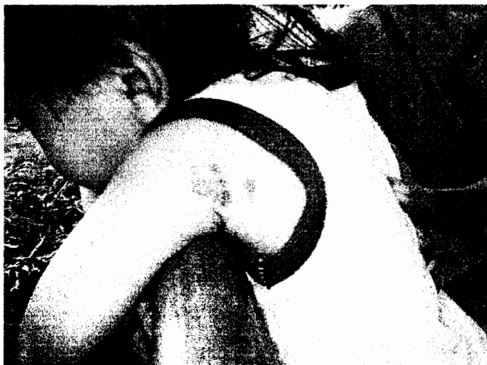
ตัวอย่างของเด็กที่เป็นसानแดง จะขยายโตขึ้นตามอายุของเด็ก พ่อแม่ได้พามาให้นายโรงโนราทำพิธีเหยียบเสน (ภาพถ่าย 18 เมษายน 2550)