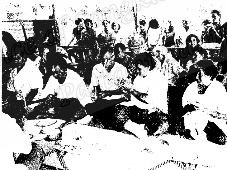
ตัวแทนนางโนราเป็นตัวแทนในการถวายนเครื่องเซ่น โดยมีนายโรงเป็นผู้ถือหัวเชือกสายสัญญาณในการทำพิธีกรรมถวายนเครื่องเซ่น (ภาพถ่าย 19 เมษายน 2550)

การถวายนหมุ่รับ ต้องจุดเทียนปักไว้ที่ปลายพระจันทร์ให้ร่างทรงต้องถือเอาไว้ บางคณะโนราใช้เทียนอย่างเดียว เพื่อใช้ในการวนรอบเครื่องสังเวศ เพื่อให้ครุหมอได้สังเวศทุกอย่าง (หรือใช้พระจันทร์แทนมิด ในการเนียนหมุ่ ไม้) เสร็จการสังเวศเปิดโอกาสครุหมอกับบุตรหลาน ได้พบปะพูดคุย สนุกสนาน ตามความประสงค์ทั้งสองฝ่าย