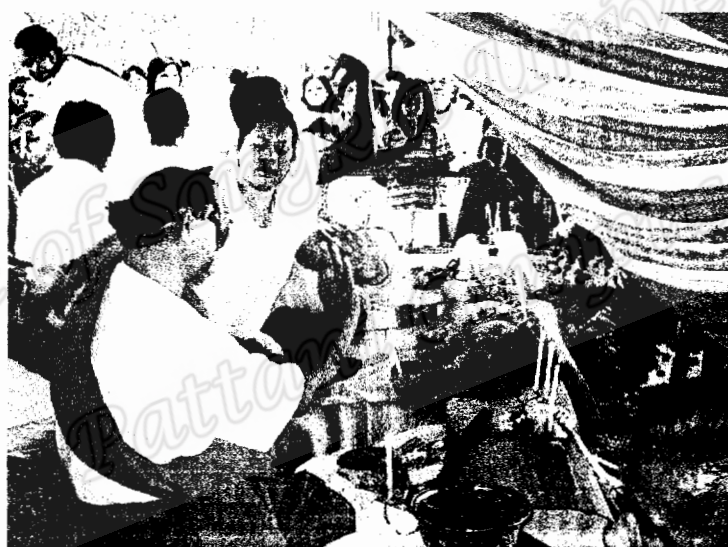
ครุหมอมารับที่โรงทรวง ยังมีความยินดีร่วมความสนุกด้วยการแสดงตามลักษณะความชื่นชอบของครุหมอแต่ละโรงทรวง (ภาพถ่าย 26 เมษายน 2550)

ครั้นครุหมอประทับโรงทรวงแต่ละทรวงหมดแล้ว ก่อนจะถวายเครื่องเซ่นสังเวช จะถามทุกทรวงว่าครุหมอมารับที่ทรวงครบหมดทุกท่านหรือยัง โรงทรวงท่านใดยังมีครุหมอหลงเหลืออยู่ นายโรงจะได้เชื้อเพิ่มเติม ซึ่งสภาวะการณ์ของครุหมอมารับที่โรงทรวงยังแสดงอาการตามความความประสงค์ ด้วยการแสดงอาการต่าง ๆ เช่น การรำโนรา การออกพราน เป็นต้น