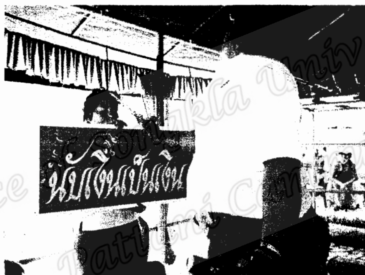
บุตรหลานที่ประกอบกิจการธุรกิจ นิมนต์นำป้ายร้านมาให้ครุหมอทำพิธีเปิดป้ายร้านให้ เพื่อเป็นสิริมงคลในการทำธุรกิจเจริญรุ่งเรือง (ภาพถ่าย 19 เมษายน 2550)

ภาคกลางวัน ครุหมอมมีโอกาสพบปะกับลูกหลานสองช่วง ช่วงก่อนถวายหมุ่รับ เมื่อนายโรงเชื้อครุหมอเข้าทรงหมดแล้ว จะมีเวลาเพียงเล็กน้อยต้องการให้ลูกหลานมีโอกาสพูดคุยกับครุหมอ “พูดคุยพอเป็นยา เป็นงานเป็นการ” เพราะจะทำให้เลฆยามพระ (พระฉันทพล) จะถวาย หมุ่รับไม่ได้ ช่วงที่สอง ครุหมอรับการถวาย หมุ่รับเสร็จแล้ว จะเปิดโอกาสให้ลูกหลานได้พบปะ พูดคุย ตามทุกข์สุข การสะเดาะเคราะห์ การรักษาอาการเจ็บป่วย ครุหมอกับลูกหลานจะได้มีการรำโนรา ออกพรานร่วมกัน อย่างสนุกสนาน บางครั้งบุตรหลานที่มีอาชีพค้าขาย ธุรกิจส่วนตัว จะนำป้ายร้านมาให้ครุหมอทำพิธีเจิมป้ายให้ เพื่อความเป็นสิริมงคล ทำให้การค้าขายเจริญรุ่งเรือง เสมือนกับเชื้อเชิญครุหมอโนรามาประจำอยู่ที่ร้าน ค่อยปลุกปลื้มรักษาในท่ามกลางสถานการณ์ความไม่สงบในปัจจุบัน