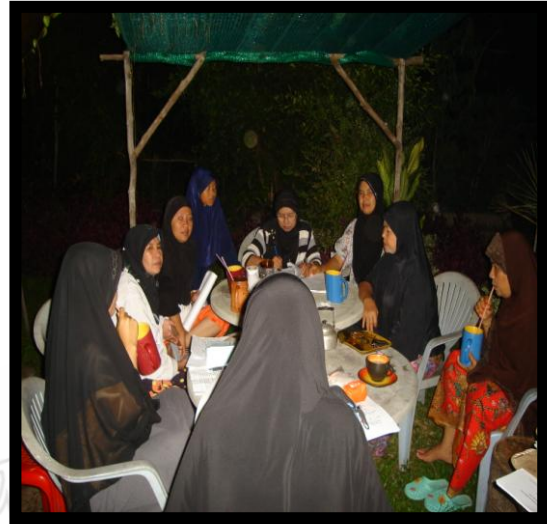
ประชุมคณะทำงาน

Principles of Social Science Pattani Campus