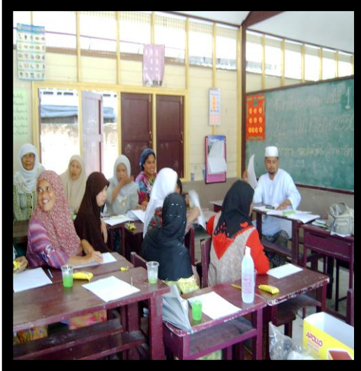
สร้างองค์ความรู้ก่อนจัดทำเอกสาร