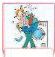
do the laundry