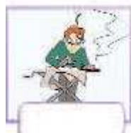
iron your clothes