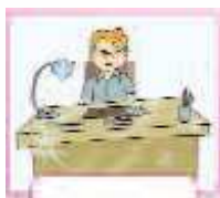
tidy your desk