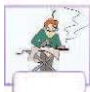
iron your clothes