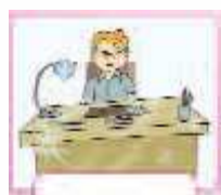
tidy your desk