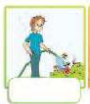
water the plants

2. How often do you do the following? Write sentences. Use adverbs of frequency .