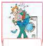
do the laundry