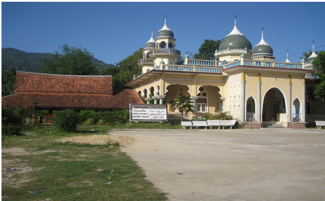
ภาพประกอบ 3 มัสยิดนัจมุดดิน หมู่ที่ 4 ตำบลทรายขาว อำเภอโคกโพธิ์ จังหวัดปัตตานี