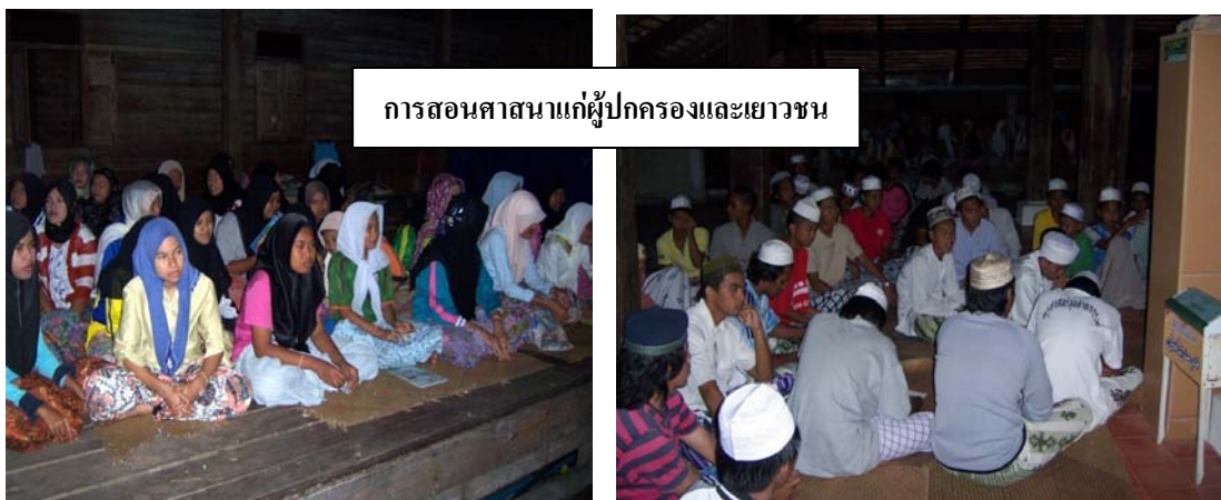
การสอนศาสนาแก่ผู้ปกครองและเยาวชน