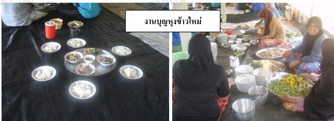
ภาพประกอบ 10-15 ประเพณี และงานบุญทางศาสนาของชุมชนบ้านควนดั่งงา