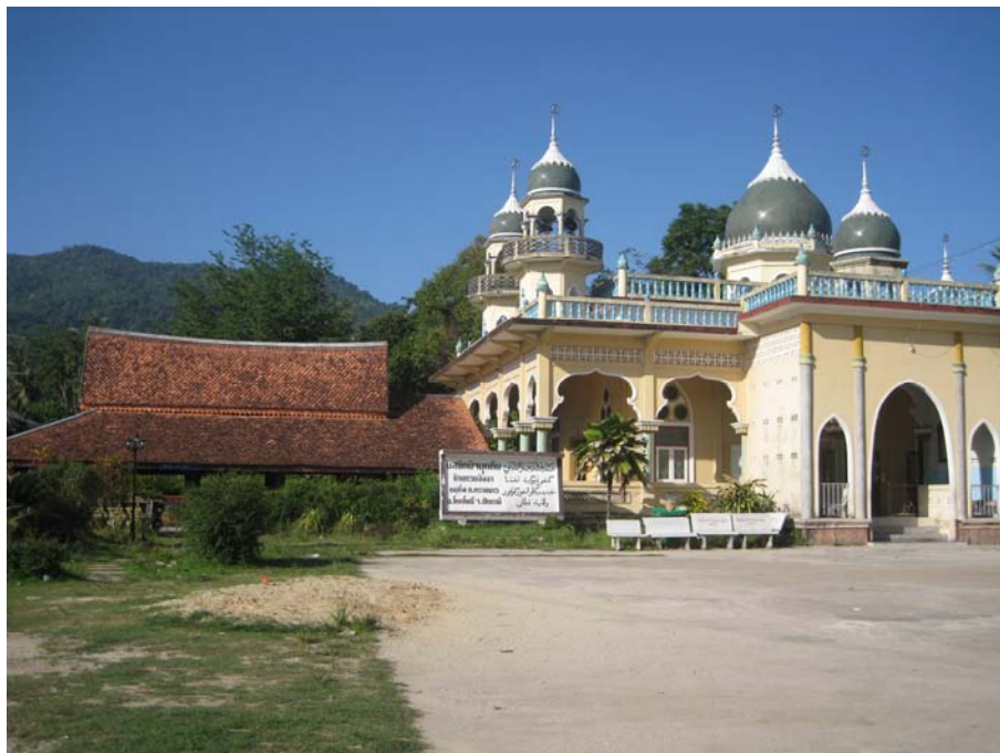
ภาพประกอบ 2 มัสยิดนัจมุดดิน ตำบลทรายขาว อำเภอโคกโพธิ์ จังหวัดปัตตานี