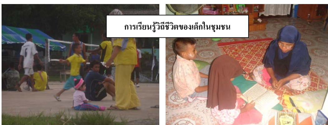
ภาพประกอบ 32-39 กิจกรรมมัสยิดและศูนย์การศึกษาอิสลามประจำมัสยิด (ตาดิกา) นัจมุดดิน