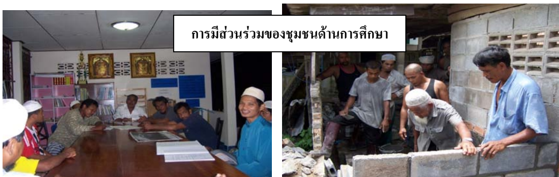
การมีส่วนร่วมของชุมชนด้านการศึกษา