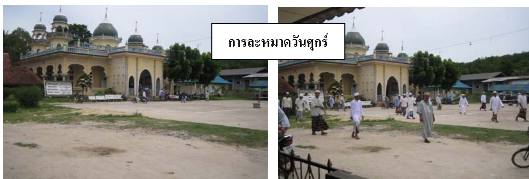
ภาพประกอบ 16-23 บรรยากาศการร่วมงานวันสำคัญทางศาสนาของชุมชนบ้านควนดั่งงา