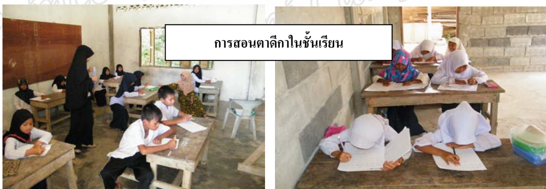
การสอนตาดีกาในชั้นเรียน