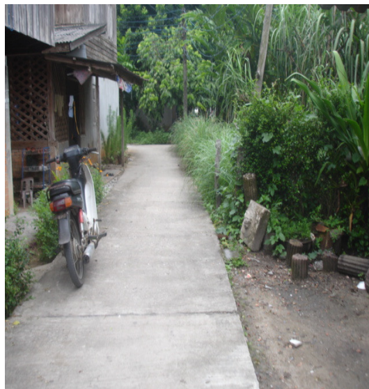
ภาพประกอบ 4-5 สภาพทั่วไปของชุมชนบ้านควนลังงา