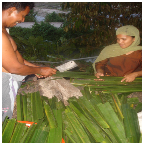
ภาพประกอบ 6-9 วิธีการดำเนินชีวิตของคนในชุมชนบ้านควนลังงา