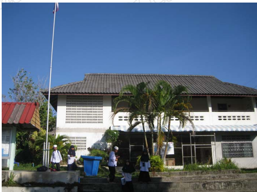
ภาพประกอบ 3 ศูนย์การศึกษาอิสลามประจำมัสยิด (ตาดีกา) นัจมุดดิน