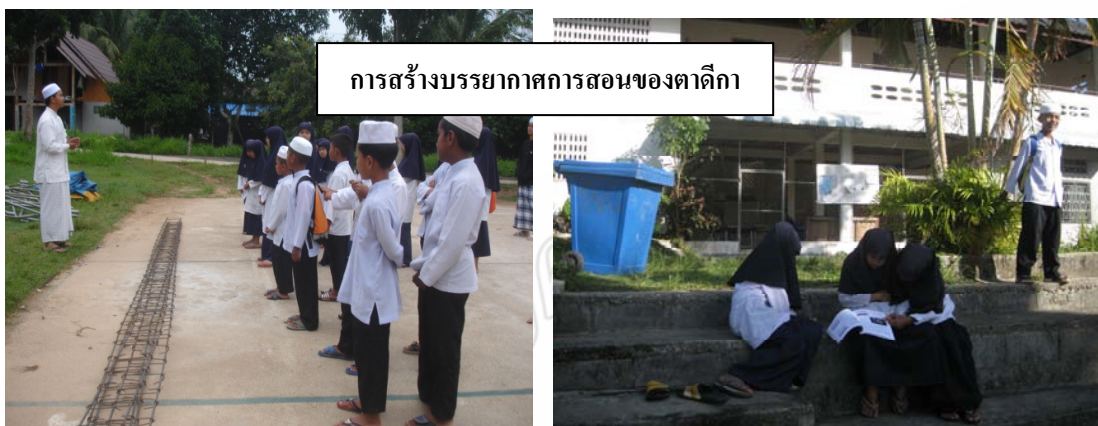
การสร้างบรรยากาศการสอนของตาดีกา