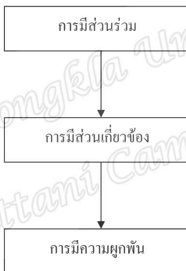
ภาพที่ 1 ความสัมพันธ์การมีส่วนร่วม

การให้บุคคลมีส่วนร่วมในองค์การนั้นบุคคลจะต้องมีส่วนเกี่ยวข้อง (Involvement) ในการดำเนินการหรือปฏิบัติการกิจง่าย ๆ ขององค์การ การที่บุคคลมีส่วนเกี่ยวข้อง ในกิจกรรมต่าง ๆ ย่อมทำให้บุคคลมีความผูกพัน (Commitment) ต่อกิจกรรมนั้น และมีความผูกพัน ต่อบุคลากรในที่สุด จึงทำให้เห็นว่าการมีส่วนร่วมทำให้เกิดการมีความเกี่ยวข้อง และมีความ เกี่ยวข้องก่อให้เกิดความผูกพัน ดังแสดงไว้ ตามภาพที่ 1