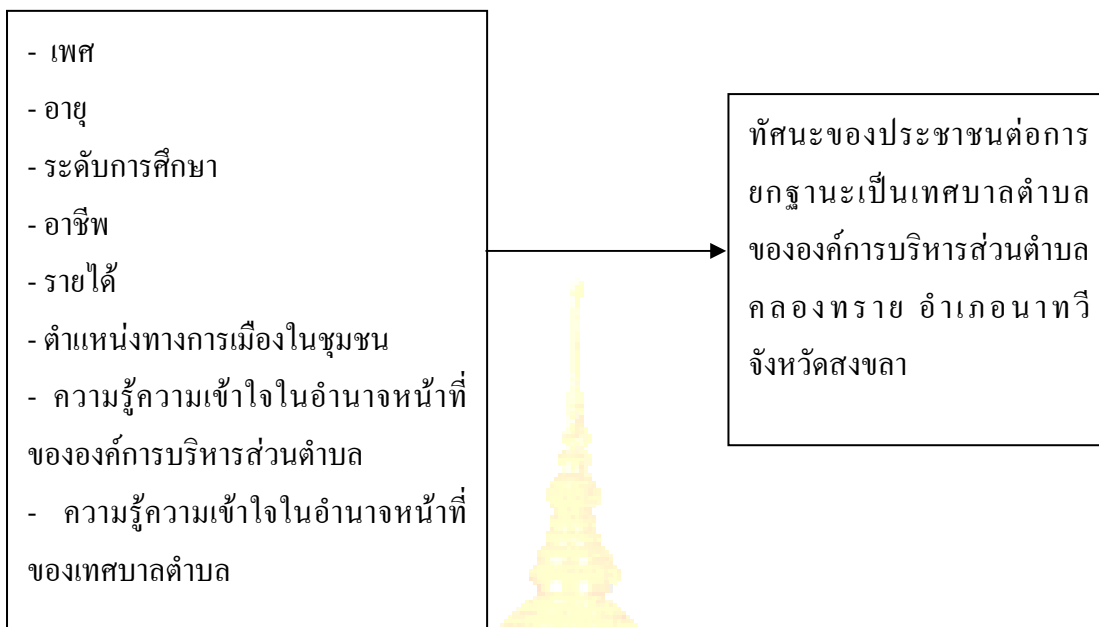
ภาพประกอบ 1 แนวคิดในการวิจัย