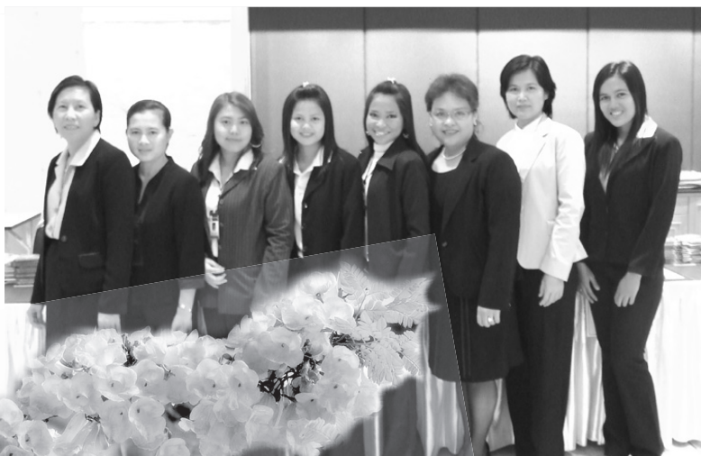
คณะผู้จัดทำ