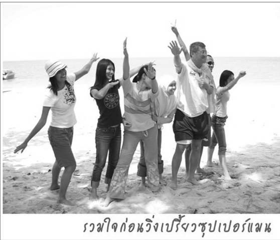
รวมใจก่อนวิ่งเปรี๊ยะวูชูปเปอร์แมน

ระบบคุณภาพที่มีอยู่เดิมคือ ISO 9000 นั้นได้ช่วยให้ผมทำงานได้ง่ายขึ้น ซึ่งต่อมาศูนย์เครื่องมือฯ ได้ขอ Version ใหม่ และเพิ่มระบบมาตรฐาน มอก.17025-2548 ได้อีก 4 รายการ