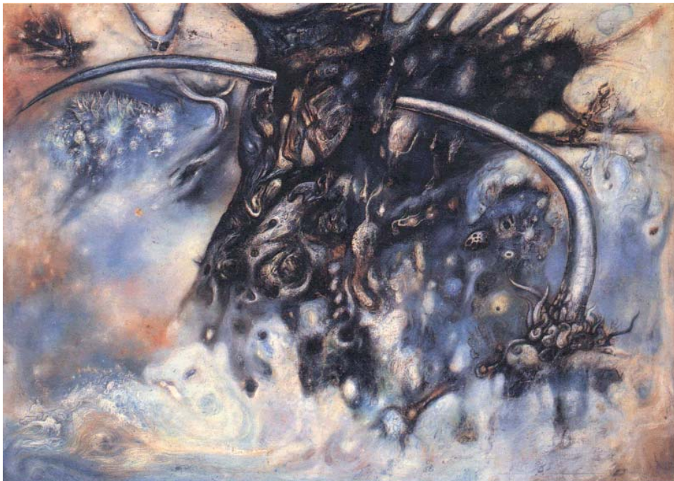
ภาพประกอบที่ 24 ชื่อภาพ ต้นไม้เหล็ก (2509) ผลงานสีฝุ่นบนผ้าดิบ ขนาด 88X 122 ซม.