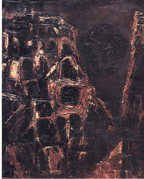
ภาพประกอบที่ 18 ชื่อภาพ พระอาทิตย์ดำ (2506) ผลงานสีน้ำมันบนผ้าใบ ขนาด 100 × 189 ซม.