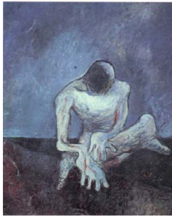
ภาพประกอบที่ 20 ชื่อภาพ ชีวิต (1) (2507) ผลงานสีน้ำมันบนผ้าใบ ขนาด 71 X 91 ซม.