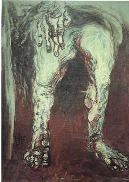
ภาพประกอบที่ 21 ชื่อภาพ ชีวิต (2) (2507) ผลงานสีน้ำมันบนผ้าใบ ขนาด 71 X 91 ซม.