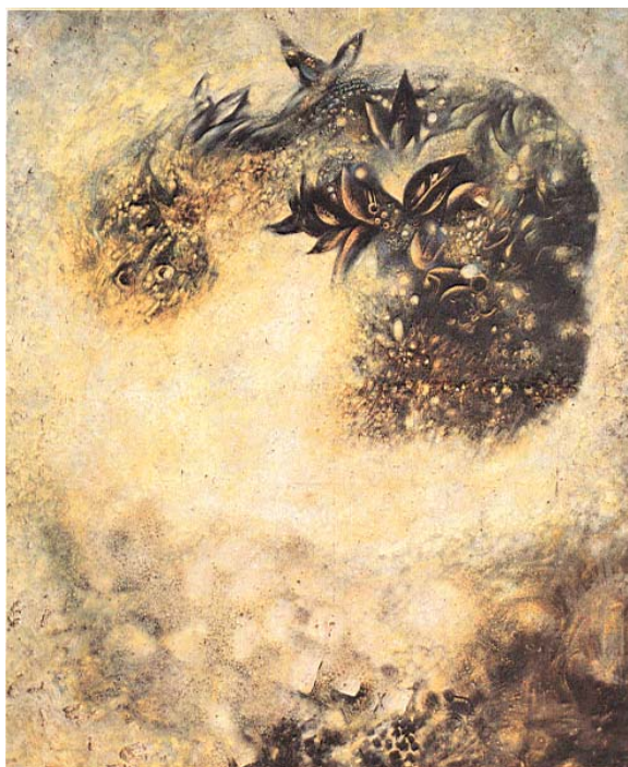
ภาพประกอบที่ 26 ชื่อภาพ รุ่งอรุณ (2509) ผลงานสีน้ำมันบนผ้าใบ ขนาด 150X 198 ซม.