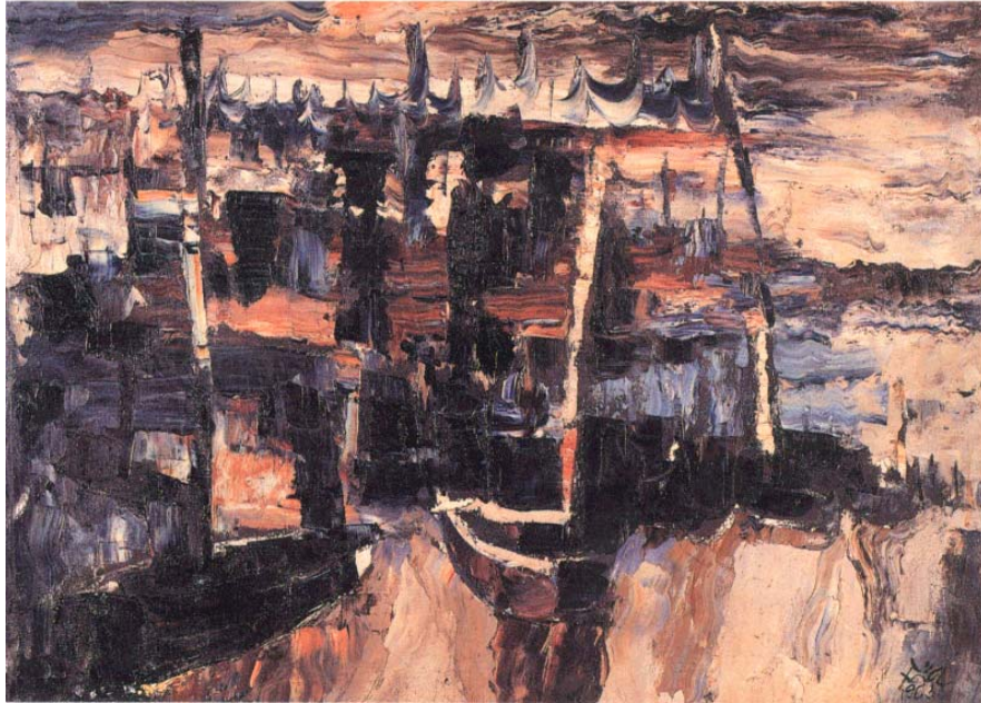
ภาพประกอบที่ 19 ชื่อภาพ ปากน้ำปรมาณู (2506) ผลงานสีน้ำมันบนผ้าใบ ขนาด 67 X 87 ซม.