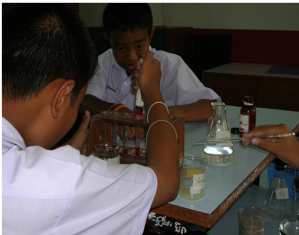
ขั้นค้นหาคำตอบ (Exploring)