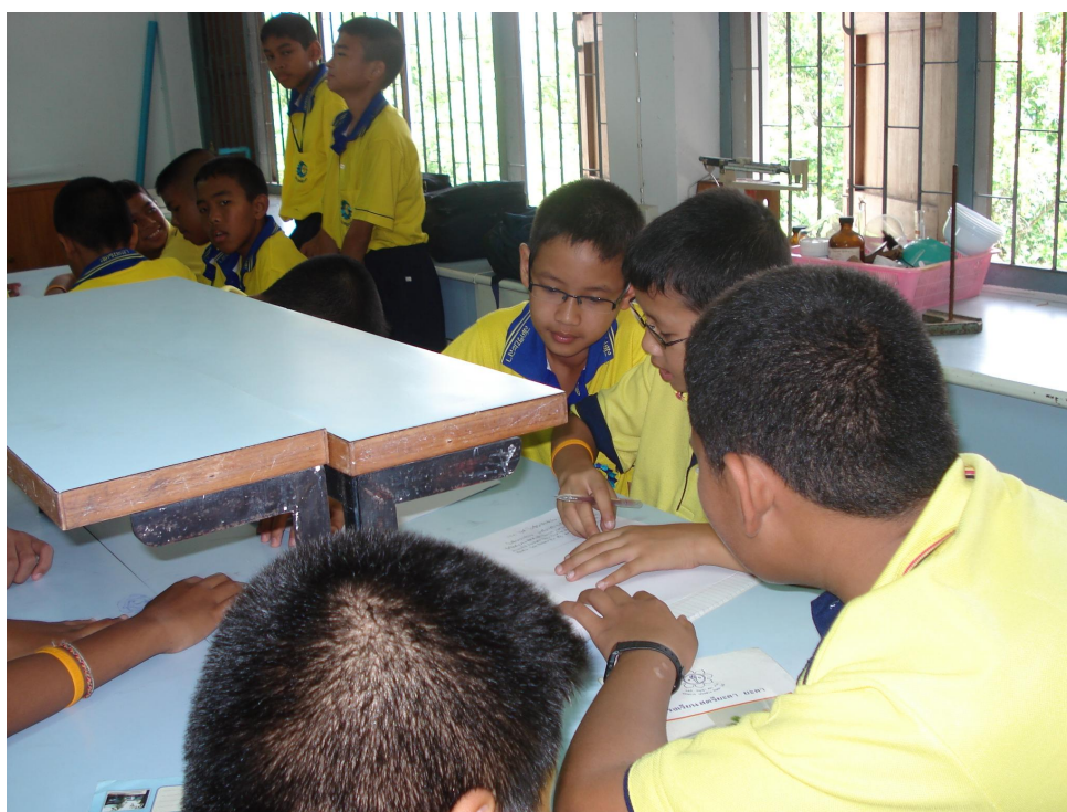
ขั้นวางแผนค้นหาคำตอบ (Planning)