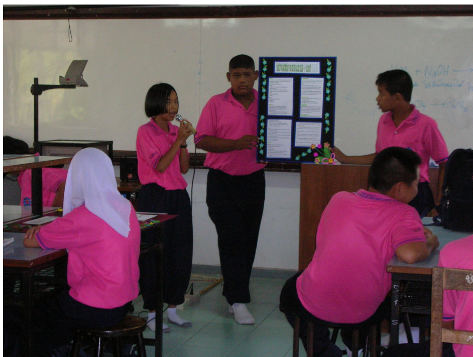
ชั้นแลกเปลี่ยนประสบการณ์ (Sharing)