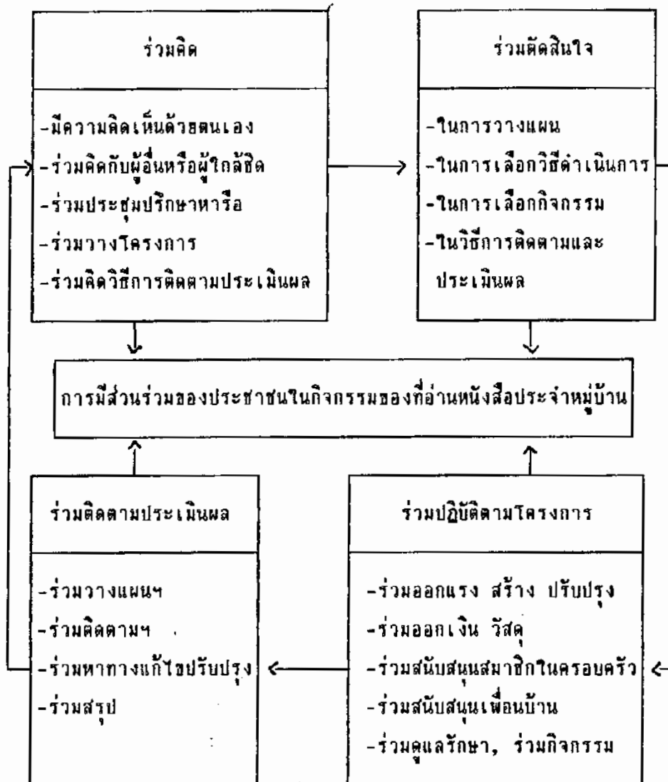
แผนภูมิ 1 แนวความคิดเชิงทฤษฎีเรื่องการมีส่วนร่วมของประชาชนในกิจกรรมของ ที่อ่านหนังสือประจำหมู่บ้าน

จากแผนภูมิ 1 แสดงให้เห็นว่า การมีส่วนร่วมของประชาชนในกิจกรรมของที่อ่านหนังสือประจำหมู่บ้านที่สำคัญมี 4 ด้าน ได้แก่ ร่วมคิด ร่วมตัดสินใจ ร่วมปฏิบัติตามโครงการและร่วมติดตามประเมินผล ซึ่งมีรายละเอียดลักษณะของการมีส่วนร่วมแต่ละด้าน สอดคล้องกับลักษณะสำคัญของการมีส่วนร่วมของประชาชนในการพัฒนาเขตตำบลละคอนเลื่อน อำเภอเมือง จังหวัดนครสวรรค์ กรมพัฒนาชุมชน (2518 : 23)