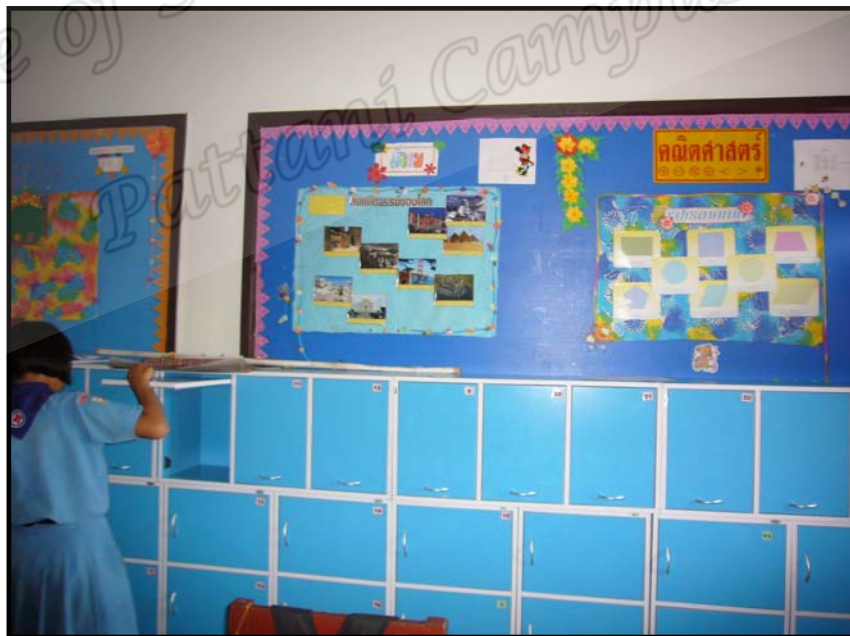
ล็อกเกอร์สำหรับใส่ของหลังห้องเรียน