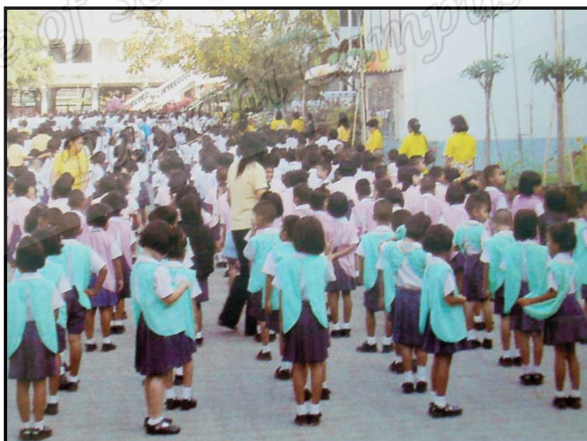
บรรยากาศในการเข้าแถว