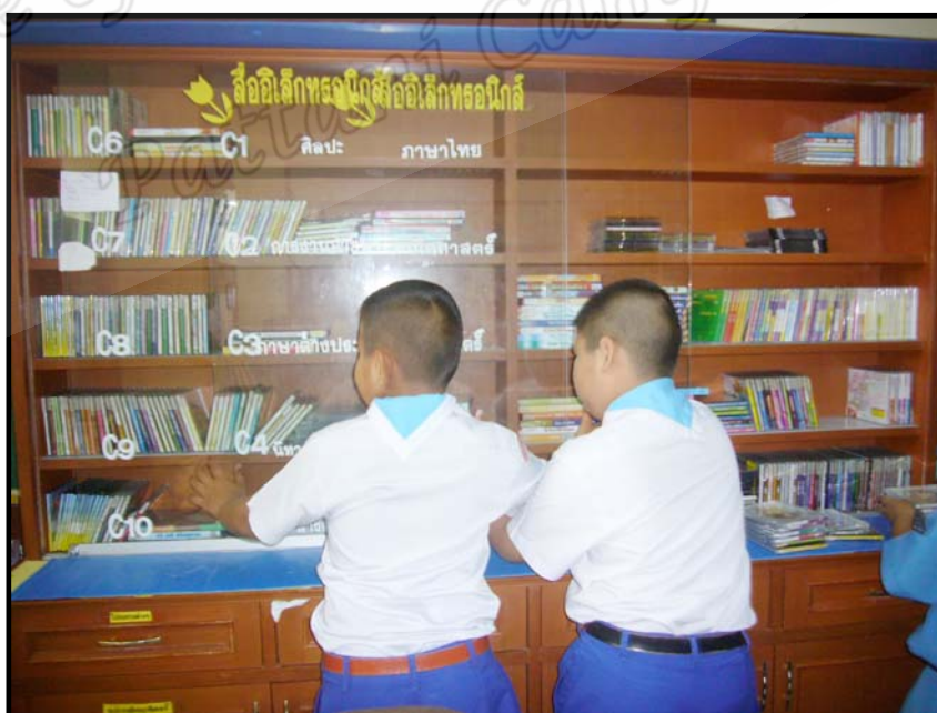
สื่ออิเล็กทรอนิกส์