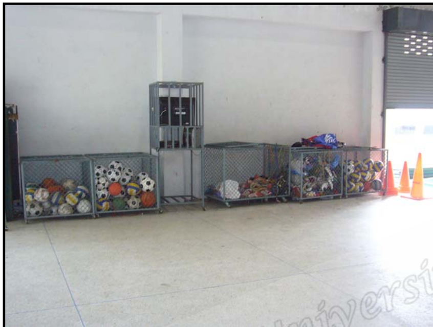
อุปกรณ์การเรียนการสอนในกลุ่มสาระการเรียนรู้ศึกษาและพลศึกษา