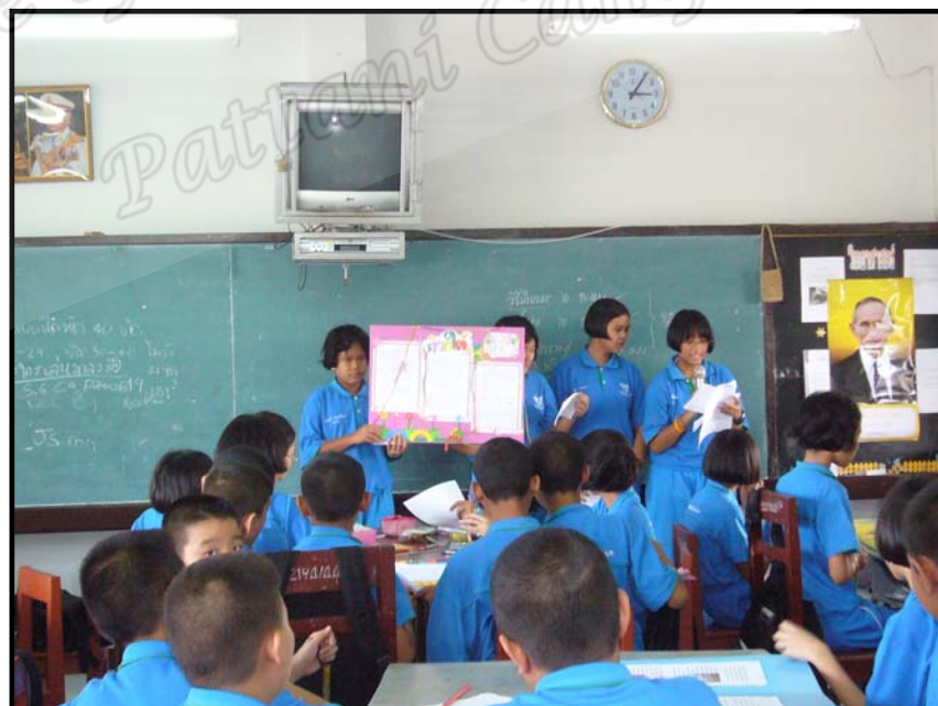
การนำเสนอผลงานนักเรียน