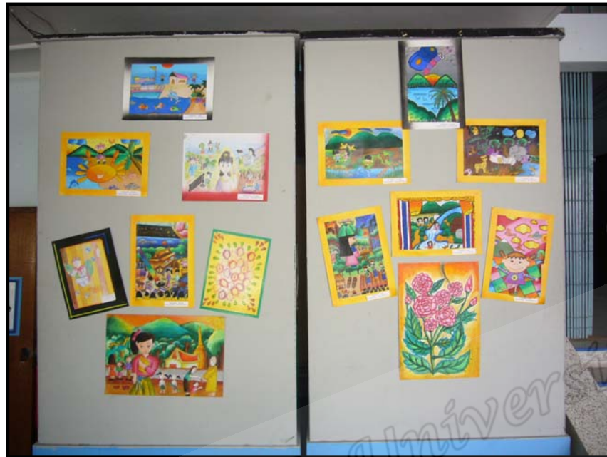
ผลงานนักเรียนในกลุ่มสาระการเรียนรู้ศิลปะ