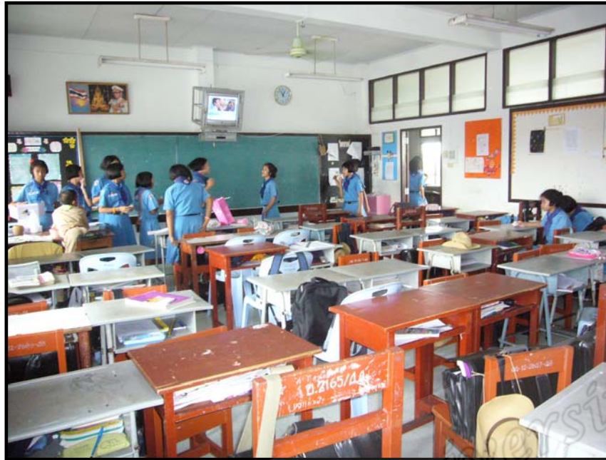
ห้องเรียน