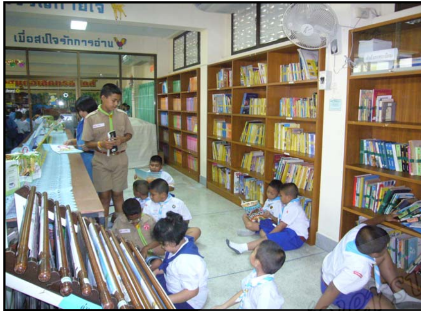
ห้องสมุด