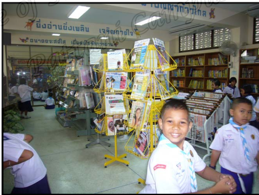
ห้องสมุด