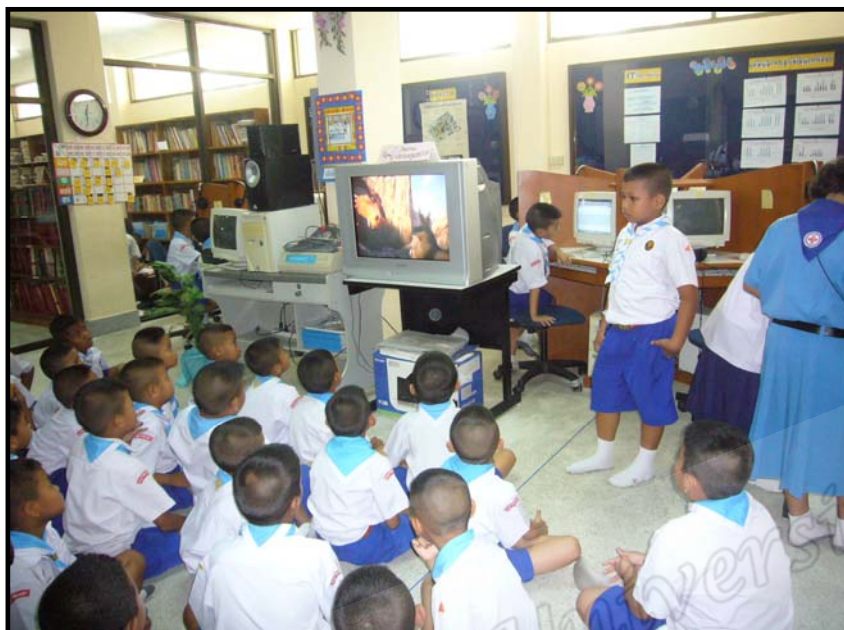
ห้องสมุดเด็กทรอนิกส์