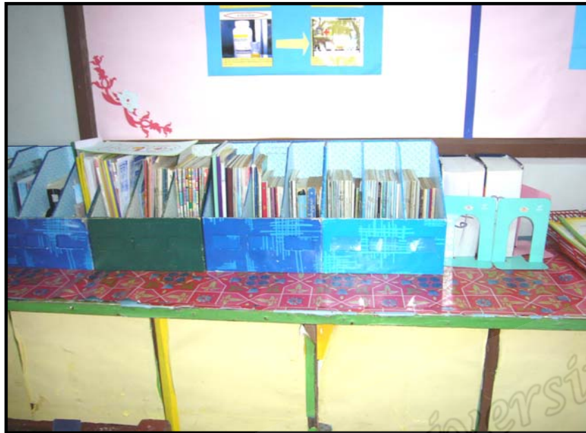
แหล่งเรียนรู้ในห้องเรียน