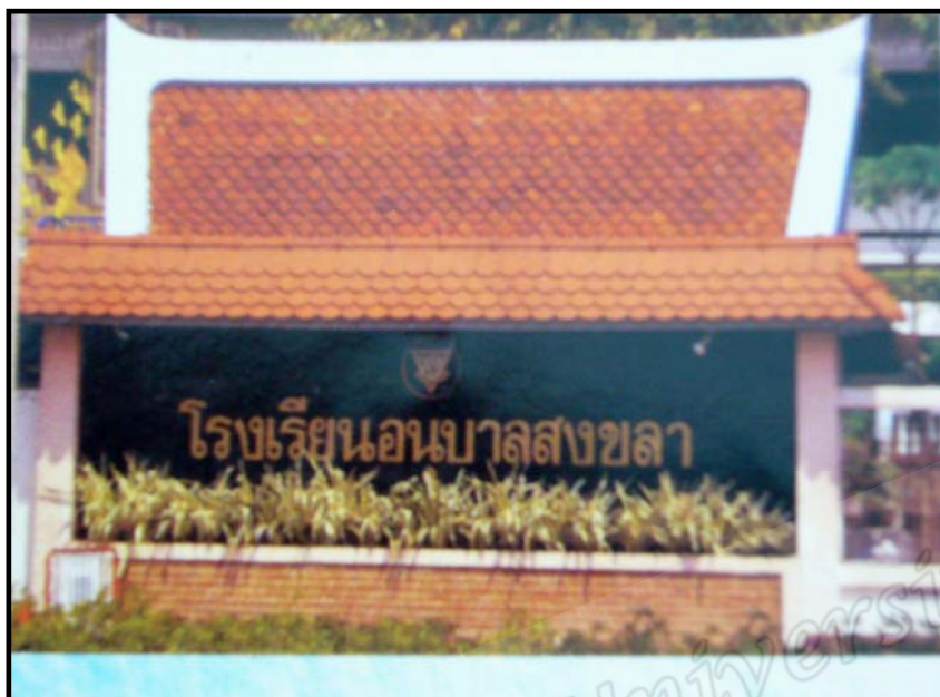
โรงเรียนอนุบาลสงขลา