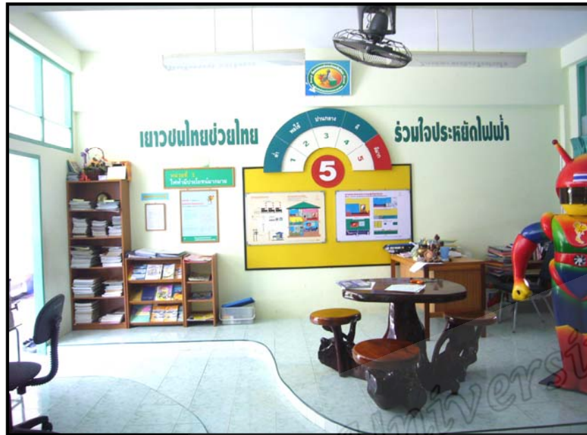
ห้องเรียนสี่เขียว