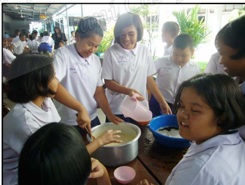
การปฏิบัติโครงการในกลุ่มสาระการเรียนรู้การงานอาชีพและเทคโนโลยี