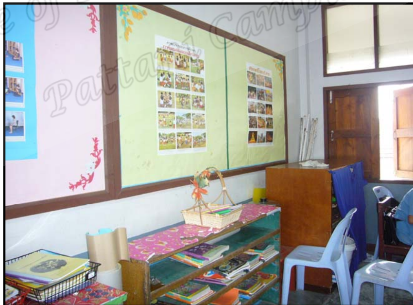
แหล่งเรียนรู้ในห้องเรียน