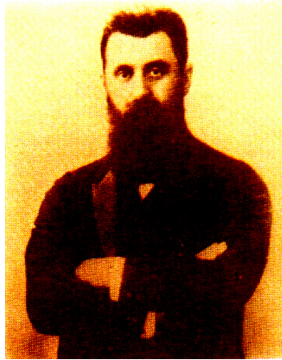
Theodor Herzl นักหนังสือพิมพ์ชาวเดนมาร์กสัญชาติฮังการีมีชีวิตอยู่ช่วงปี ค.ศ.1860-1904 ที่มา : หนังสือ Bahyah al-Ma'rifah. for Al-'Aamah Li al-Nashri Wa al-Tawzi'a Wa al-Ea'lam,1983, หน้า 308