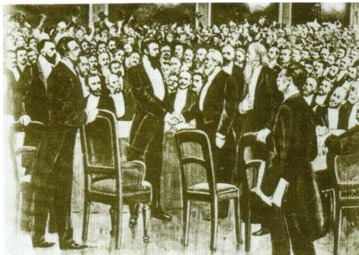
นายเยวคอร์ เฮอร์เซิล ได้จัดการประชุมชาวยิวครั้งแรกปี ค.ศ.1898 และได้ก่อตั้งองค์การไซออน นิสต์สากลที่กรุงบาเซิล ประเทศสวิสเซอร์แลนด์ ที่มา : หนังสือ Bahyah al-Ma'rifah. for Al-'Aamah Li al-Nashri Wa al-Tawzi'a Wa al-Ea'lam,1983,หน้า 308