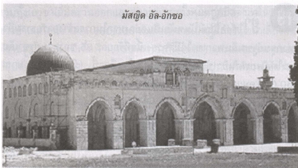
มัสยิดอัลอักซอ (al-Aqsa Mosque)