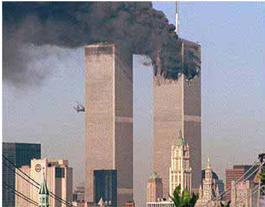
อาคารเวิร์ดเทรดเซ็นเตอร์ (WTC) ขณะถูกโจมตี

เหตุการณ์ 11 กันยายน พ.ศ. 2544 ทำให้เครือข่ายอัลกออิดะฮ์ภายใต้การนำของอูซามะฮ์ บินลาดีน 62 นักธุรกิจผู้ร่ำรวยชาวซาอุดีอาระเบียและพรรคพวกเกือบ 20 คน ซึ่งส่วนใหญ่จะเป็นสัญชาติ ซาอุดีอาระเบียและนับถือศาสนาอิสลามตกเป็นผู้ต้องหา โดยหน่วยข่าวกรองมอสсадของอิสราเอลเคยวางแผนสังหารอูซามะฮ์บินลาเดนในปี 1996 63 แต่ไม่ประสบผลสำเร็จ