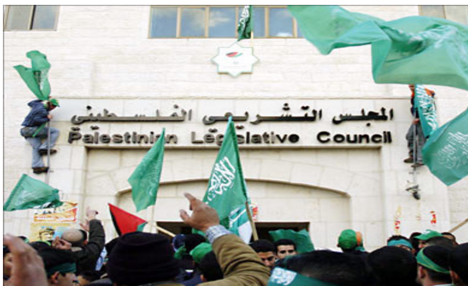
รัฐสภาของปาเลสไตน์

วันที่ 25-27 มกราคม ค.ศ. 2006 ชาวปาเลสไตน์ได้มีสิทธิออกเสียงเลือกตั้งรัฐสภา 52 เป็นครั้งแรกหลังไม่ได้มีการเลือกตั้งรัฐสภามานานถึงหนึ่งทศวรรษ ประชาชนราว 1.4 ล้านคนในฉนวนกาซา ดินแดนเวสต์แบงก์ที่ถูกยึดครองและในเขตตะวันออกของกรุงเยรูซาเล็ม มีสิทธิเลือกสมาชิก 132 คน แห่งสภานิติบัญญัติของชาวปาเลสไตน์ โดยเลือกพรรคหนึ่งจากทั้งหมด 11 พรรคซึ่งมีอยู่ในบัญชีทั่วประเทศของชาวปาเลสไตน์ และเลือกผู้สมัครกว่า 400 คน ซึ่งผลในการเลือกตั้งครั้งนี้ปรากฏว่ากลุ่มฮามาสชนะกลุ่มอัลฟาตาห์ด้วยคะแนนเสียงข้างมาก 76 ที่นั่งจากทั้งหมด 132 ที่นั่ง ขณะที่พรรคฟาตาห์ได้เพียง 43 ที่นั่ง แม้ว่าปัจจุบันชาติต่างๆพยายามกดดันอิสราเอลให้สิทธิชาวปาเลสไตน์เลือกตั้งรัฐสภาเพื่อปกครองอิสระ แต่สหรัฐอเมริกาและกลุ่มประเทศตะวันตกยังต้องการให้พรรคฮามาสปลดอาวุธต่อต้านอิสราเอล ในขณะที่อิสราเอลแถลงยืนยันว่าจะไม่เจรจากับรัฐบาลปาเลสไตน์ใดๆ ที่มีพรรคฮามาสรวมอยู่