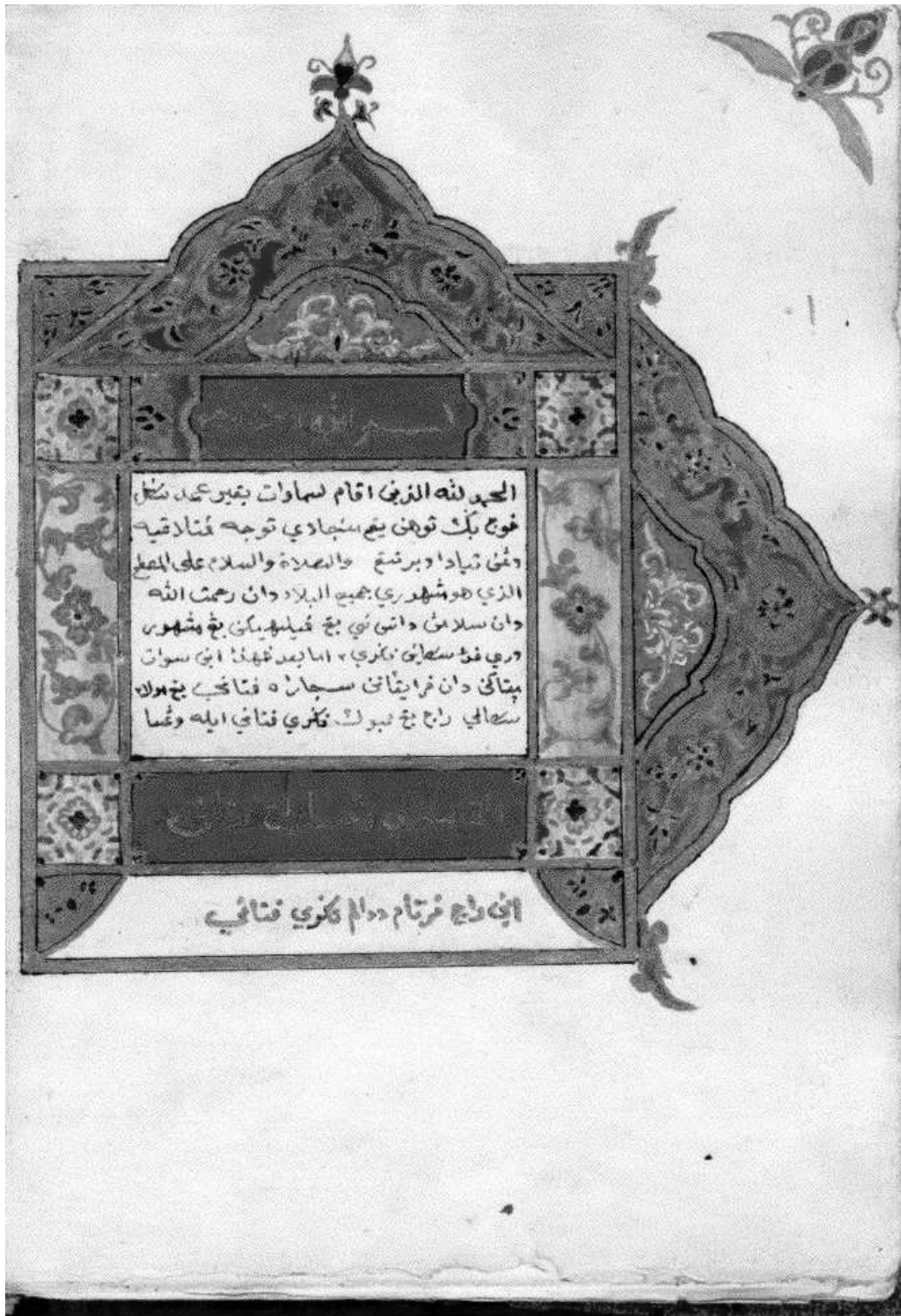
MSS 809 Sejarah Patani

ภาพที่ 5 หนังสือประวัติศาสตร์ปัตตานี เขียนเมื่ออิซเราะฮ์ศักราช 1202