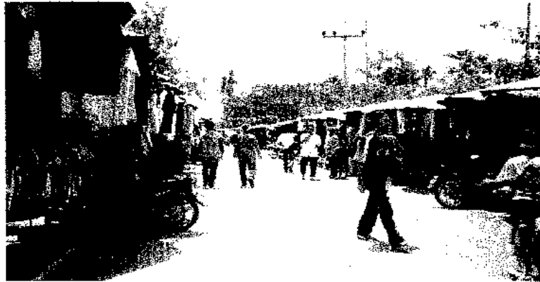
ภาพประกอบ 10 บรรยากาศสองฝั่งถนนที่พลุกพล่านด้วยผู้คนและเต็มไปด้วยเสื้อผ้า