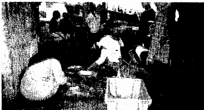
ภาพประกอบ 8 แรงงานเด็กกำลังคัดปลางวงจะเสร็จ