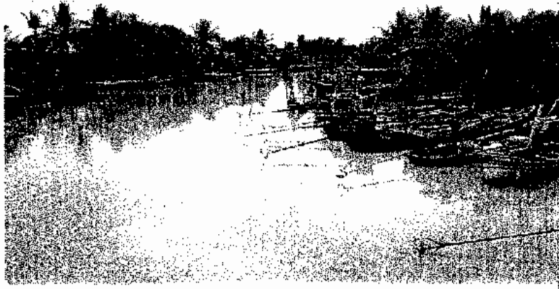
ภาพประกอบ 4 เรือประมงของชาวบ้านบางปลาหมอ