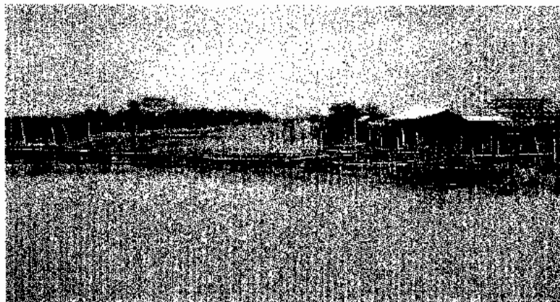
ภาพประกอบ 5 การเลี้ยงปลาในกระชัง