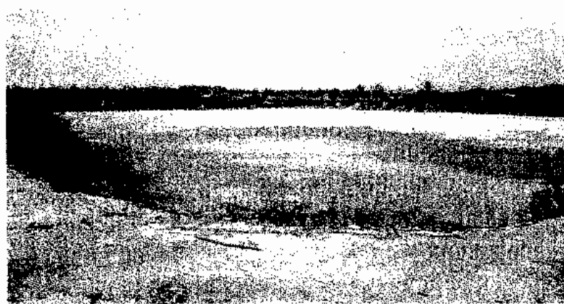
ภาพประกอบ 6 สภาพนาทุ่งร้าง