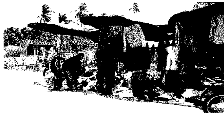
ภาพประกอบ 12 เสื้อผ้ามือสองที่กองขายในราคาประมาณตัวละสี่ถึงยี่สิบบาท