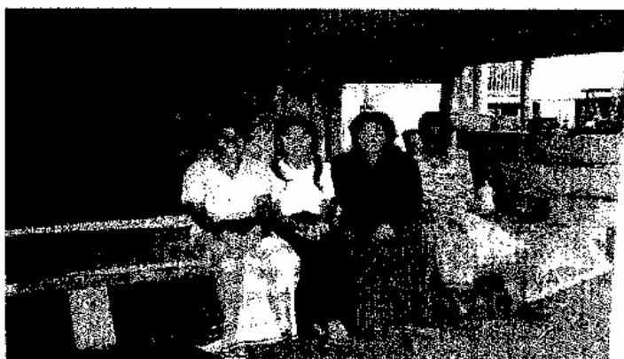
ภาพประกอบ 14 แรงงานเด็กและผู้ปกครอง