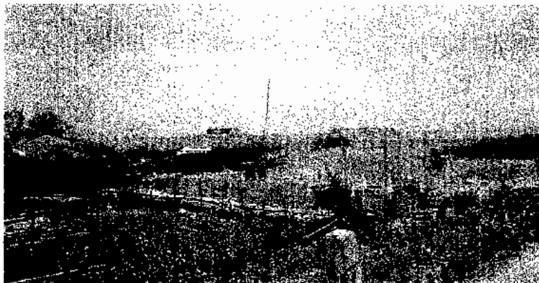
ภาพประกอบ 13 บรรยากาศร้านขายส้มตำริมคลองชลประทาน