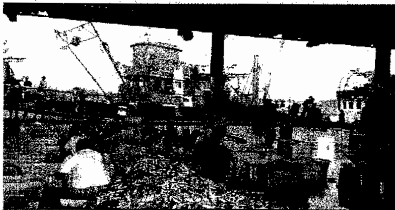
ภาพประกอบ 7 กองปลาสูงพะเนินที่รอการคัดแยก

สภาพและบรรยากาศการทำงานของแรงงานเด็กคัดปลาในท่าเทียบเรือประมงปัตตานี